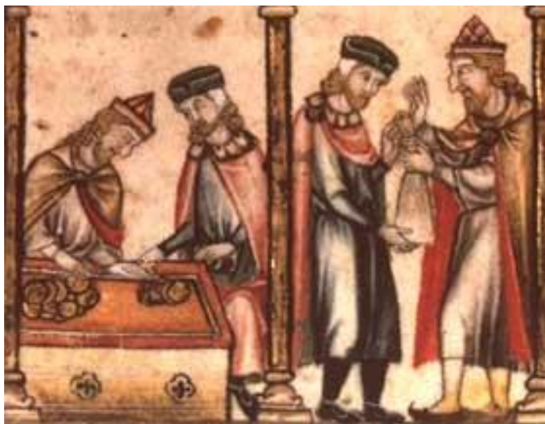
Příloha 1 - Výřez z miniatury znázorňující židovského lichváře (se špičatým kloboukem) při předávání peněz. 115