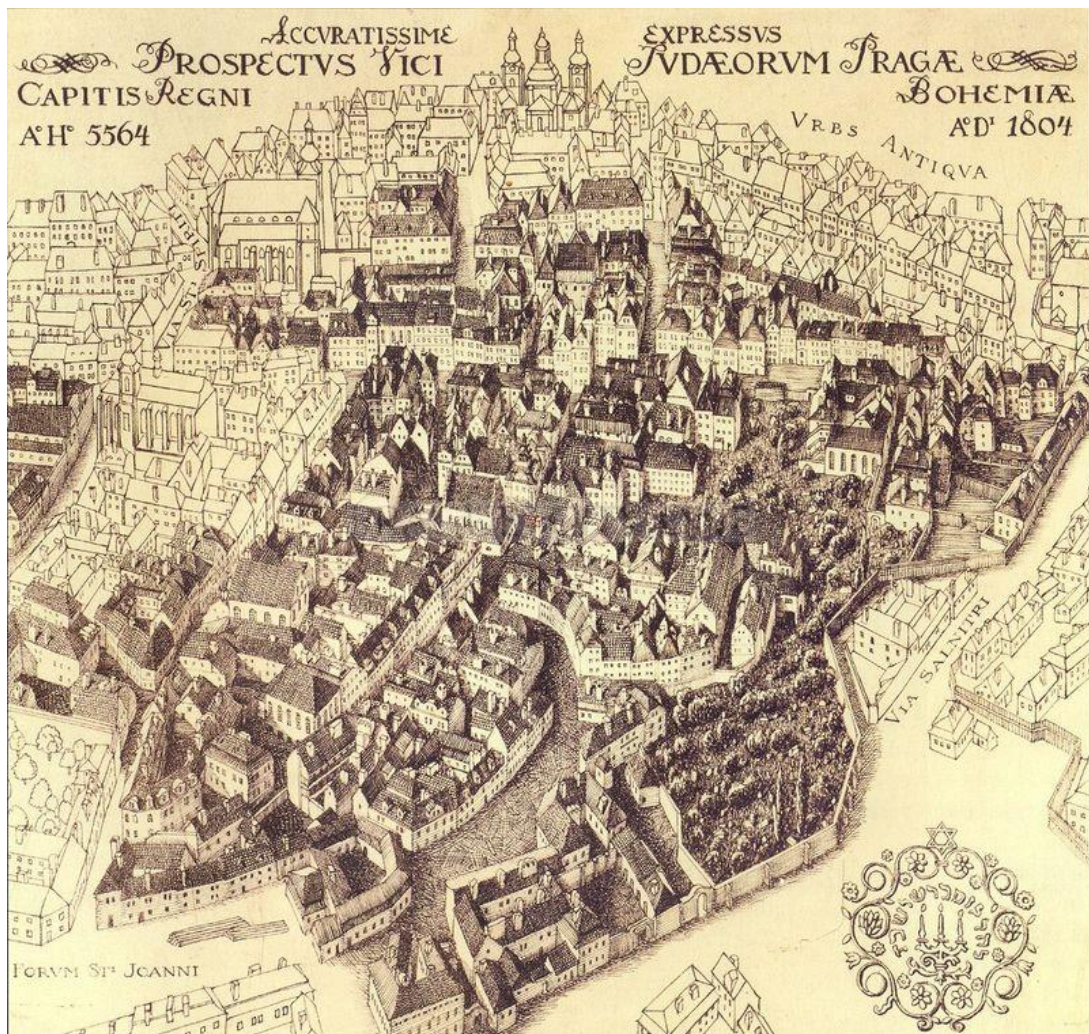
Příloha 3 - Židovské město na počátku 19. století podle Langweilova modelu Prahy. 117