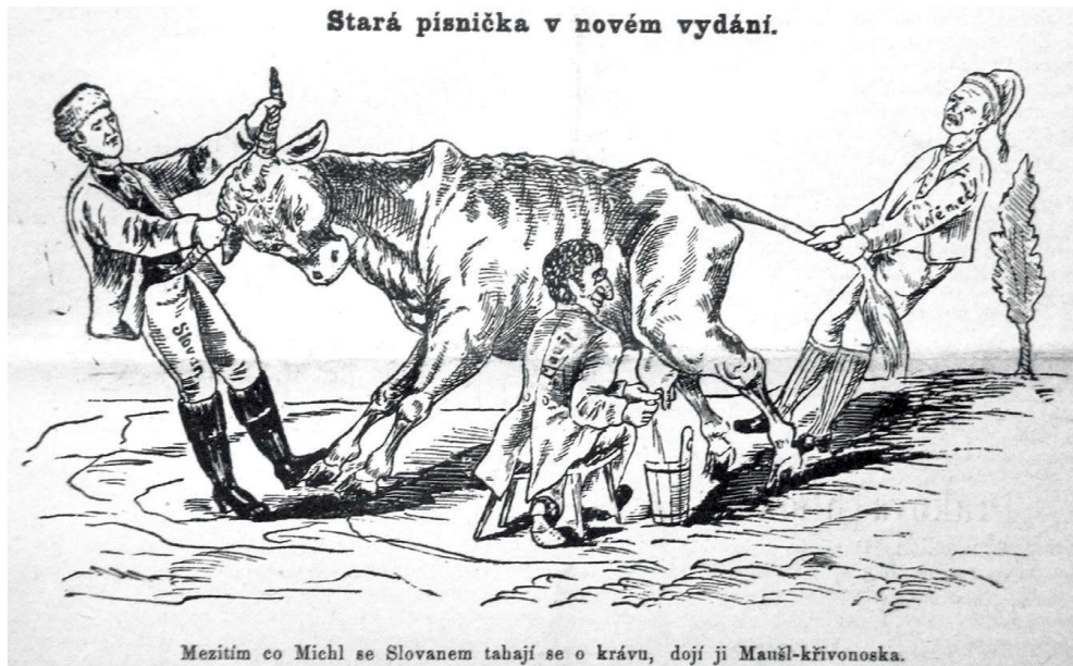
Příloha 9 – Dobová karikatura znázorňuje Čecha a Němce, jak se přetahují o krávu, zatím co Žid může pohodlně obě strany „vysávat“. 123