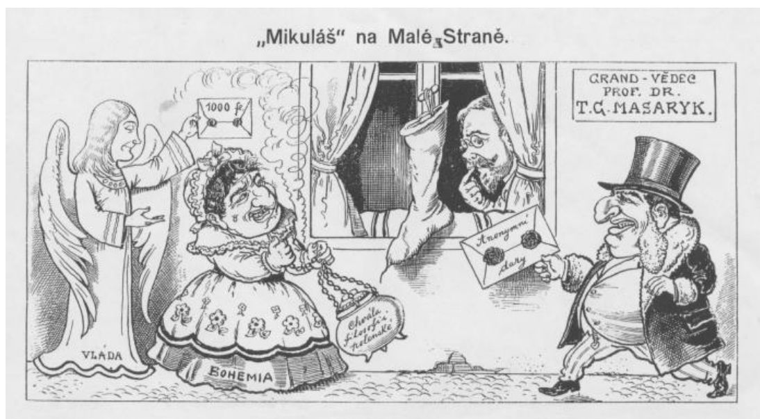
Příloha 5 – Satiricko-politický týdeník Šípy obviňuje T. G. Masaryka, že je placen Židy. 119