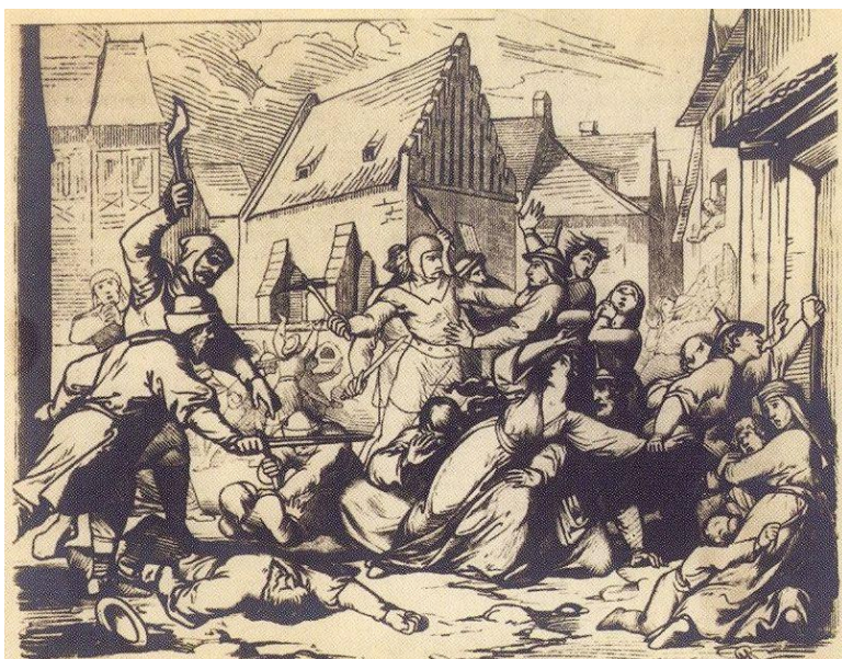
Příloha 2 - Velikonoční pogrom v Praze roku 1389 – malba od Josefa Vojtěcha Hellicha. 116