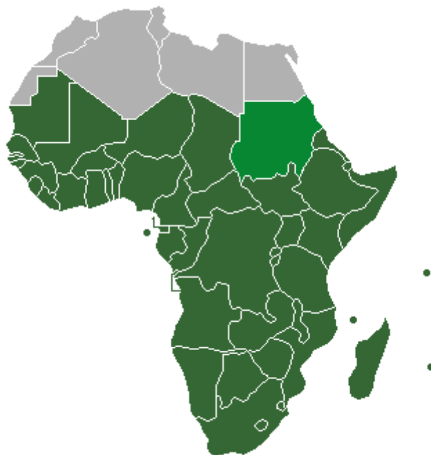
Obr. č. 4: Subsaharská Afrika