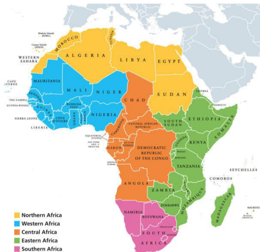
Obr. č. 1: Mapa Afriky a jejích regionů