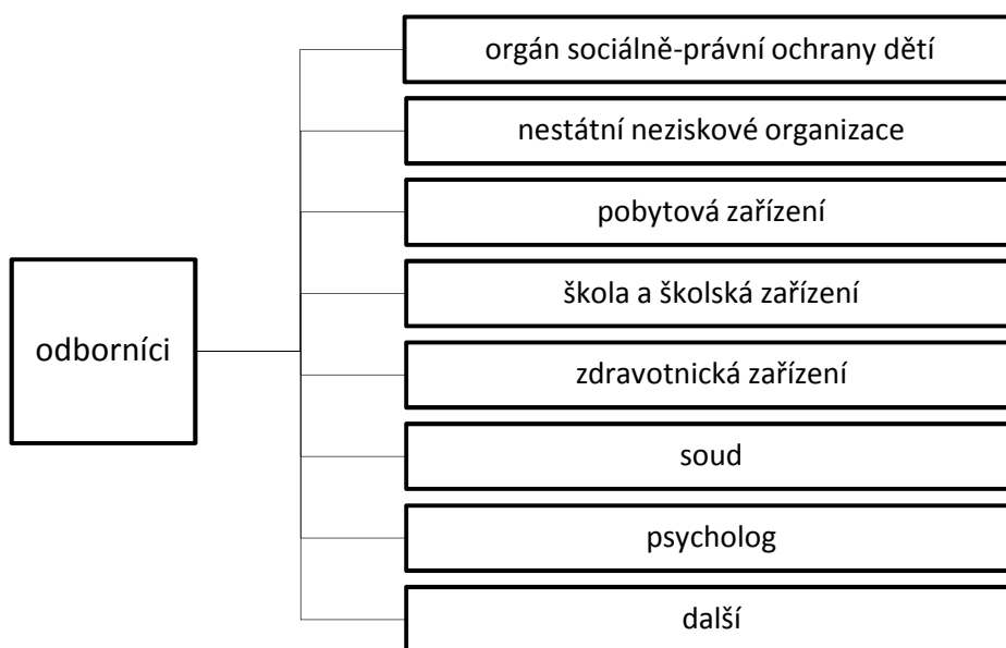
Obrázek č. 3. – Odborníci případových konferencí. 98

Je důležité zmínit, že odborníkům, kteří se účastní, náleží náhrada mzdy nebo platu. Případová konference je uskutečňovaná při zajišťování sociálně-právní ochrany dětí, a proto je její financování zajištěno dotací na výkon státní správy. Pokud se případové konference zúčastní přizvaní odborníci, kteří budou požadovat náhradu mzdy či platu za účast, poskytne se jim úhrada tak, jak členům komise pro sociálně-právní ochranu dětí. 99