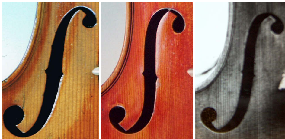
Obr. 6: Ozvučné otvory Vitáčkových nástrojů z let 1889, 1884, 1881

Dle objevených nástrojů můžeme usuzovat, že František Vitáček stavěl housle ve Sklenařicích do roku 1889. U této práce můžeme pozorovat proměnu stylu Františka Vitáčka, od krkonošských počátků až k vlastní osobité tvorbě. Toto je nejvíce znatelné v porovnání s violou z roku 1889.