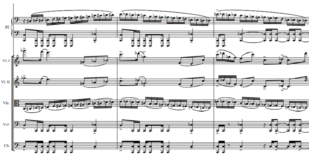
Obr. 10 Notová ukázka: La buona morte . Takty 34–36.

Pro skladbu jsou také charakteristickým a opakujícím se znakem četné rozsáhlé chromatické běhy (viz obr. 10). Ty je možné interpretovat jako odkaz k tzv. madrigalismům, tedy chromatickým pasážím, kterými skladatelé 16. století líčili obsah textu. Zároveň Filas využívá také prodlevy na tremolech a trylcích (např. part flétny a smyčců viz obr. 11) či ostinátní vedení smyčců.