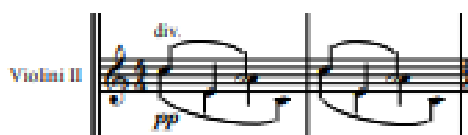
Obr. 7 Notová ukázka: Stabat Mater Dolorosa. Stabat mater . Takty 1–2.

Čtvrtá část Fac me tecum je charakteristická svým dynamickým a výrazovým obloukem vytvořeným pomocí plynulých změn v nástrojovém obsazení, tempu apod. V rámci hlasů je určena pouze sólovému tenoru. Fac me cruce custodiri se poté v mnohých ohledech vrací k předchozím částem hudby a uzavírá tak celé dílo. Jde tedy o motivické scelení a posílení cykličnosti díla. Jako příklad lze uvést otevření melodickým postupem smyčců a harfy použitým již v úvodní Stabat mater (porovnání viz obr. 7 a obr. 8) a taktéž stejné obsazení hlasů, a to čtyřhlasý sbor se sóly sopránu a tenoru.