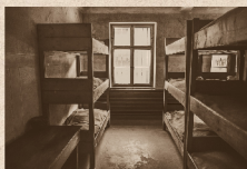
Cela v Malé pevnosti Terezín

Lustigovi pomalu končilo bezstarostné dětství. Začal pocítovat, že se něco změnilo. Židovské děti najednou nesměly chodit do školy, dospěli do práce. Lidé se začali dělit na dva tábory. Na jedné straně stáli ti, kteří vůči Židům projevovali solidaritu, na druhé