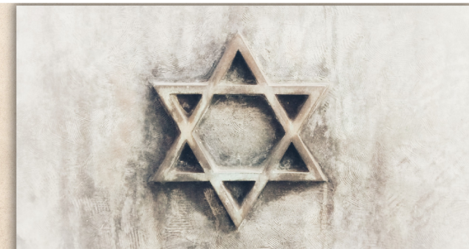
Davidova hvězda - historicky je spojena s judaismem a má hlubokou symboliku. Během druhé světové války musel být hvězdou označen každý Žid starší šesti let, a tak se stala symbolem nacistického útlaku.