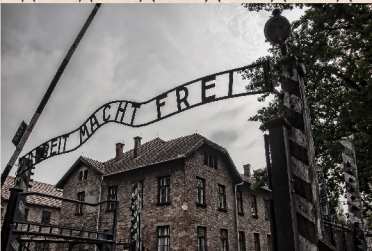
Při vstupu do Auschwitz - Birkenau

Někdo má štěstí a svůj život prožije v klidu, bez většího množství překážek a nepříjemných událostí. Arnošt Lustig takové štěstí neměl. Narodil se do židovské rodiny a jeho dětství a dospívání určovali Němci, nacistická okupace a holocaust. Téměř tři roky strávil v koncentračních táborech. I přes to všechno říká: „Prožil jsem šťastné dětství a bohatý zbytek života.“ Všechny tyto události ho přiměly k napsání mnoha knih, které málokdy vybočují z témat holocaustu.