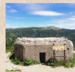
Lehký objekt vzor 37