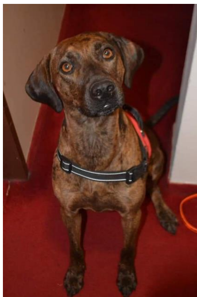
Obrázek 2 Foto psa 2 - Terri.