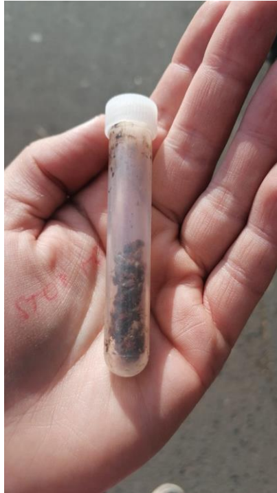
Obrázek 6 Ukázka míry infestace v jednom z napadených bytů sociálně vyloučených občanů bloku 525, zkumavka plná živých jedinců Cimex lectularius.