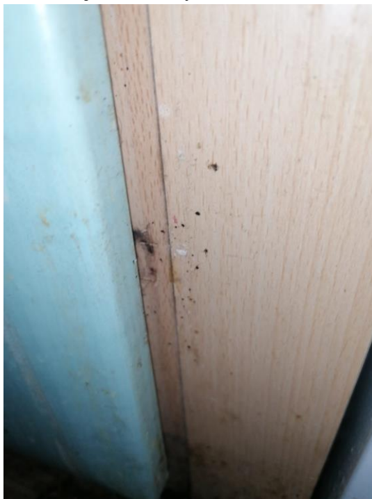
Obrázek 5 Ukázka míry infestace štěnicemi v jednom z napadených bytů sociálně vyloučených občanů bloku 525.

Bohužel Společenství vlastníků tohoto domu odmítá uhradit plošné sanační zásahy DDD a tím vlastně podporuje infestaci dalších a dalších bytů. Většina nájemníků je v dobré finanční situaci a jsou schopni si postřík DDD uhradit, ale po čase stejně znovu dojde k infestaci jejich bytu. V tomto domě pracují detekční psi pravidelně, především pro určení, kam až postoupila hranice infestace, ukázkou ze zásahu v jednom z bytů můžeme vidět níže na obrázku 5, 6 a 7.