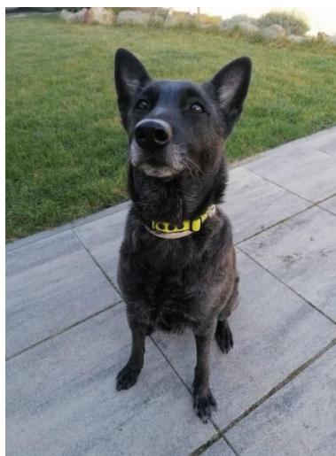
Obrázek 4 Foto kontrolního psa 4 - Ally.