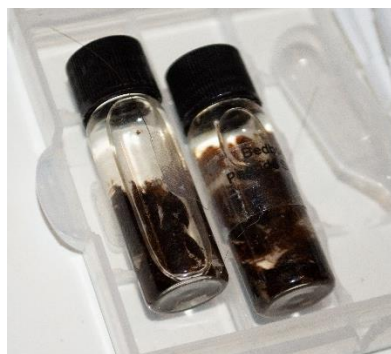
Obrázek 9 Přípravek PSEUDOSCENT KIT používaný v experimentální části výzkumu

Pokus byl vždy připraven tak, že pomocník lahvičku s Kitem umístil na předem určené místo. Toto místo bylo voleno tak, aby věrně kopírovalo místa, kde se nejvíce štěnice zdržují při reálných zásazích. Při nácviku bylo zapotřebí na některá místa vzorek neumístit, abychom, co nejvěrněji simulovali reálnou detekci, a bylo tak možné porovnat nasazení psů v realitě a pokusu. Bylo nutné, aby měl pomocník při manipulaci gumové rukavice, aby se zabránilo možné náhodné kontaminaci pachem pomocníka. Postup psovoda byl po umístění návnady pomocníkem naprosto shodný s vyhledáváním ve výše zmíněném reálném prostředí. Označení pozitivního nálezu můžeme vidět na obrázcích 10 a 11 níže.