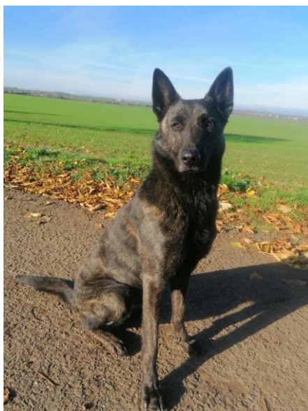
Obrázek 1 Foto psa 1 – Nubi.