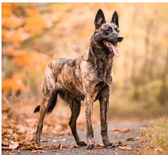
Obrázek 3 Foto psa 3 - Mia.

Pracovní pes musí být ale zároveň zdravý, Mia podstoupila veškerá možná zdravotní vyšetření a kvůli svým kvalitám se stala chovnou fenou. Měla již dva vrhy, štěňata z těchto vrhů zdědila vysokou kvalitu čichu a pracují v několika sektorech – Vězeňská služba, Hasiči ČR, Svaz záchranných brigád kynologů ČR, Sbor dobrovolných hasičů.