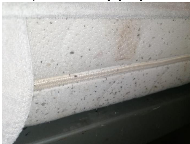
Obrázek 7 Ukázka infestace Cimex lectularius nalezených v bytě v bloku 100 (foto: J. Hofferová 2022).

Jedná se o bloky domů začínající čísla 100. Je to nejstarší část tzv. nového Mostu, část označovaná jako Podžatecká čtvrť a nachází se mezi ulicemi Žatecká, třída Budovatelů a Fr. Halase. Soubor staré cihlové zástavby bytů. Byty jsou krásné velké, většina z nich byla rovněž rozprodána soukromníkům pro investiční záměry. Díky tomu je více než polovina obyvatel s nižší finanční úrovní (pobírají sociální dávky, registrovaní na ÚP), opět dochází ke stěhování nábytku neznámého původu do bytů. Dochází zde úplně ke stejnému scénáři jako v Javorov Blok 525, naštěstí zde je Společenství vlastníků ochotné uhradit DDD firmě provedení desinsekce. vyvstává zde však jiný problém a to, že nájemníci odmítají DDD firmu vpustit do bytů, patrně z obav ze sociálního vyloučení okolím v případě pozitivního nálezu.