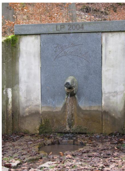
Obr. 1 Kančí studánka

Velmi důležitou informací je, že tyto objekty jsou budovány bez újmy na hospodaření v lesních porostech, ve kterých se používají velmi intenzivní hospodářské způsoby. Estetika se stává samozřejmou součástí práce lesního hospodáře a tyto památníky estetičnost prostředí zvyšují. Na Obr. 1 a 2 můžeme vidět, s jakou propracovaností a nápaditostí jsou vytvářeny místní studánky.