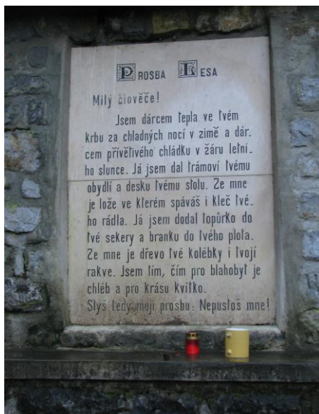
Obr. 2 Studánka Prosba lesa