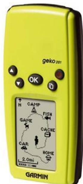
Obr. 3 Ruční přístroj GPS Garmin Geko 201

( http://www.nakupka.cz/vyrobek/navigacni-system-garmin-geko-201-outdoor/ )