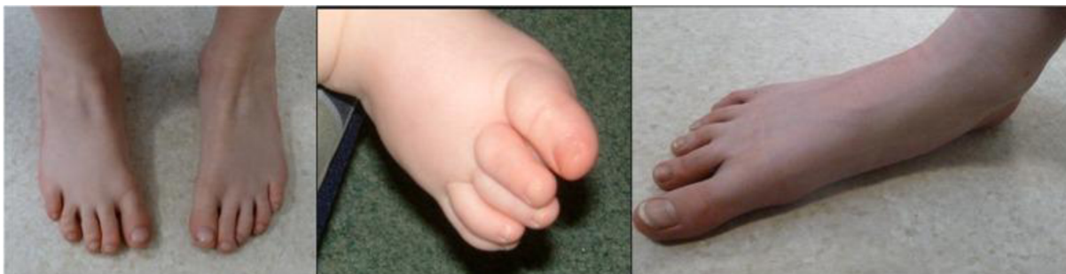
Obrázek 5 Menší končetinové malformace sledované u FVS. Hypoplastické a překrývající se prsty a zploštění klenby v důsledku kloubní laxnosti často spojené s FVS (Clayton-Smith, 2019).

a obsahuje hodnocení kognitivního, řečového a motorického vývoje, paměti, pozornosti (Clayton-Smith, 2019).