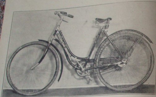
Abbildung — vyobrazení I.