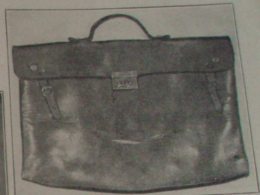
Abbildung — vyobrazení III.