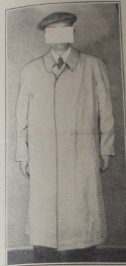
Abbildung — vyobrazení II.