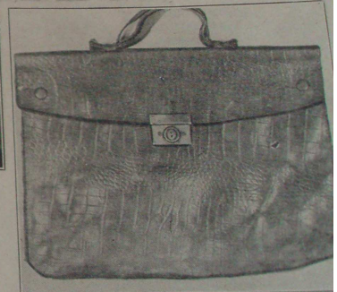
Abbildung — vyobrazení IV.