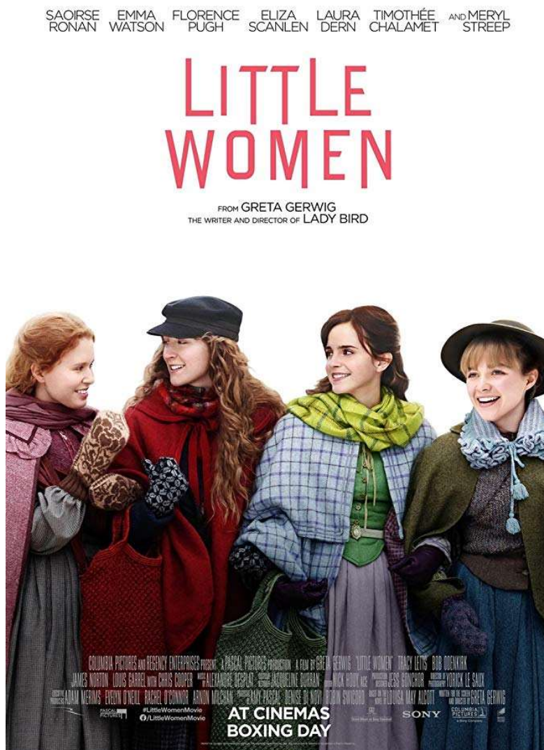
Obr. č. 1: Plakát k filmovému zpracování Malých žen z roku 2019 (ČSFD.cz – Malé ženy , 2019)