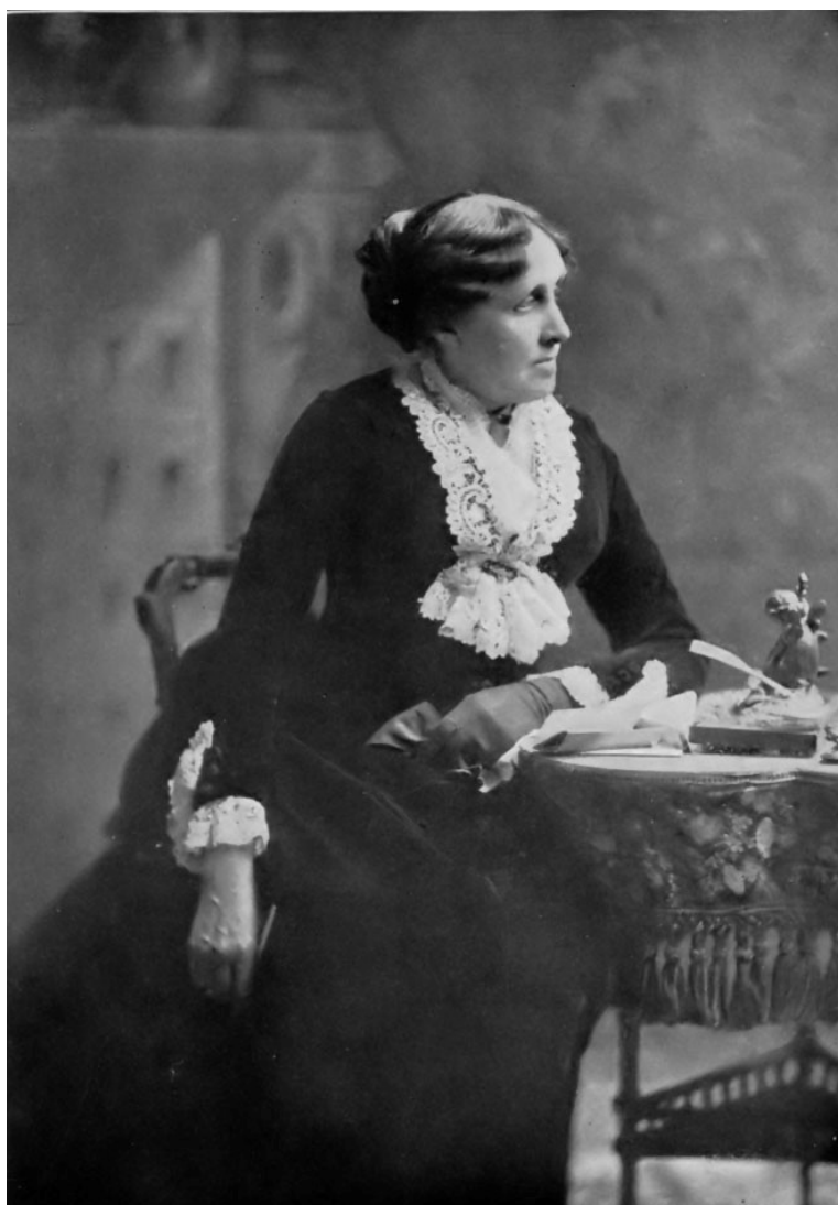
Obr. č. 3: Portrét Louisy May Alcottové (Louisa May Alcott Is My Passion – Controversy wrapped in sentiment: Louisa May Alcott's genius, 2011)