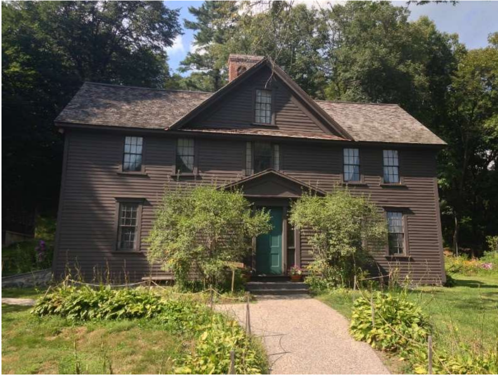
Obr. č. 4: Rodný dům Alcottové, dnes sloužící jako muzeum