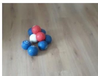
Obr 10. Trénink navalování