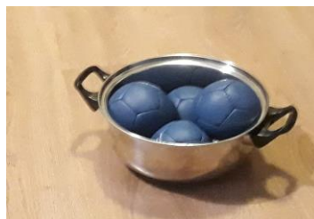
Obr. 11. Trénink hodu obloukem