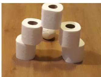
Obr 9. Trénink přesnosti Autor Horáček Petr

Mezi ty náročnější tréninkové postupy můžeme zařadit prohazování míče úzkým koridorem (tento úkon získal v době karantény zcela novou podobu, jelikož hráči nemohli trénovat v tělocvičnách a využívat k tréninku určené načiní, upravili si podobu této tréninkové situace pro domácí prostředí viz. fotografie 9). Další úkony, které již patří k těm složitějším je např. navalování míče na skupinu míčů blízko Jacka, anebo hody obloukem - přehazování nebo vyrážení vrchem (k tomuto cviku se ze začátku může užít např. gymnastická obruč, aby se hráč nebál malého cíle. Stále je ale nutné míče házet do obruče vzduchem a ne po zemi.