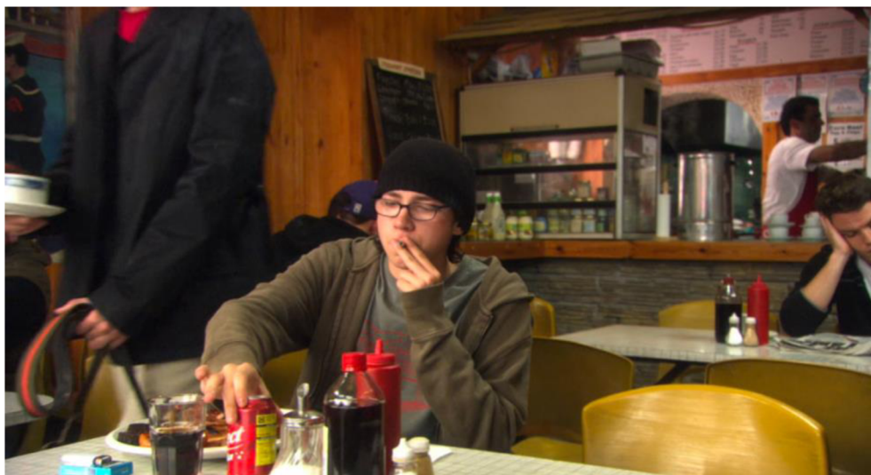
Obrázek č. 7: Typický britský podnik

Z využitých prostorů lze také pozorovat zasazení příběhu do doby, kdy se seriál natáčel, konkrétně roku 2007. V níže přiložené fotografii je zobrazení jednoho z podniků, kde postavy společně tráví čas, můžeme pozorovat stereotypy typické pro uvedenou dobu. Například fakt, že Sid kouří cigaretu uvnitř podniku, je příznačný a logický vzhledem k tomu, že zákaz kouření ve vnitřních prostorách vzešel v platnost až v červenci roku 2007, takže těsně po dokončení natáčení.