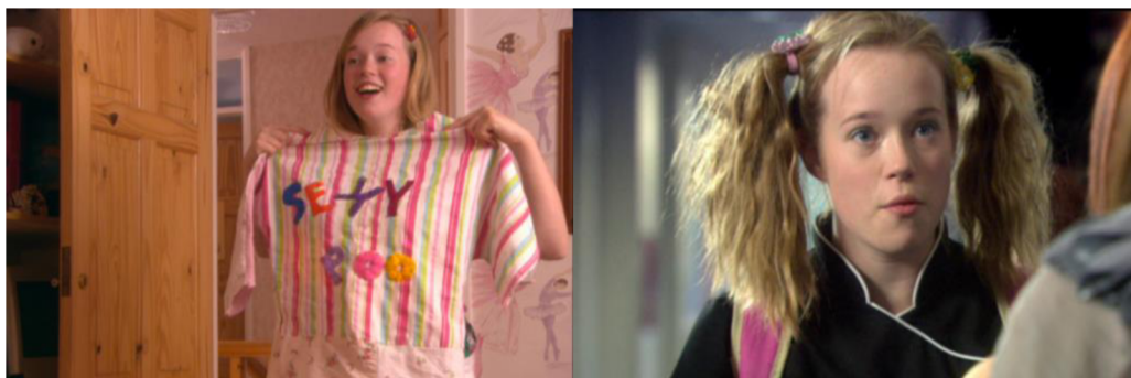
Obrázek č. 22 a č. 23: Pandořin styl oblékání a líčení

chování v očích ostatních působí trapně. Značí to i její nevinnost v oblasti mezilidských vztahů a schopnosti nevěnovat pozornost tomu, co si o ní kdo myslí.