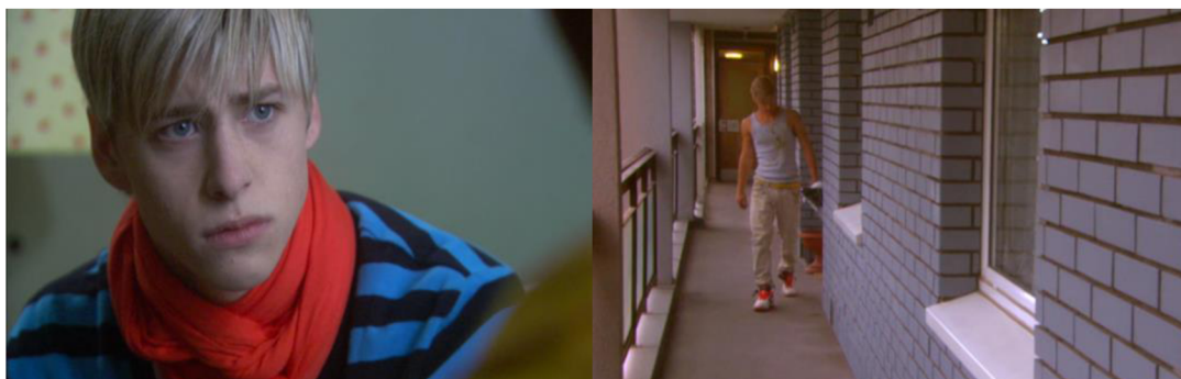
Obrázek č. 18 a č. 19: Maxxieho vzhled a styl

Maxxie se v průběhu seriálu za svou sexualitu nestydí a dává ji otevřeně najevo, což se projevuje právě i na jeho stylu oblékání a na upraveném vzhledu. Většinou se obléká tak, aby vynikla jeho sportovní postava a své oděvy si doplňuje stylovými šátky nebo čepicemi. Jako jediný představitel mužského pohlaví z hlavní zkoumané skupiny se také stará o svůj účes a udržuje mu určitou stylizaci.