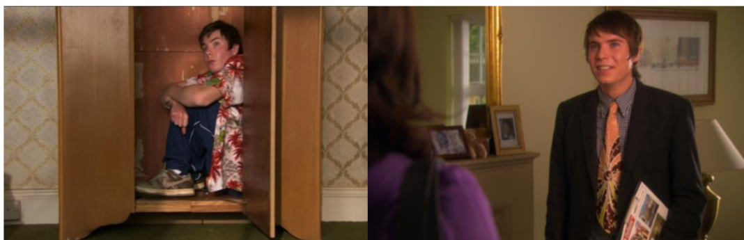
Obrázek č. 16 a č. 17: Proměna v Chrisově stylu oblékání

Chrisův styl oblékání je charakteristický pohodlností a ležérností, jako jeho flegmatický způsob chování. Pro Chrise je charakteristické extrovertní chování, přátelská a veselá povaha, a zásadně nepromešká žádnou příležitost se buď zasmát anebo rozesmát ostatní. Proto je často zobrazován v svršcích s barevnými nebo dětskými motivy. Změnu v oblékání je možné pozorovat v počátečních epizodách druhé série, kdy začne pracovat jako realitní makléř, a je nucen se oblékat více formálně. Jeho přístup se změní, a to se tedy skutečně projeví na jeho stylu oblékání, kdy najednou působí jako zodpovědný a cílevědomý jedinec. Příklad můžeme pozorovat v níže uvedených obrázcích.