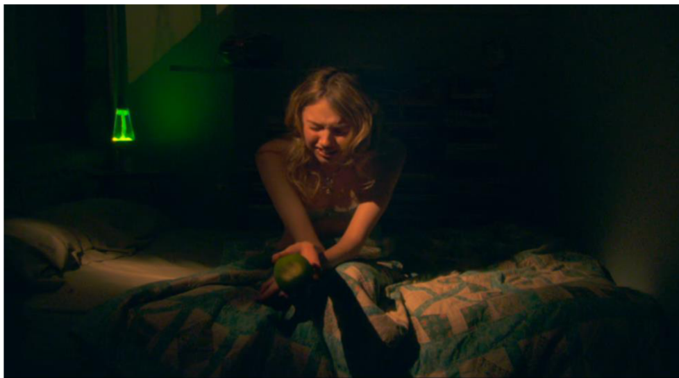
Obrázek č. 11: Využití světla a stínů