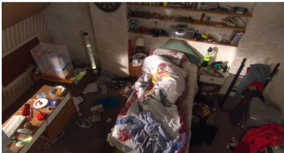
Obrázek č. 4: Sidův pokoj

Jak je zřejmé z níže přiložené fotografie, Sidův pokoj je neudržovaný a chaotický. Nepořádek může korespondovat i s jeho vzhledem, protože ve spoustě scénách můžeme pozorovat, že na upravenost svého vzhledu příliš nedbá. V této spojitosti Tony několikrát zmiňuje, že Sid dostatečně nedodrží osobní hygienu.