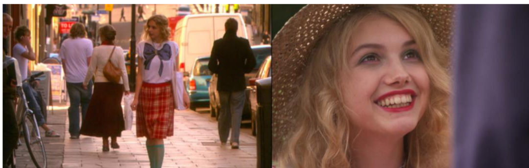
Obrázek č. 12 a č. 13: Styl a líčení Cassie