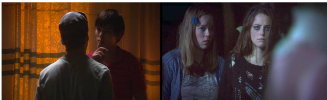
Obrázek č. 8 a č. 9: Záběry v umělém osvětlení

Scény odehrávající se v noci či v umělém světle nejsou většinou příliš tmavé. Je tomu tak, protože je umělé světlo využíváno způsobem, aby alespoň částečně osvětlovalo aktéry a scéna tak byla naprosto zřetelná. Tmavým dojmem tedy nepůsobí a neslouží k budování strachu či napětí v divákovi.