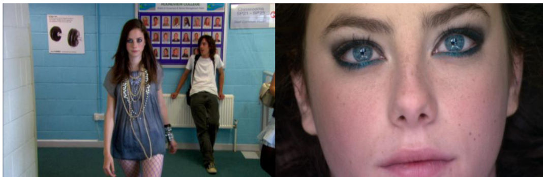
Obrázek č. 14 a č. 15: Styl a líčení Effy

V různých dílech můžeme pozorovat, že na svém vzhledu si dává záležet pouze v případech, kdy je jisté, že bude na veřejnosti tzn. škola, klub nebo jiný druh společenské akce. V běžných situacích je prezentována normálně bez jakéhokoliv či mírného nalíčení a obléká se do pohodlnějšího oblečení (tílko, džíny a tenisky)