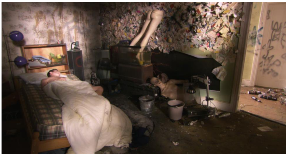
Obrázek č. 6: Chrisův pokoj

Z využitých prostorů lze také pozorovat zasazení příběhu do doby, kdy se seriál natáčel, konkrétně roku 2007. V níže přiložené fotografii je zobrazení jednoho z podniků, kde postavy společně tráví čas, můžeme pozorovat stereotypy typické pro uvedenou dobu. Například fakt, že Sid kouří cigaretu uvnitř podniku, je příznačný a logický vzhledem k tomu, že zákaz kouření ve vnitřních prostorách vzešel v platnost až v červenci roku 2007, takže těsně po dokončení natáčení.