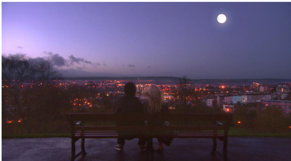
Obrázek č. 10: Tmavý snímek

V kontrastu jsou jiné scény zobrazovány ve velmi pestrých barvách, a to především z večírků, kterých se postavy zúčastňují. Mnohdy jsou divákům rovněž představeny detailní záběry na barevná světla, například při scénách v klubu. Tento prvek může divákům poskytnout hlubší zážitek ze scény, což jim umožňuje se do děje přenést alespoň virtuálně.