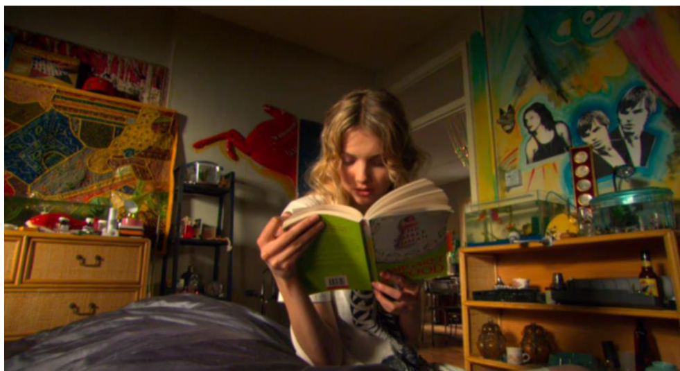
Obrázek č. 5: Pokoj Cassie

všimnou z přiloženého obrázku ze společného bydlení Cassie a Chrise, se nachází na pravé části. Na stěně je totiž zpodobnění Tonyho a Michelle. Tony je zde zobrazen dvojitě, o čemž je možné spekulovat z jakého důvodu. Jedním z možných řešení je reprezentace následků Tonyho nehody, kdy následně svádí vnitřní boj mezi svými osobnostmi. Konkrétně mezi částí, kterou býval a tím, kým se stal po nehodě.