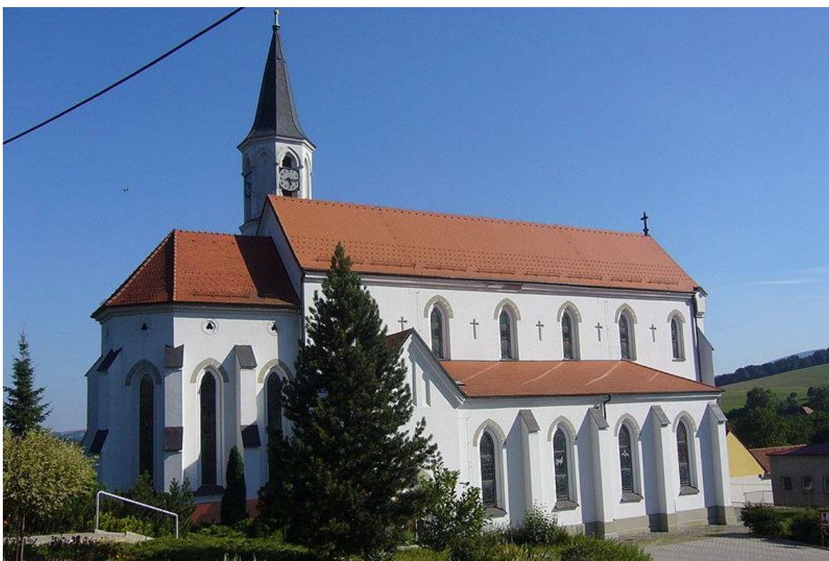
Obr. 14 Kostel sv. Cyrila a Metoděje v Březové