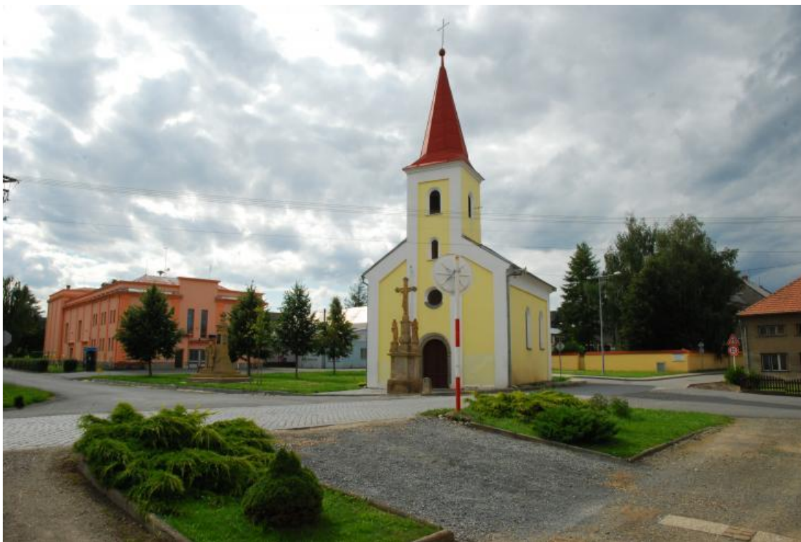
Obr. 13 Kaple sv. Cyrila a Metoděje v Haňovicích