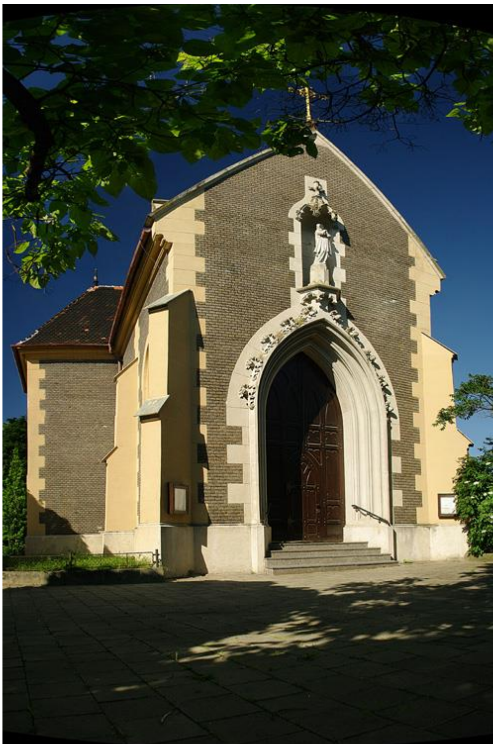
Obr. 15 Kaple sv. Cyrila a Metoděje v Břeclavi