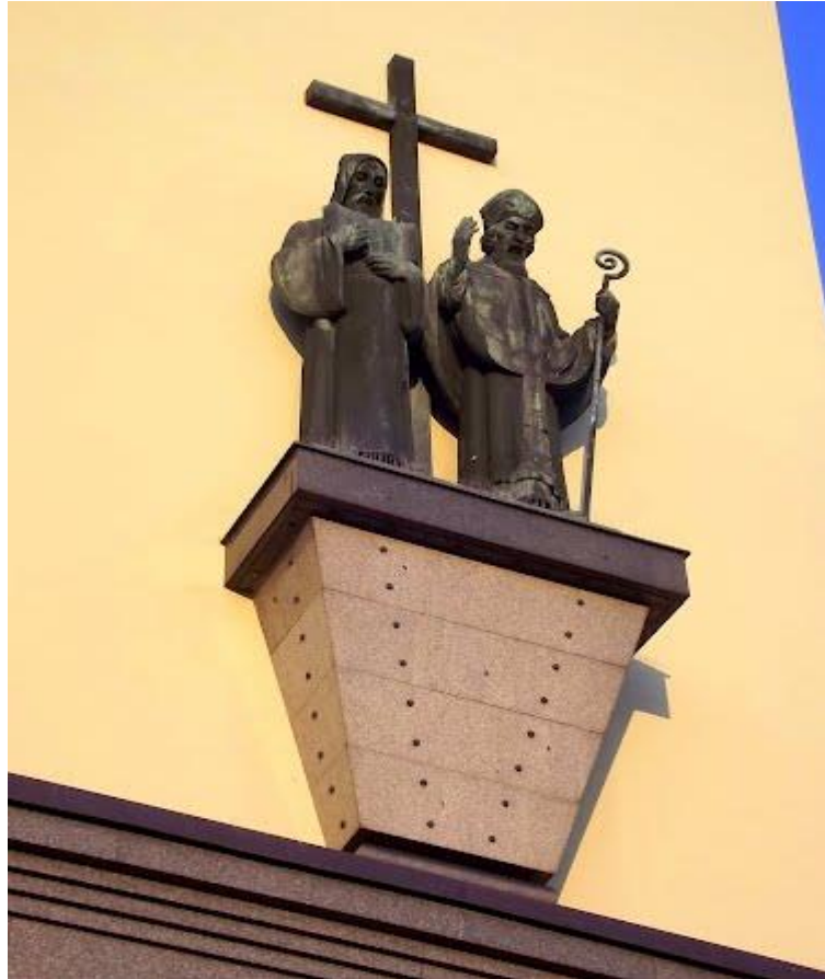
Obr. 7 Reliéf sv. Cyrila a Metoděje na průčelí kostela v Olomouci - Hejčín