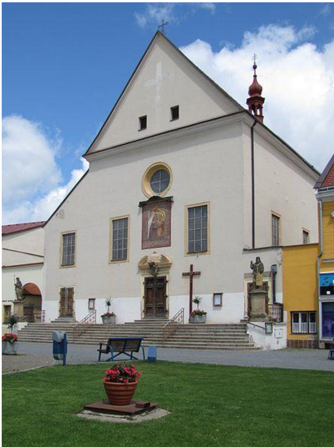
Obr. 16 Kostel sv. Cyrila a Metoděje v Kyjově