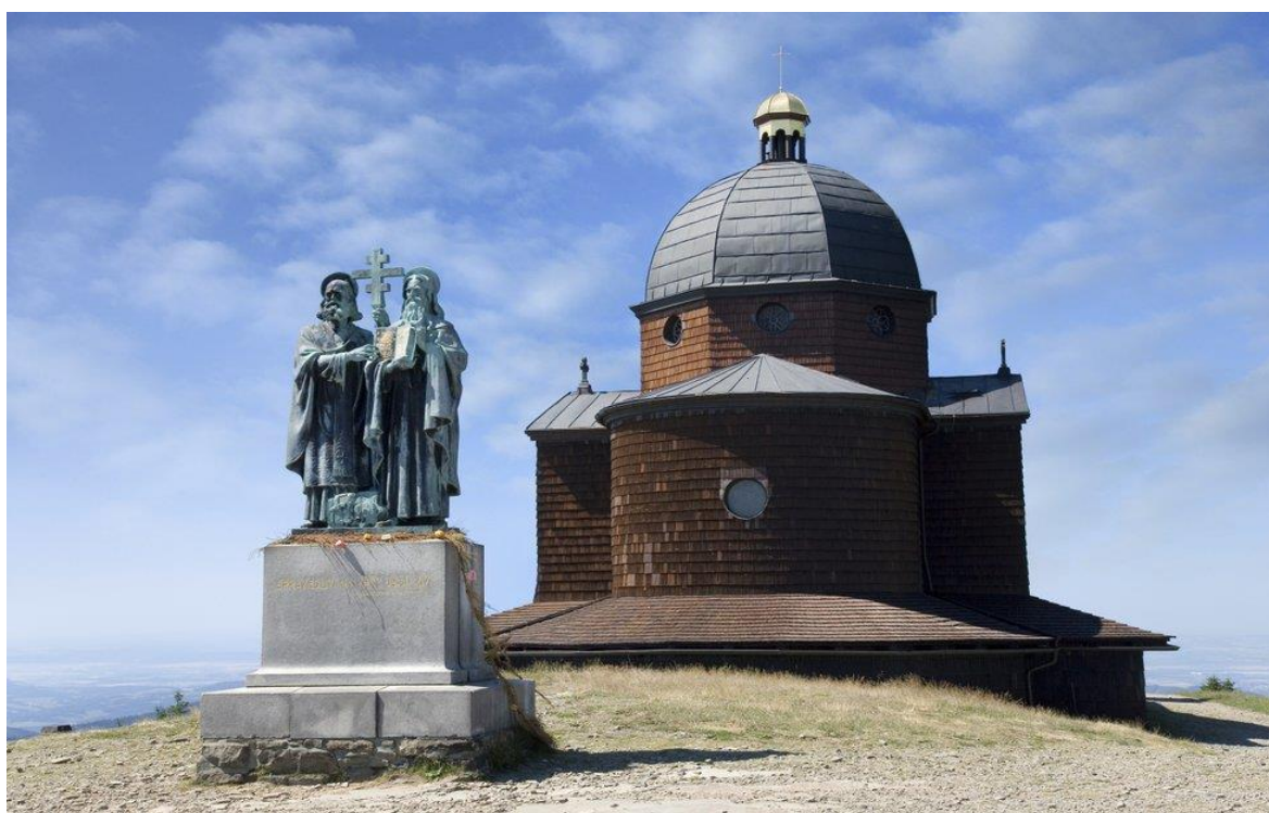
Obr. 10 Kaple sv. Cyrila a Metoděje na hoře Radhošť