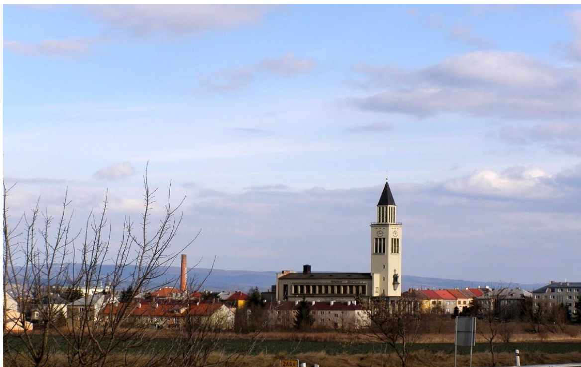
Obr. 5 Kostel sv. Cyrila a Metoděje v Olomouci - Hejčín