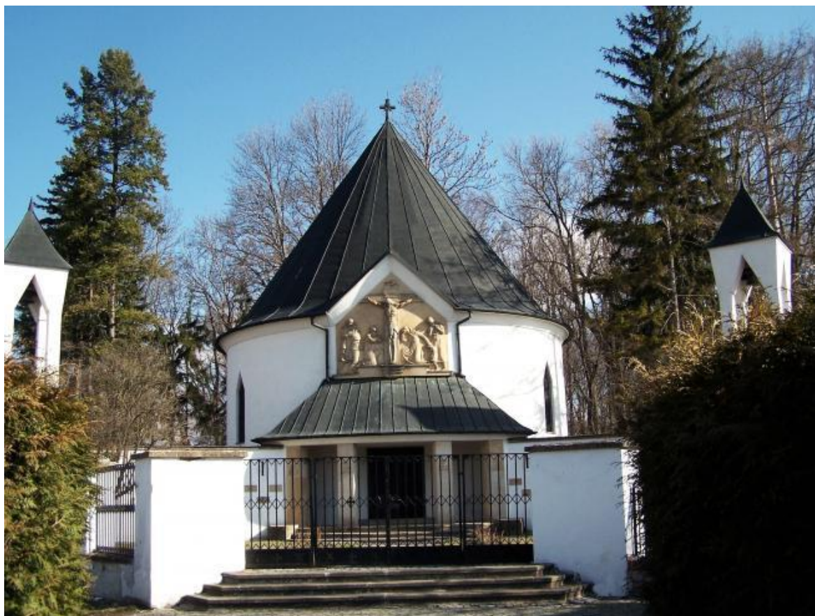
Obr. 9 Kaple sv. Cyrila a Metoděje v obci Příkazy