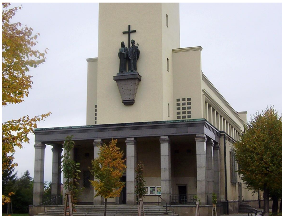
Obr. 6 Průčelí kostela sv. Cyrila a Metoděje v Olomouci - Hejčín