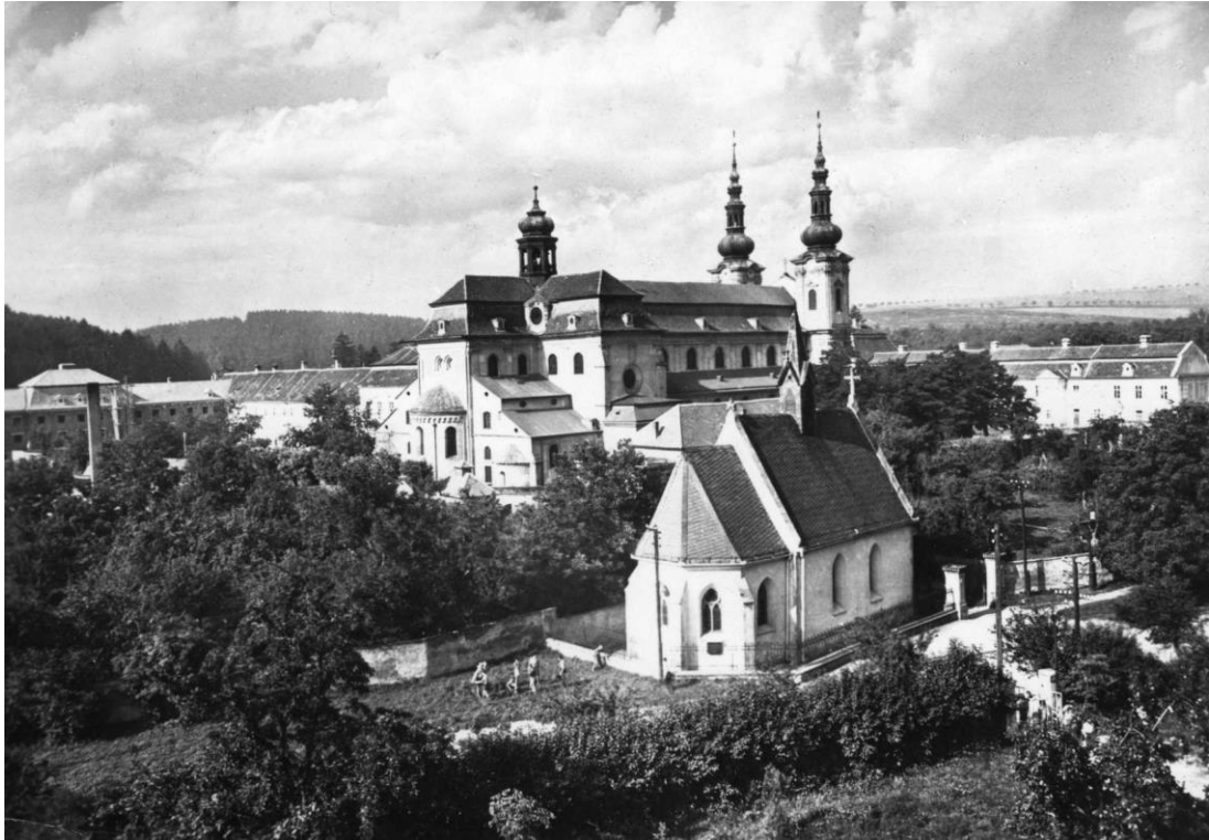
Obr. 3 Kaple Cyrilka na Velehradě s velehradskou bazilikou v pozadí