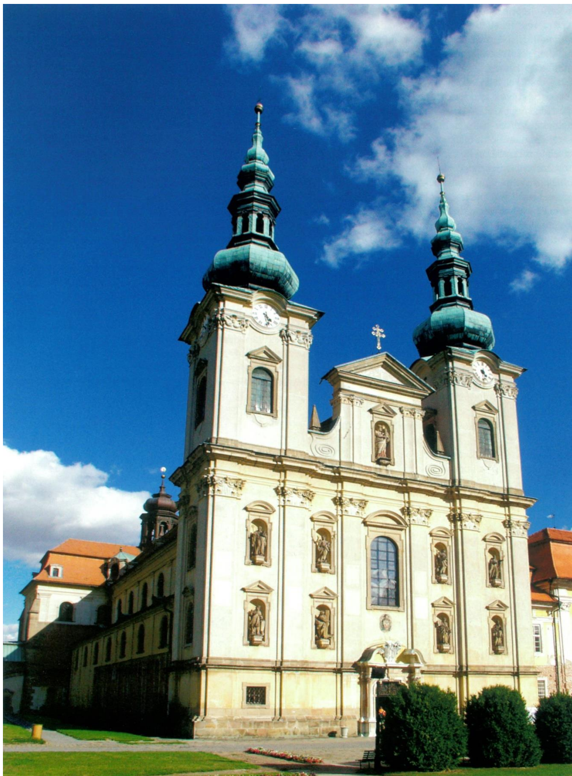
Obr. 2 Bazilika Nanebevzetí Panny Marie a sv. Cyrila a Metoděje na Velehradě