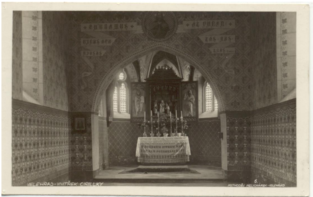
Obr. 4 Interiér kaple zvané Cyrilka