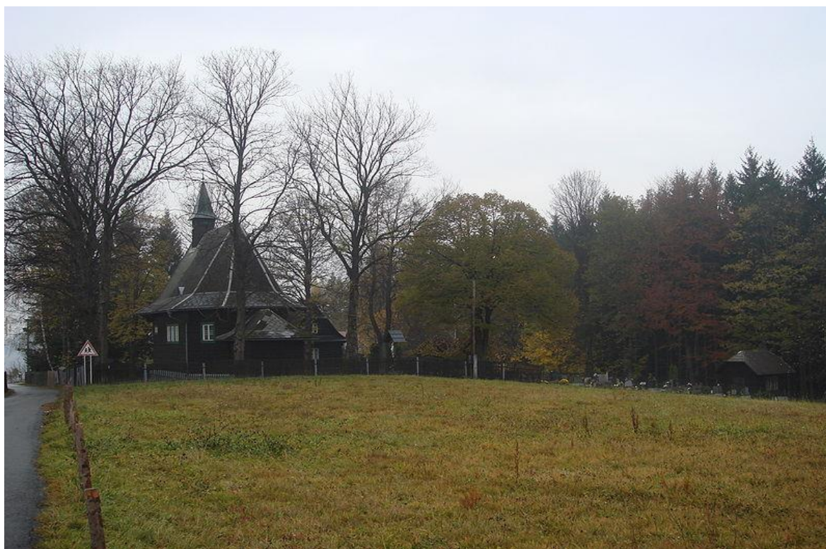
Obr. 19 Kaple sv. Cyrila a Metoděje v obci Hřčava