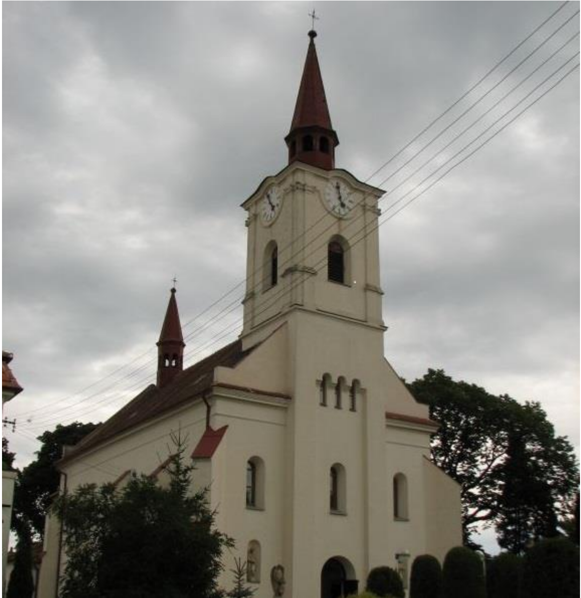
Obr. 17 Kostel sv. Cyrila a Metoděje ve Věteřově