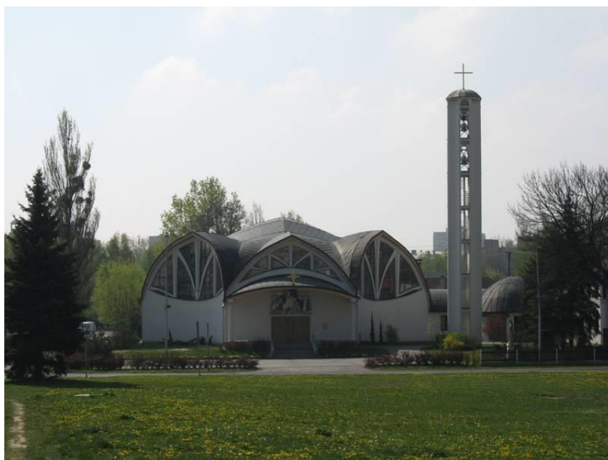
Obr. 20 Kostel sv. Cyrila a Metoděje v Ostravě - Pustkovec