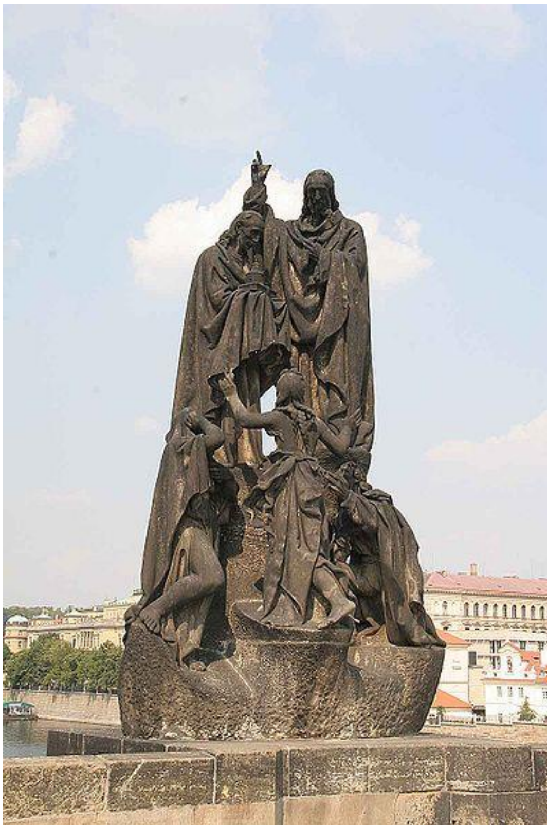
Obr. 1 Sousoší sv. Cyrila a Metoděje na Karlově mostě v Praze