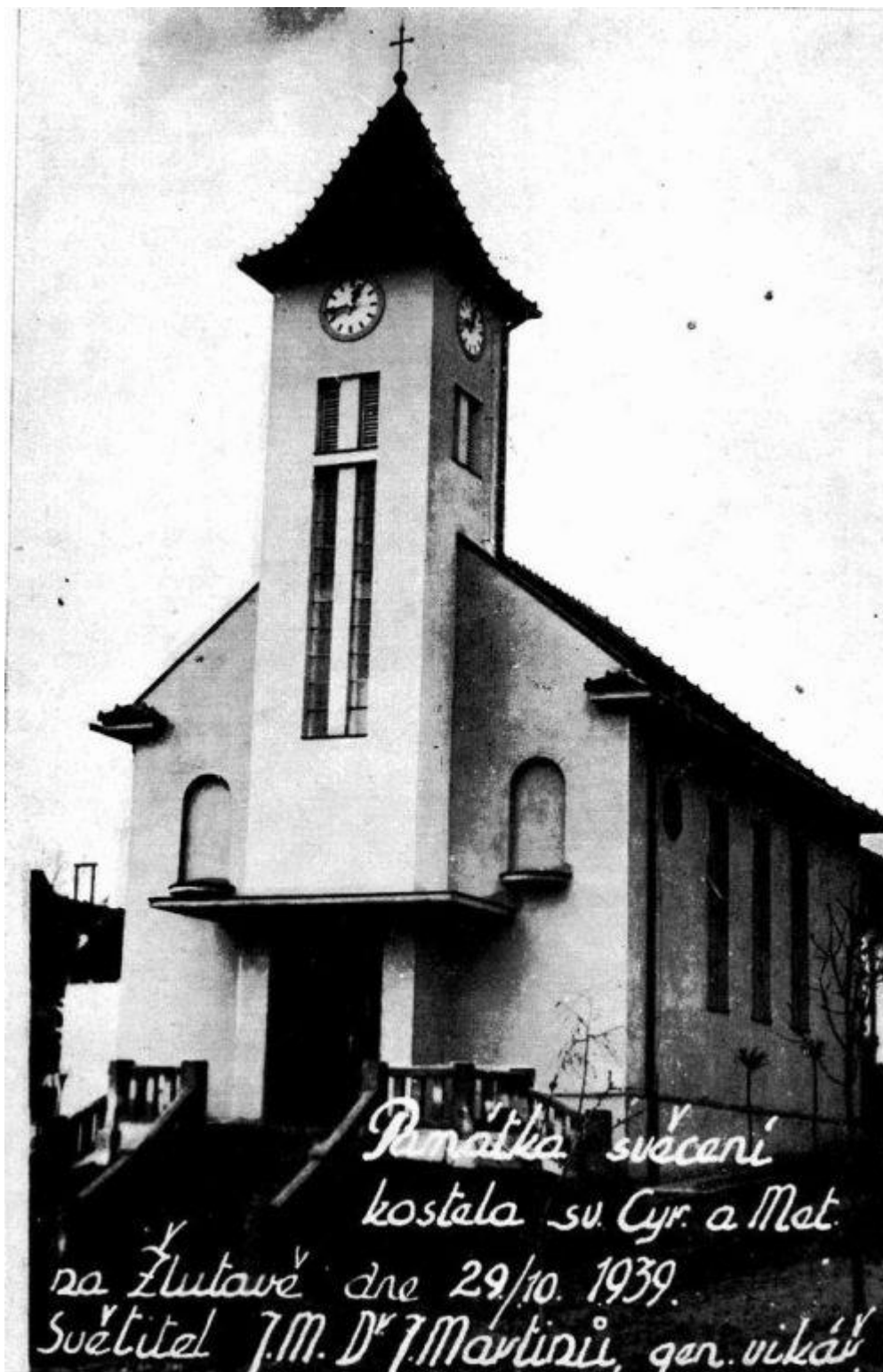
Obr. 11 Kostel sv. Cyrila a Metoděje v obci Žlutava