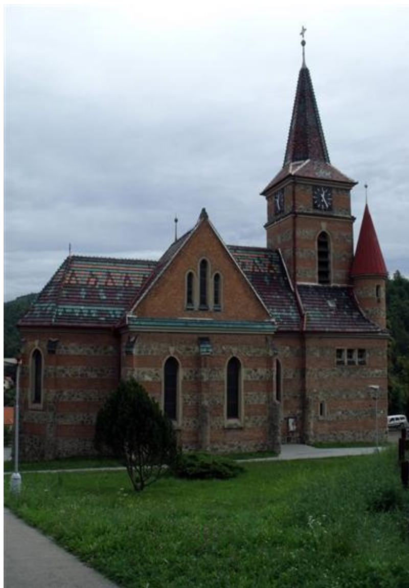
Obr. 12 Kostel sv. Cyrila a Metoděje v Bílovicích nad Svitavou