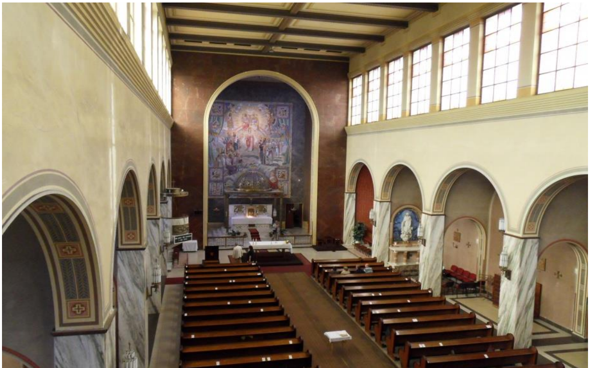
Obr. 8 Interiér kostela sv. Cyrila a Metoděje v Olomouci - Hejčín