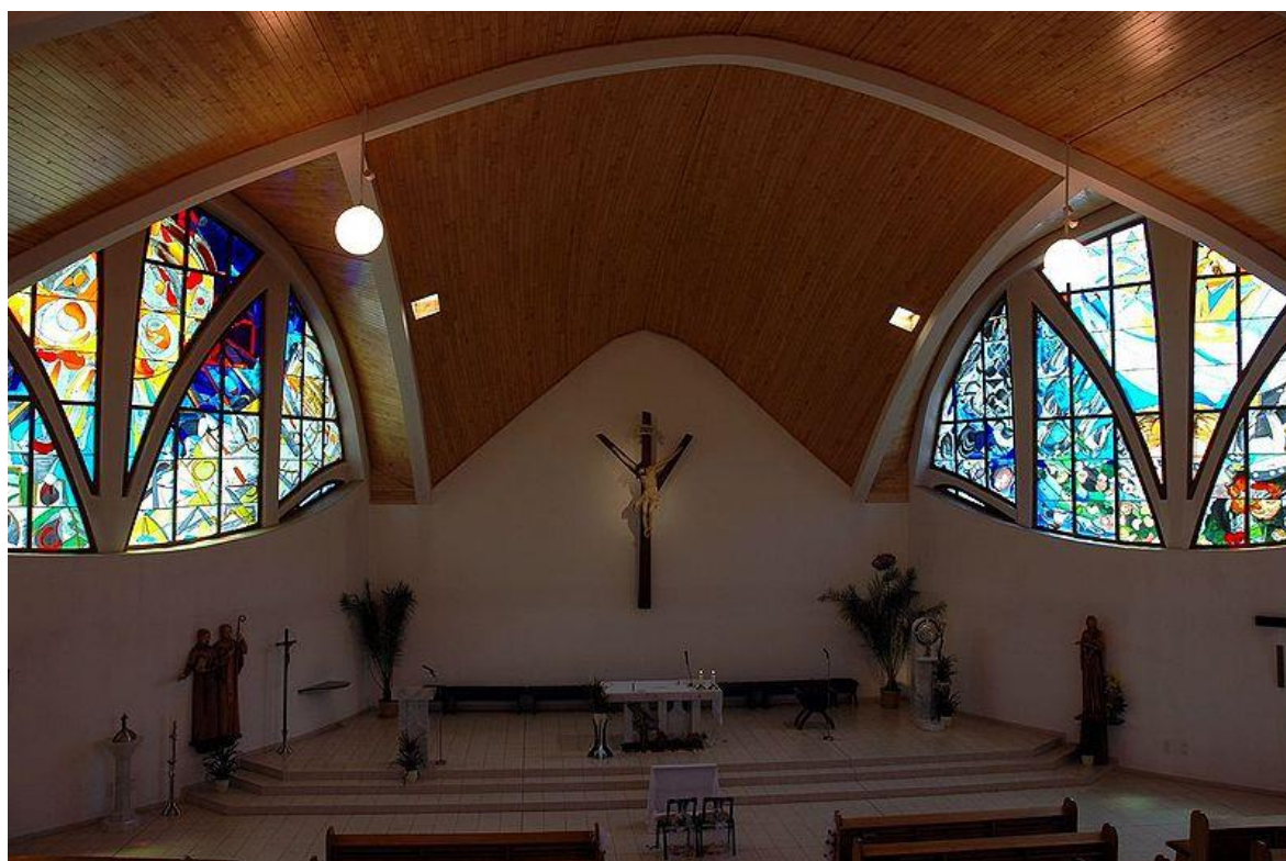
Obr. 21 Interiér kostela sv. Cyrila a Metoděje v Ostravě - Pustkovec