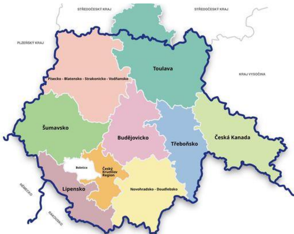
Obrázek 1 Mapa destinací Jihočeského kraje(jccr.cz, 2016)

dne 9. září 2021 a se kterou přišla Jihočeská centrála cestovního ruchu. V Jihočeském kraji existuje celkem devět turistických oblastí, které pokrývají celou plochu tohoto kraje. Nejnovější oblastí, která byla certifikována, je region Český Krumlov a to v roce 2020. Jak můžeme vidět na obrázku, oblast Toulava nám zasahuje i mimo Jihočeský kraj (jccr.cz, 2021).