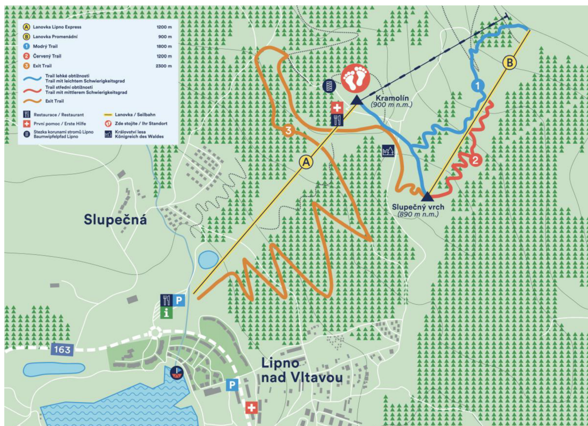
Obrázek 4 Mapa bikeparku v Lipně nad Vltavou(lipno.info, 2024)