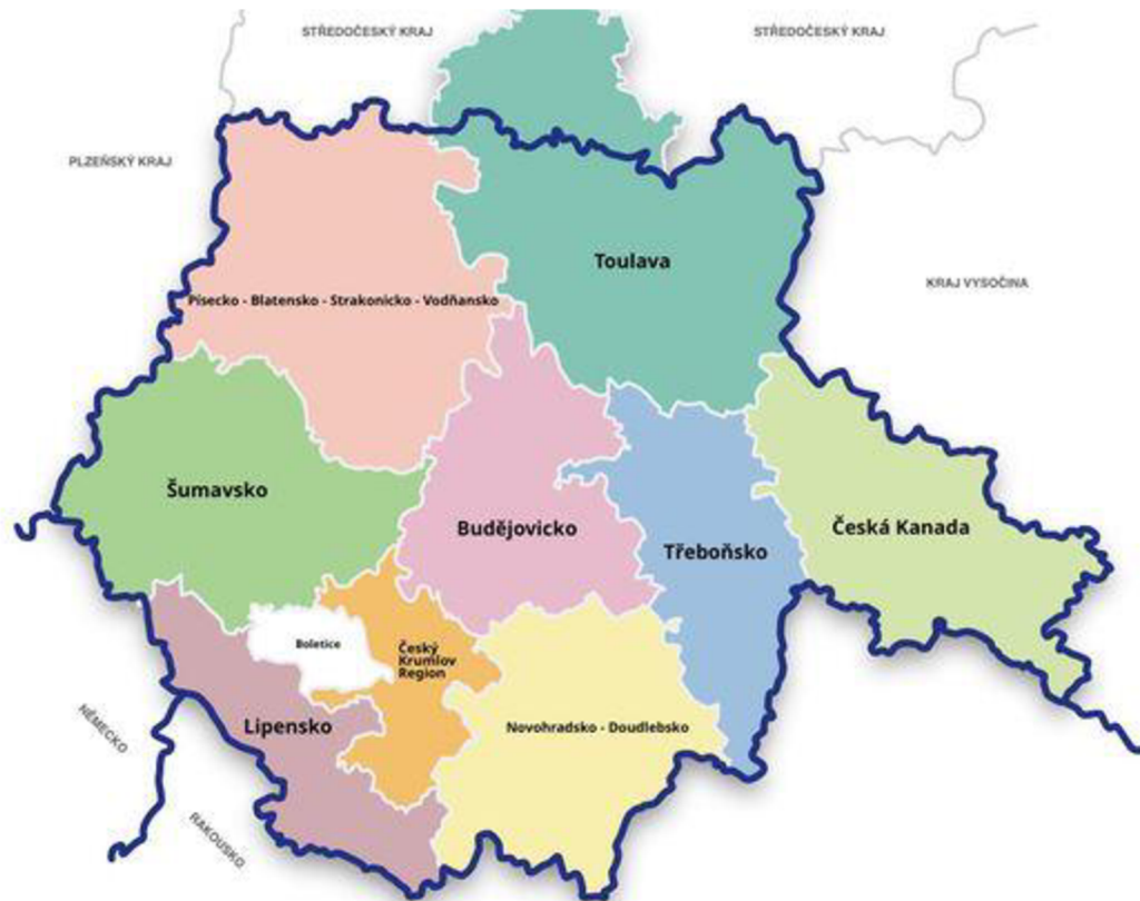
Obrázek 1 Mapa destinací Jihočeského kraje(jccr.cz, 2016)

dne 9. září 2021 a se kterou přišla Jihočeská centrála cestovního ruchu. V Jihočeském kraji existuje celkem devět turistických oblastí, které pokrývají celou plochu tohoto kraje. Nejnovější oblastí, která byla certifikována, je region Český Krumlov a to v roce 2020. Jak můžeme vidět na obrázku, oblast Toulava nám zasahuje i mimo Jihočeský kraj (jccr.cz, 2021).