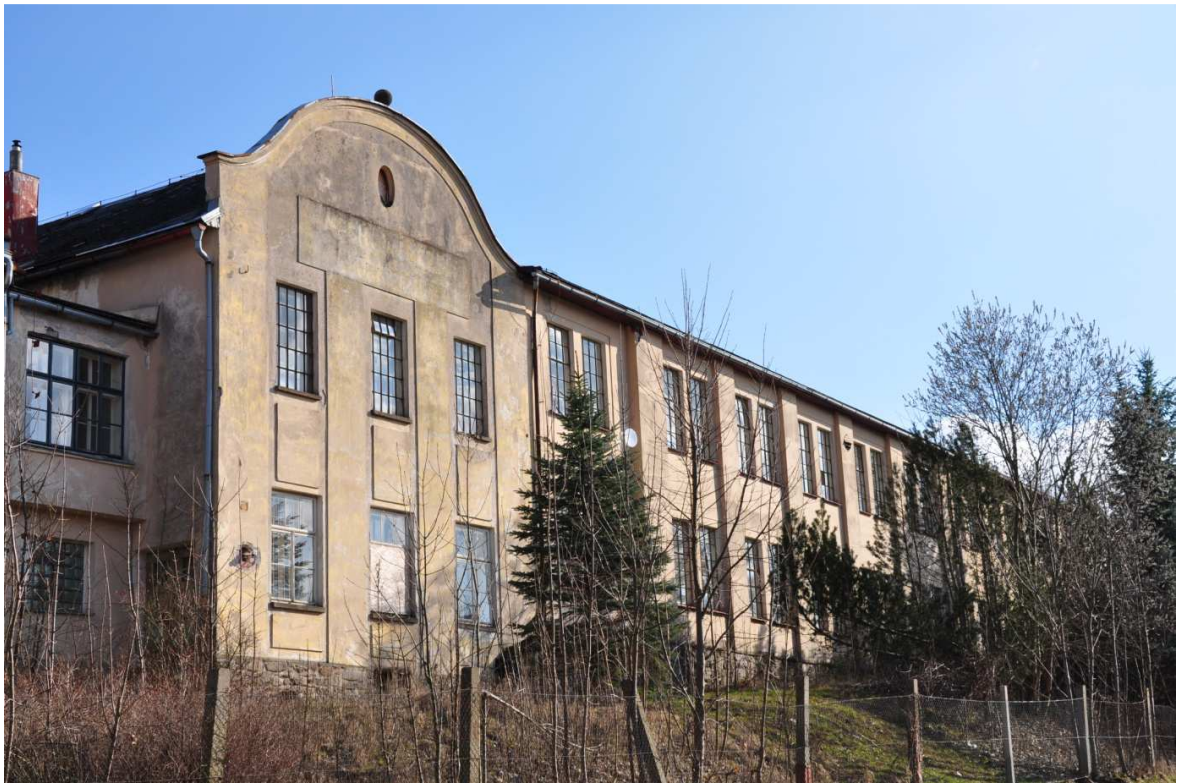
Foto č. 3: Budova č. p. 1338 na tzv. Liščím kopci, bývalá mechanická tkalcovna A. Pilze.