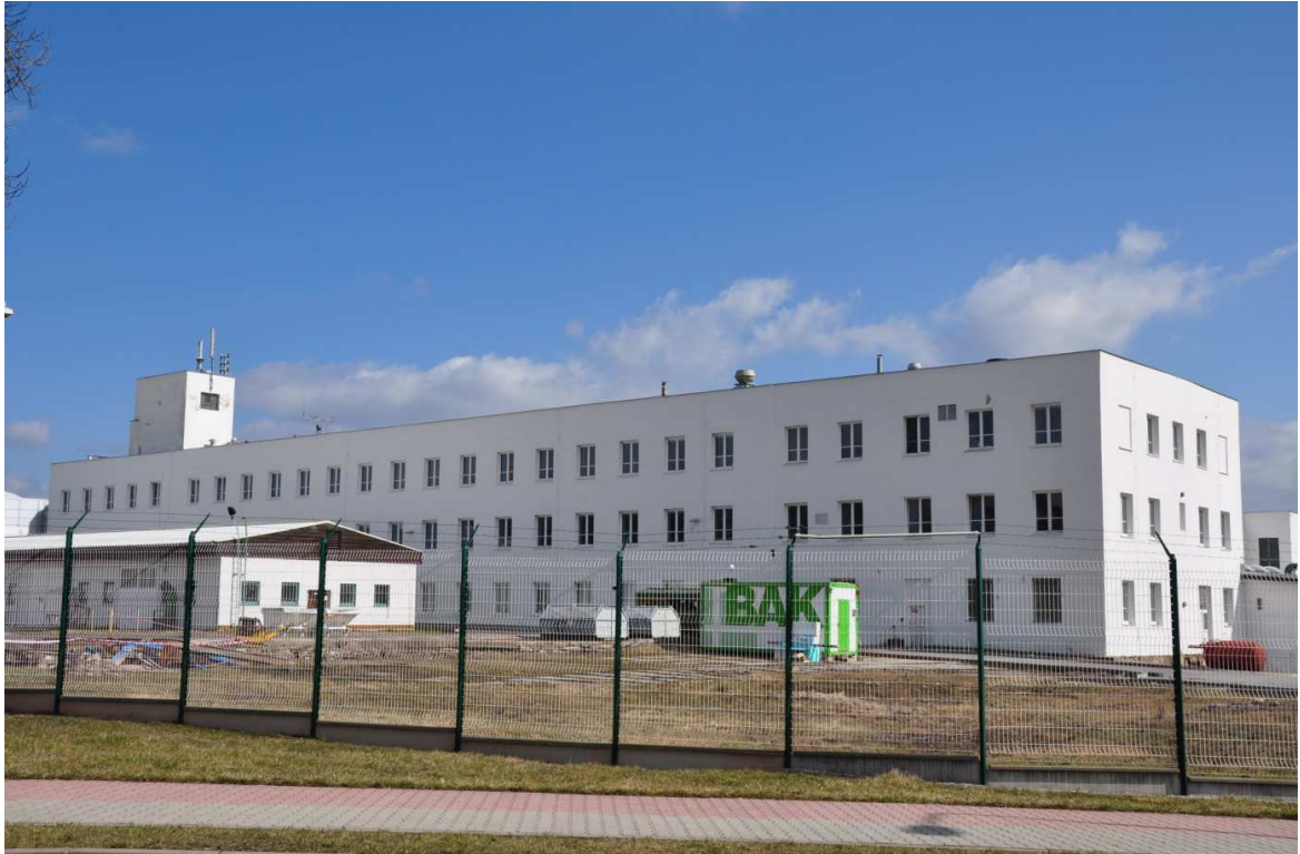
Foto č. 7: Budova č. p. 529 ve Vrchlabí, bývalá Menčíkova přádelna, za války pronajata firmě Stolzenberg, dnes součást areálu Škoda Auto.