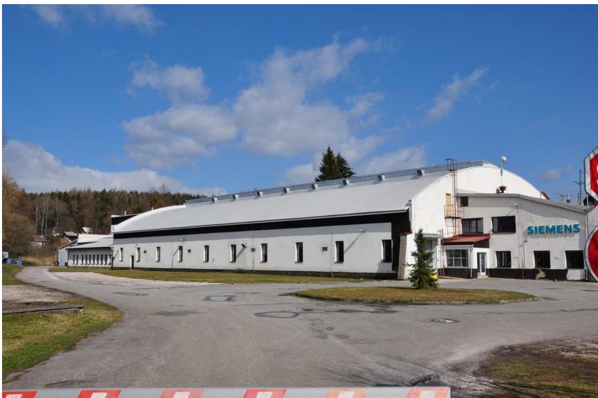
Foto č. 5: Budova č. p. 67 v Podhůří (Hartě), bývalá mechanická tkalcovna Stella, dnes firma Siemens.