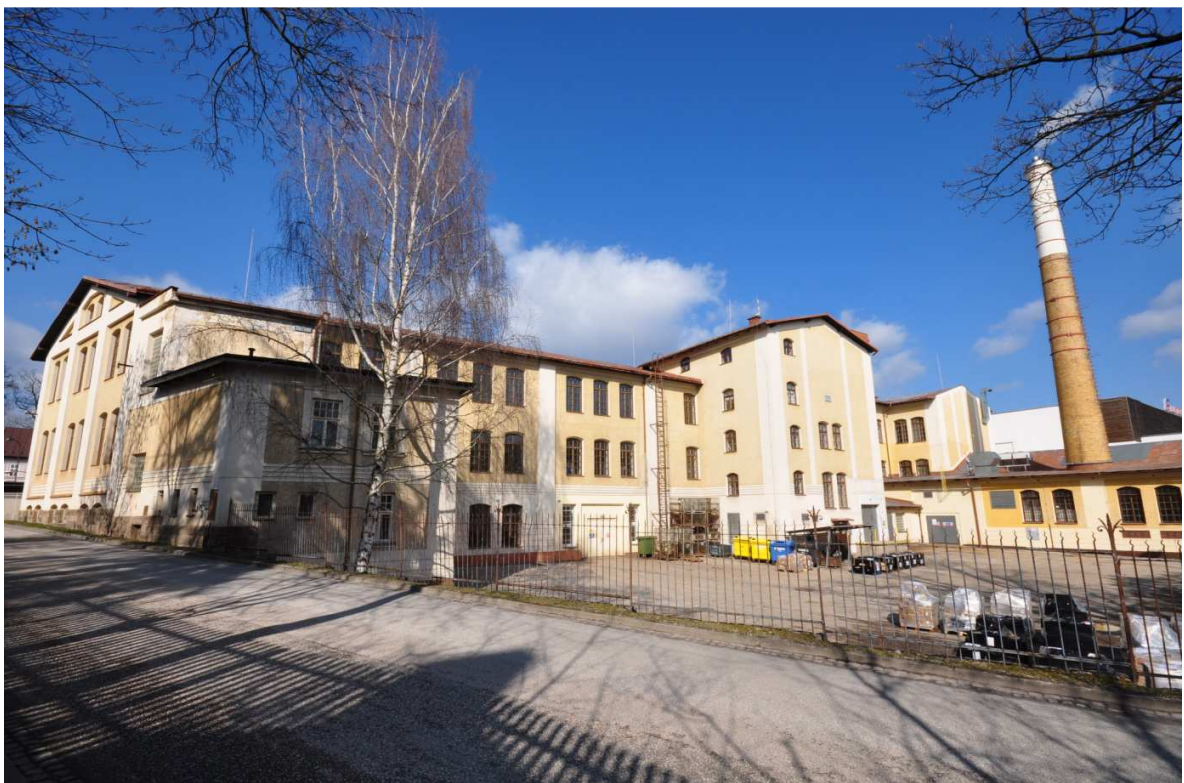
Foto č. 14: Budova č. p. 572 ve Vrchlábí, jedna z bývalých provozoven firmy Petera a synové.