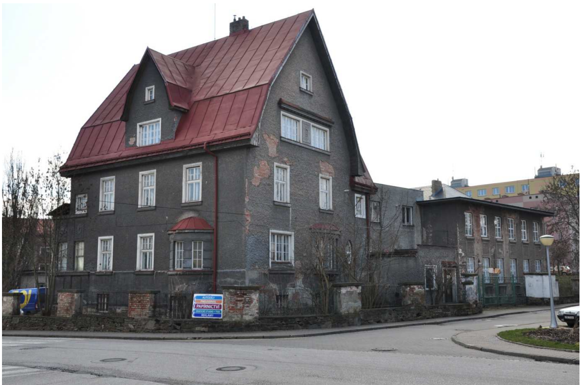
Foto č. 8: Budova č. p. 606 ve Vrchlabí, bývalá centrála družstva krkonošských tkalců Krakonoš.