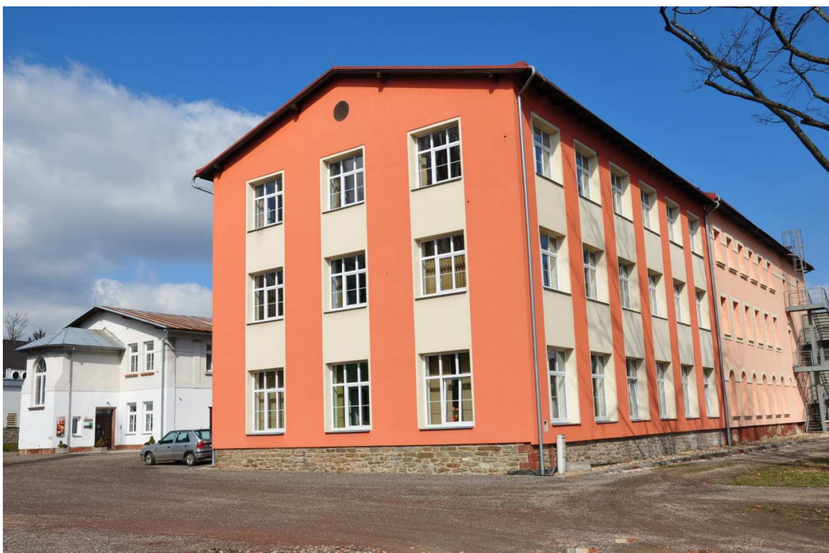
Foto č. 6: Budova č. p. 496 ve Vrchlabí, dříve objekt firmy Kleining a spol., dnes ubytování RICO.