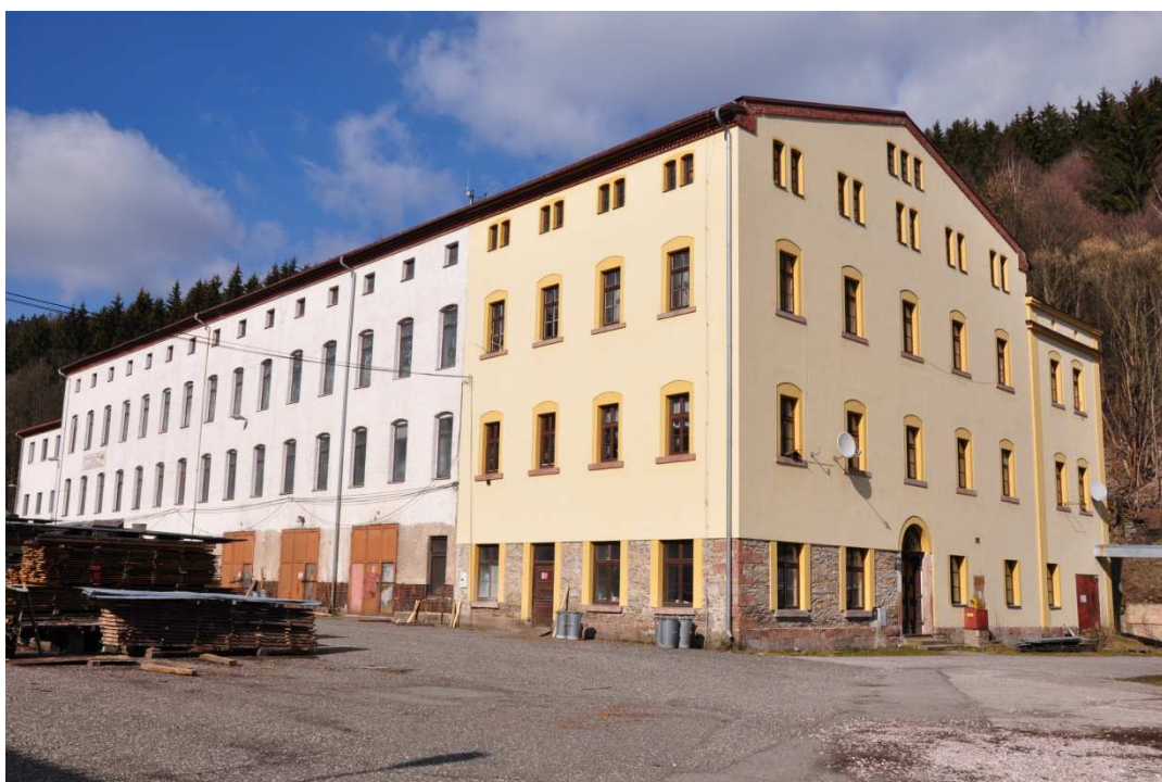
Foto č. 2: Budova č. p. 190 v Hořejším Vrchlabí, bývalá přádelna patřící původně F. A. Rotterovi, později E. Schreiberovi, za války pronajata firmě C. Lorenz (pod ní jako závod II).