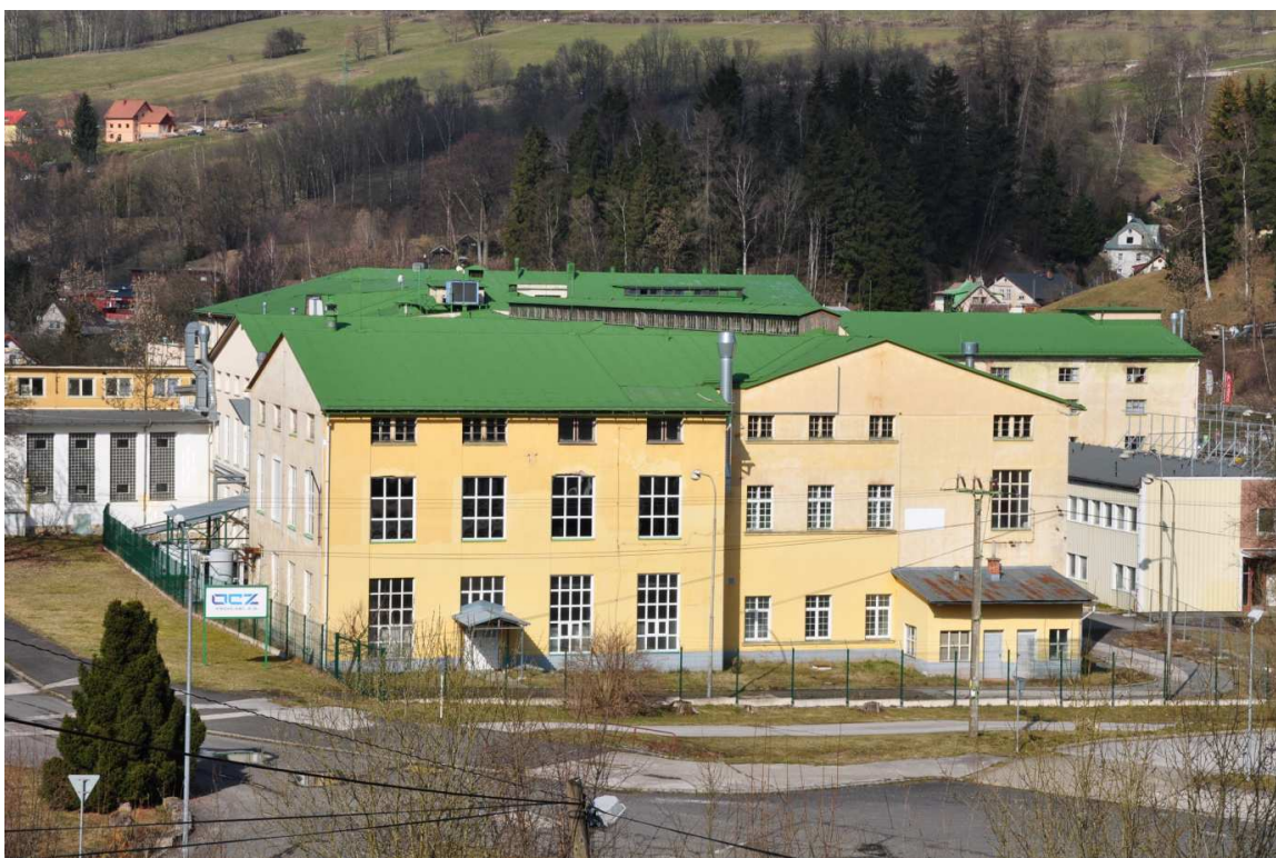
Foto č. 10: Budova č. p. 194 v Hořejším Vrchlabí, původně textilka F. A. Rottera, za války pronajata firmě C. Lorenz (závod I).