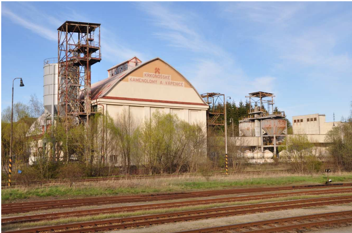
Foto č. 15: Budova č. p. 702 ve Vrchlabí, mlýn na nerosty patřící dříve firmě J. Kratzer.