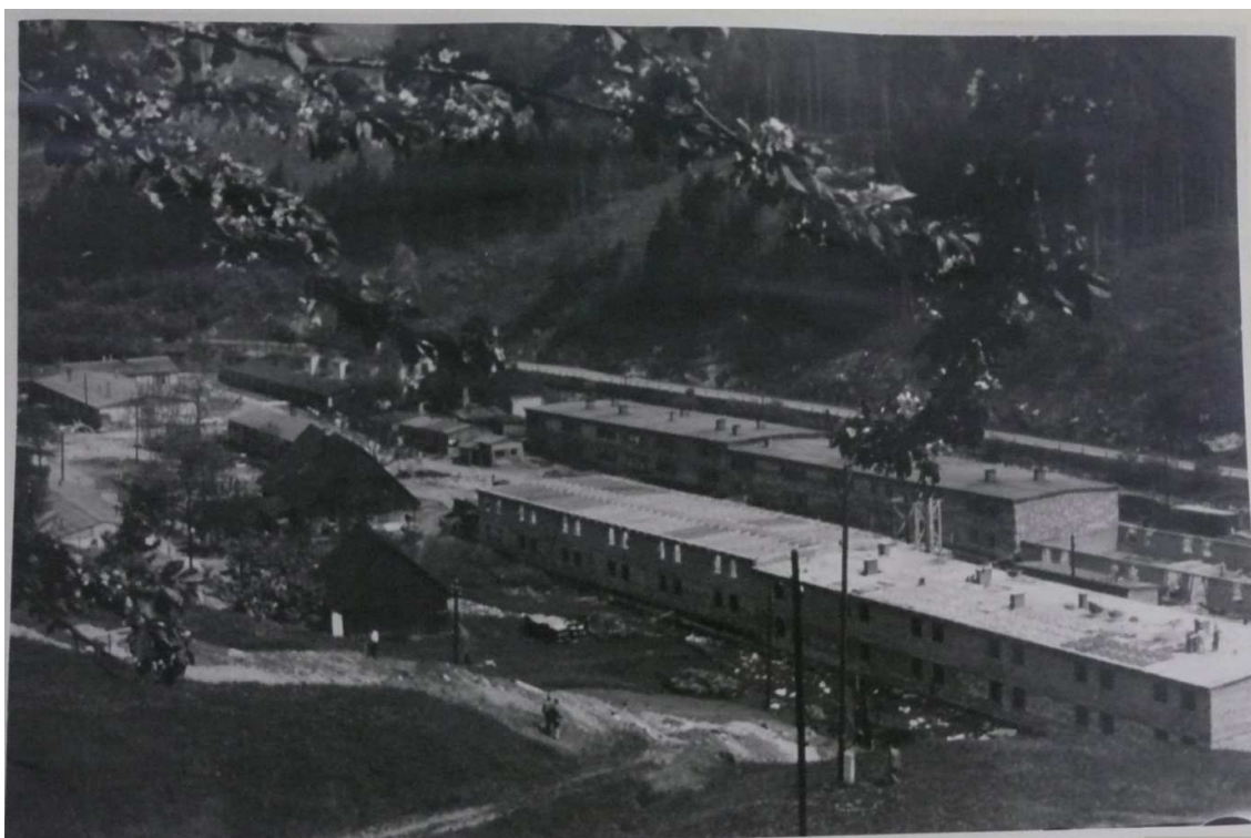
Foto č. 11: Herlíkovice, dobový pohled na pracovní tábor firmy C. Lorenz. SOA v Zámrsku, fond C. Lorenz, a. s., Vrchlabí (1940–1946-1952), fsn. 957–974, inv. č. 82, Fotografie pracovního tábora firmy v Herlíkovicích.