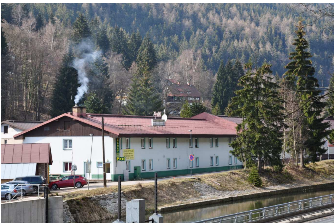
Foto č. 12: Herlíkovice, současný pohled na bývalý pracovní tábor firmy C. Lorenz, v současnosti ubytovací areál Eden.