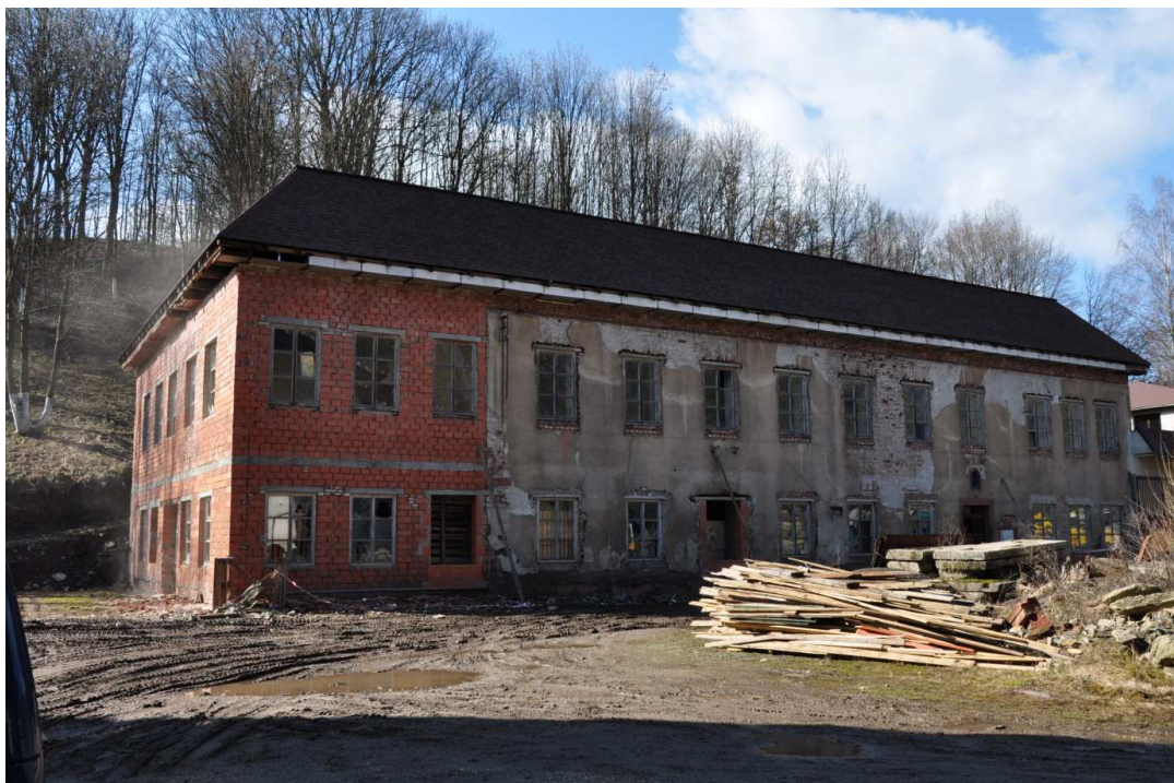
Foto č. 1: Budova č. p. 53 v Hořejším Vrchlabí, jedna z bývalých provozoven firmy Eduard Schreiber.