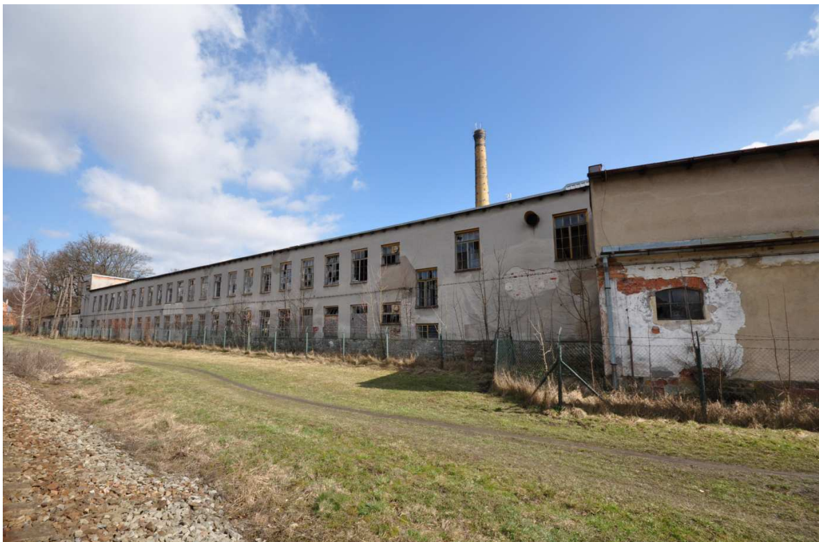
Foto č. 4: Budova č. p. 18 v Podhůří (Hartě), bývalá textilní továrna ROHA.