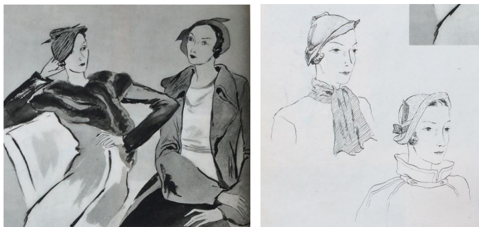
Obr. č. 19: jarní klobouky ( Eva: časopis moderní ženy, VI., č. 7, 1934. )