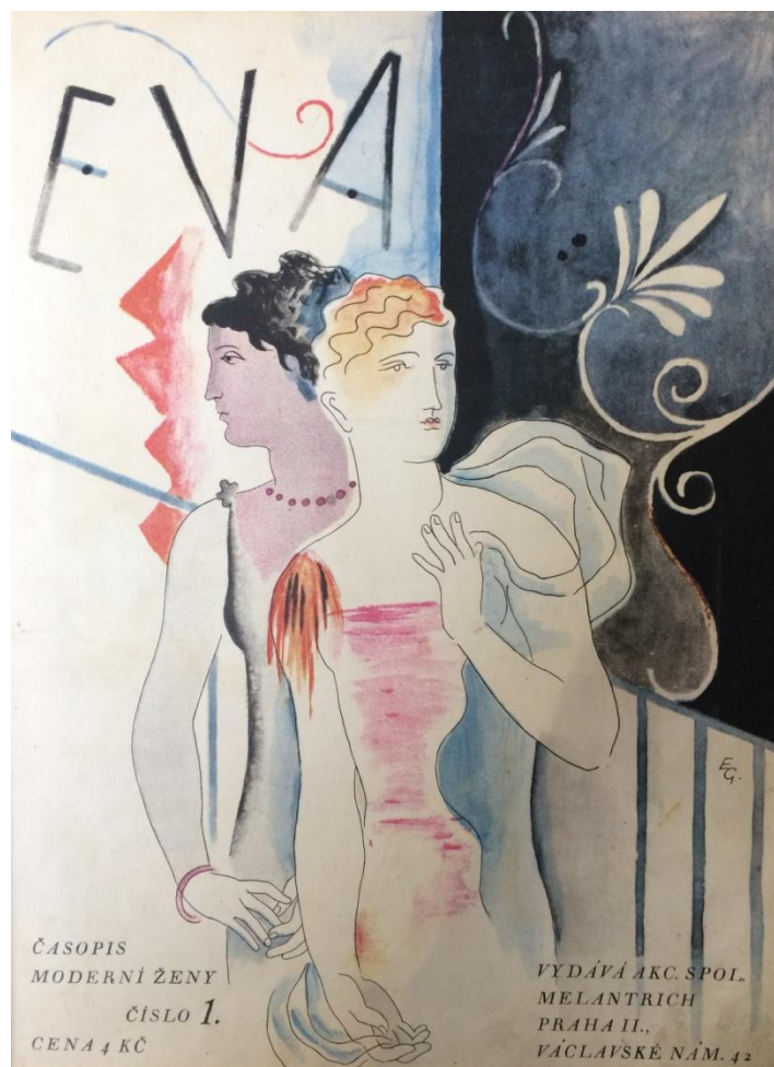
Obr. č. 9: Úvodní strana periodika Eva ( Eva: časopis moderní ženy , I., č. 1, 1928.)