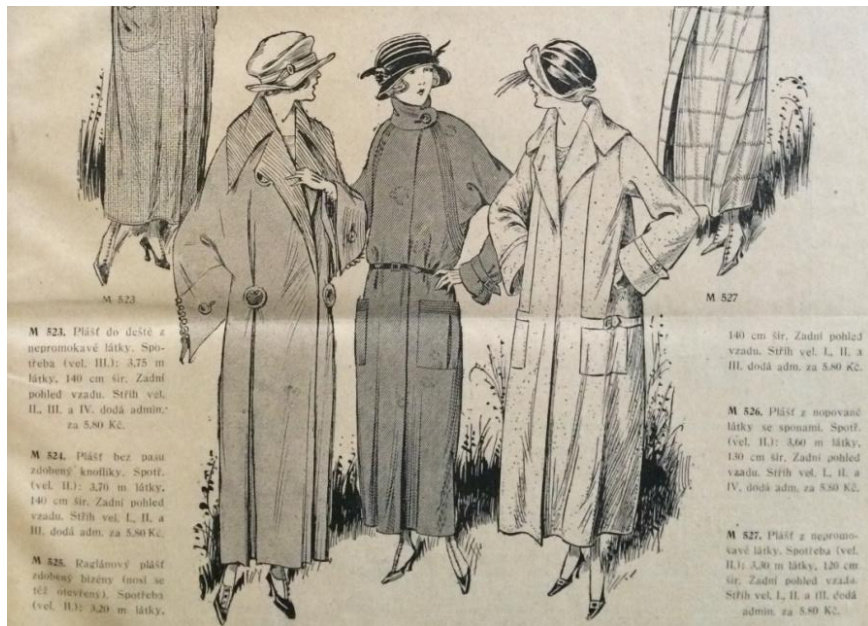
Obr. 7:Pláště (Modní svět, roč. XLV., č. 3, 1923.)