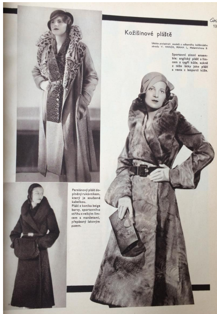
Obr. č. 18: Kožešinové pláště ( Eva: časopis moderní ženy, IV., č. 3, 1931. )