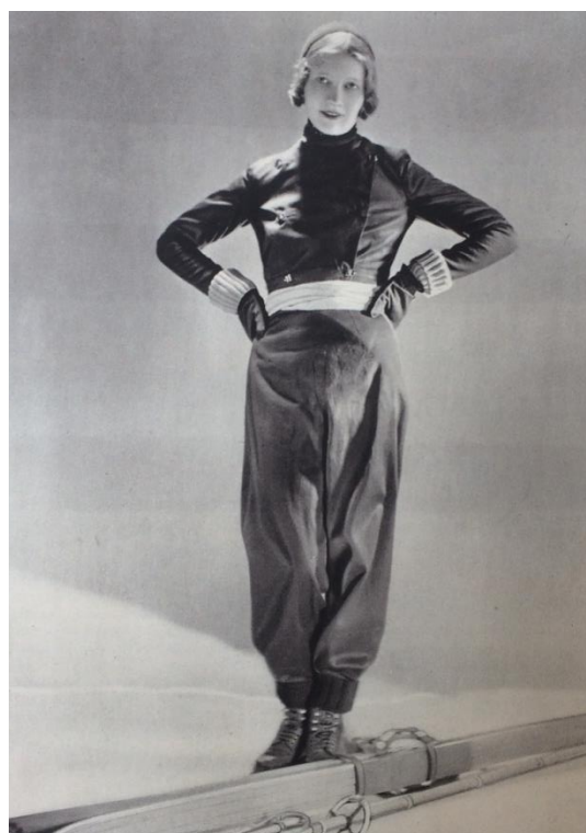
Obr. č. 15: lyžařský oblek ( Eva: časopis moderní ženy, IV., č. 5, 1932. )