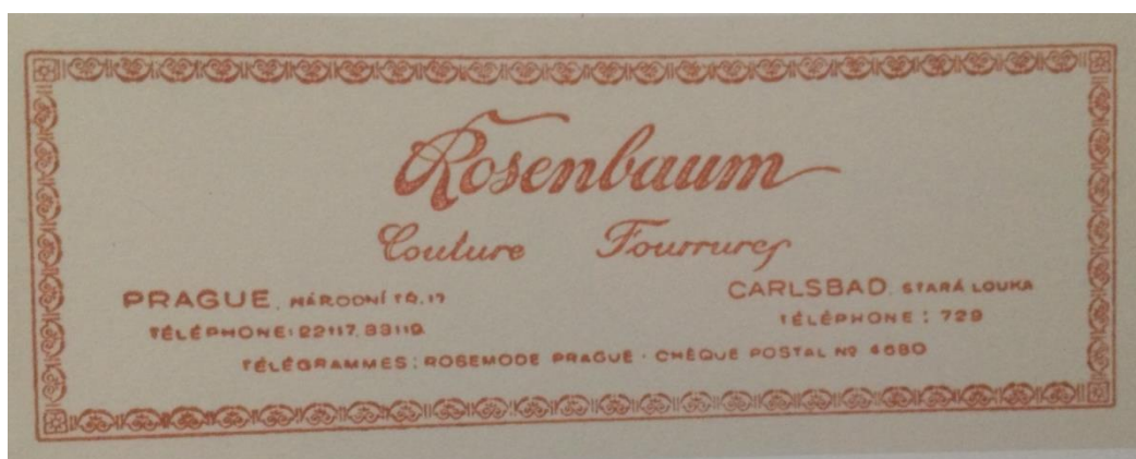
Obr. 24: salon Oldřich Rosenbaum (UCHALOVÁ, Eva, Zora DAMOVÁ a Viktor ŠLAJCHRT. Pražské módní salony 1900–1948: Prague fashionhouses 1900–1948. , s. 111.)