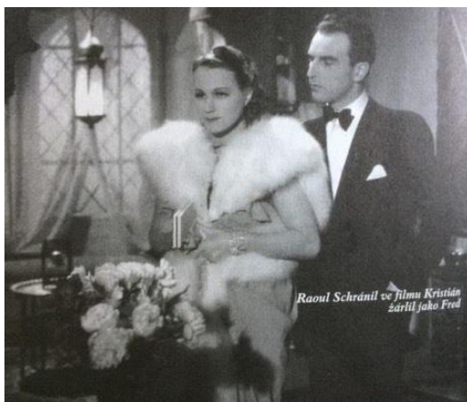
Obr. 27, 28: Adina Mandlová v šatech od Hanny Podolské ve filmu Kristida (UCHALOVÁ, Eva. Česká móda . Praha: Olympia, s. 93, TABÁŠEK, Arnošt. Adina Mandlová: fámy a skutečnost . Praha: Formát, 2003.)