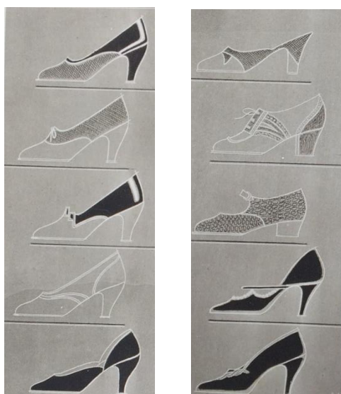
Obr. č. 13: Obuv ( Eva: časopis moderní ženy , II., č. 12, 1930.)