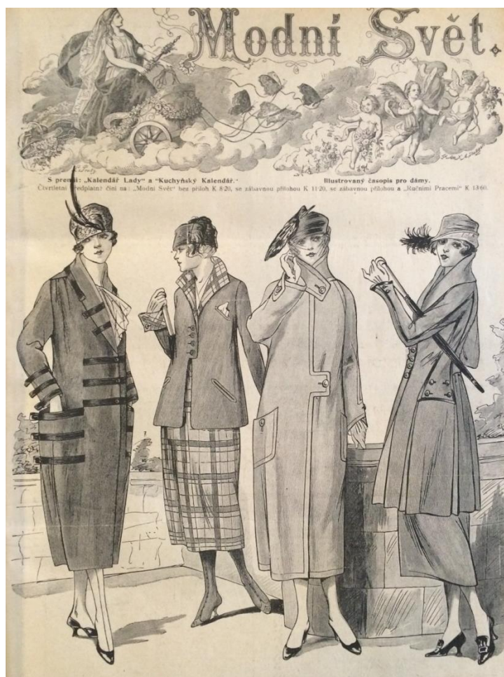
Obr. 1: Úvodní strana periodika Modní svět ( Modní svět , roč. XLII., č. 5, 1920.)