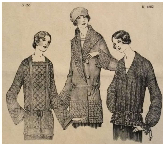
Obr. 8: Háčkované a pletené jupičky( Modní svět , roč. XLV., č. 4, 1923.)