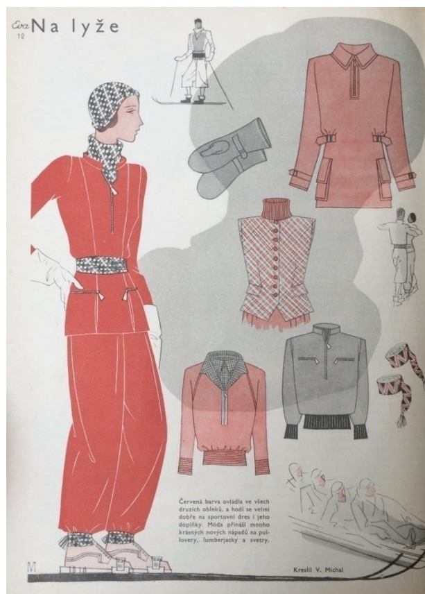
Obr. č. 14: Oblek na lyže ( Eva: časopis moderní ženy, IV., č. 3, 1931. )