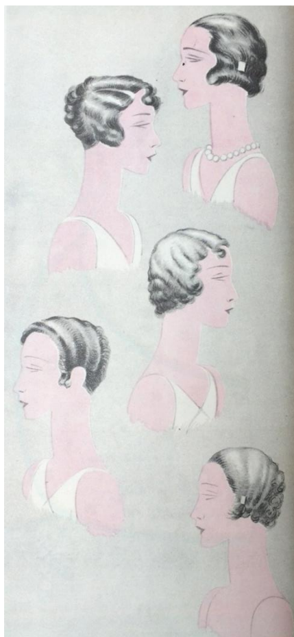
Obr. č. 12: Účesy ( Eva: časopis moderní ženy , III., č. 3, 1930.)