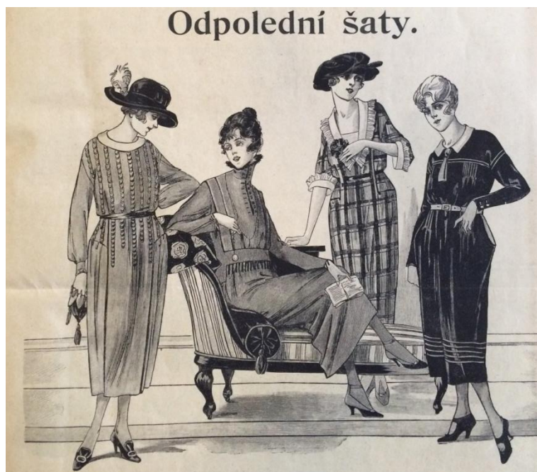
Obr. č. 4: Odpolední šaty ( Modní svět , roč. XLII., č. 1, 1920.)