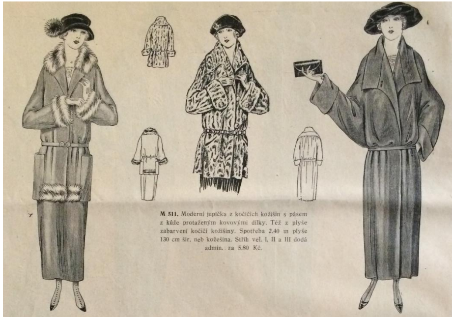
Obr. 6:kožešinové jupičky (Modní svět, roč. XLV., č. 2, 1923.)