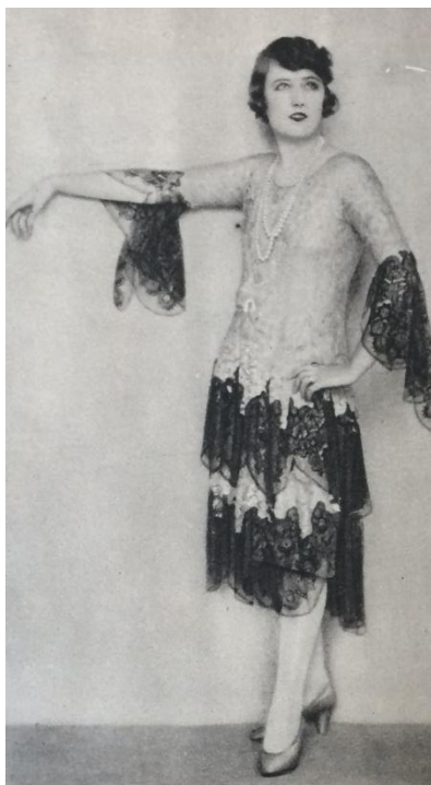
Obr. č. 10: šaty s bílou a černou krajkou ( Eva: časopis moderní ženy , I., č. 2, 1928–1929.)