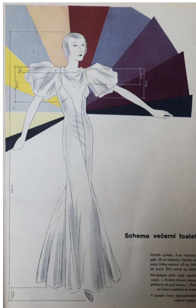
Obr. č. 17: Schéma večerní toalety ( Eva: časopis moderní ženy , V., č. 1, 1932.)