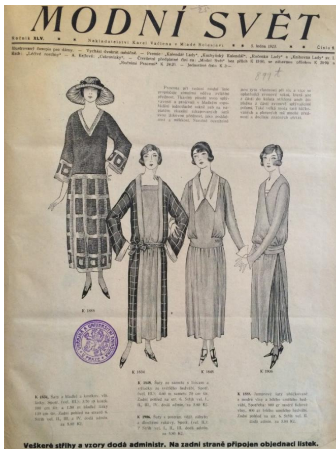
Obr. 2: Úvodní strana periodika Modní svět ( Modnísvět , roč. XLV., č. 1, 1923.)