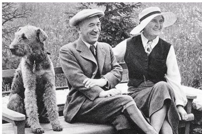
Obr. 20: manželé Benešovi v Sezimově ústí (ZÍDEK, Petr. Po boku: třiatřicet manželek našich premiérů (1918–2012), s. 61. )