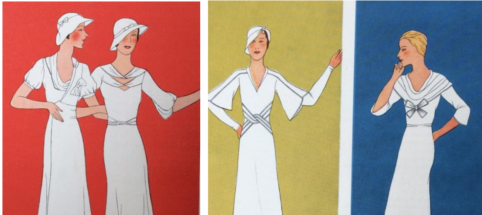
Obr. č. 16: Nové zdobení šatů ( Eva: časopis moderní ženy , IV., č. 19, 1932.)