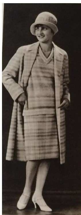
Obr. č. 11: Sportovní kostým ( Eva: časopis moderní ženy , I., č. 11, 1929.)