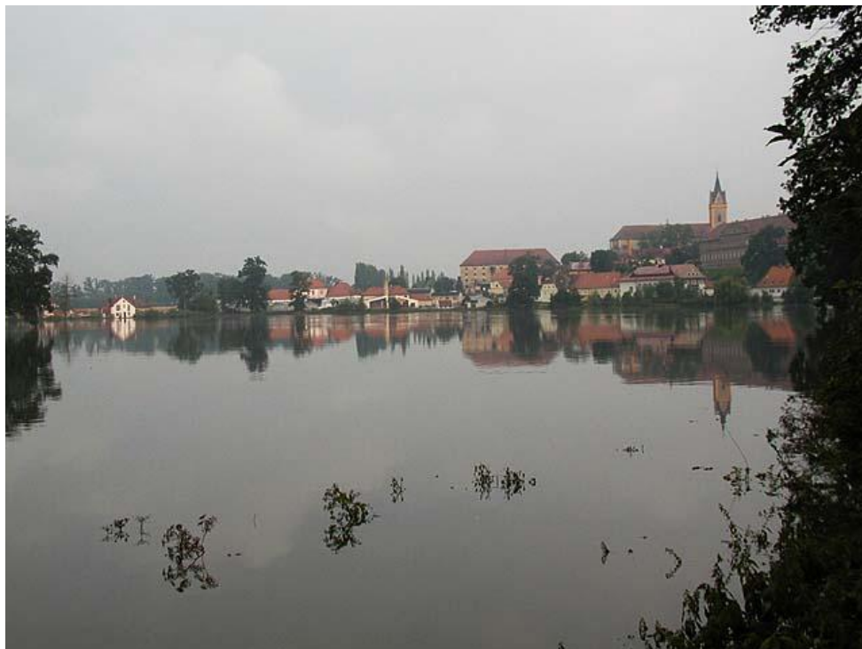
Obrázek 2: Zaplavená část obce Hluboká nad Vltavou