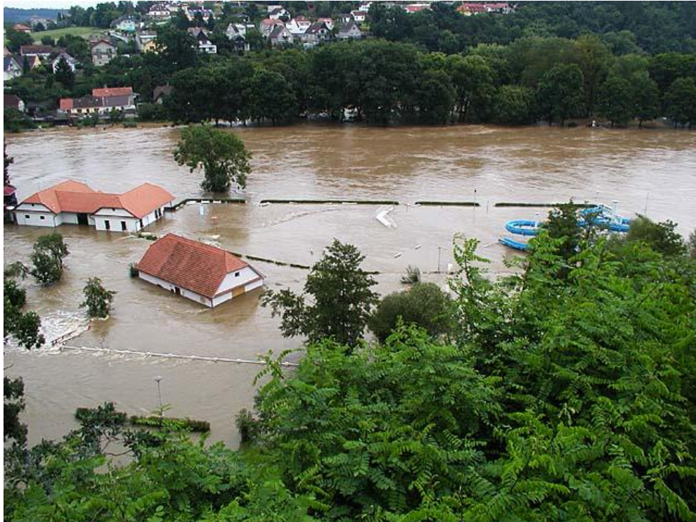
Obrázek 3: Zaplavené koupaliště a domy obyvatel Hluboké nad Vltavou