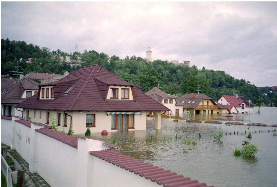
Obrázek 4: Zaplavené domy obyvatel Hluboké nad Vltavou