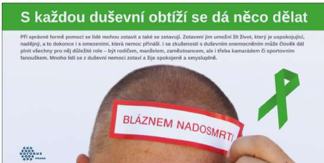
Obr. č. 4: Ukázka banneru kampaně „Nálepkování“