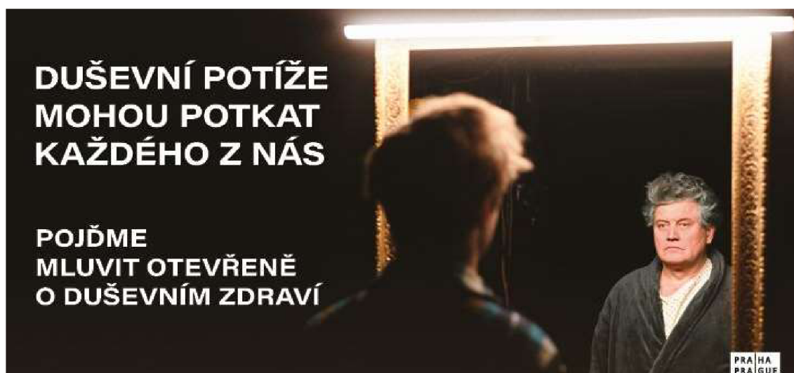
Obr. č. 5: Ukázka billboardu kampaně „Svoboda uzdravuje“