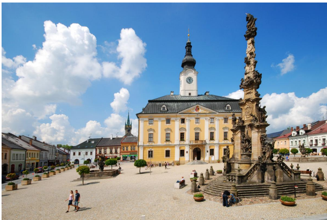
Obrázek 4-1 Palackého nám. ve městě Polička

Město Polička se nachází v Pardubickém kraji, v okrese Svitavy. Město je členěno na 6 částí: Dolní Předměstí, Horní Předměstí, Město, Lezník (obec připojena k městu roku 1976 se nachází 4 km na sever od Poličky), Modřec (obec připojena k městu roku 1974 se nachází 5 km na jihovýchod od Poličky), Střítež (obec připojena k městu roku 1980 se nachází 4 km na severozápad od Poličky) ( www.policka.org ).