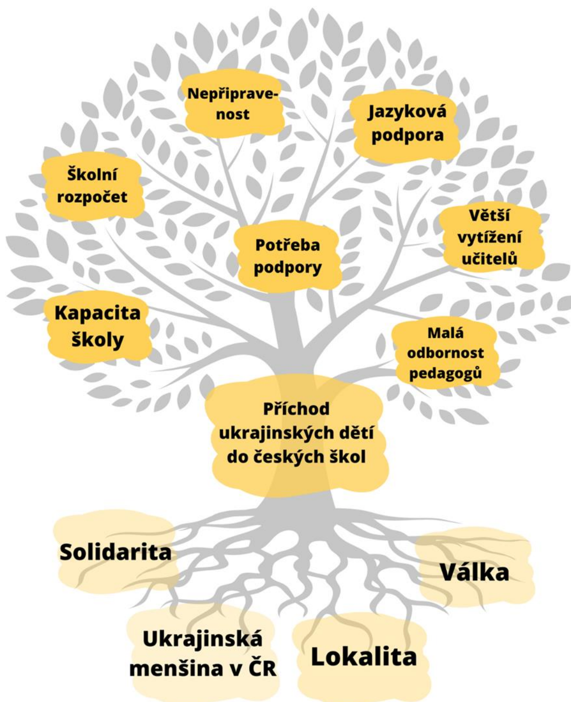
Obrázek: Problem tree