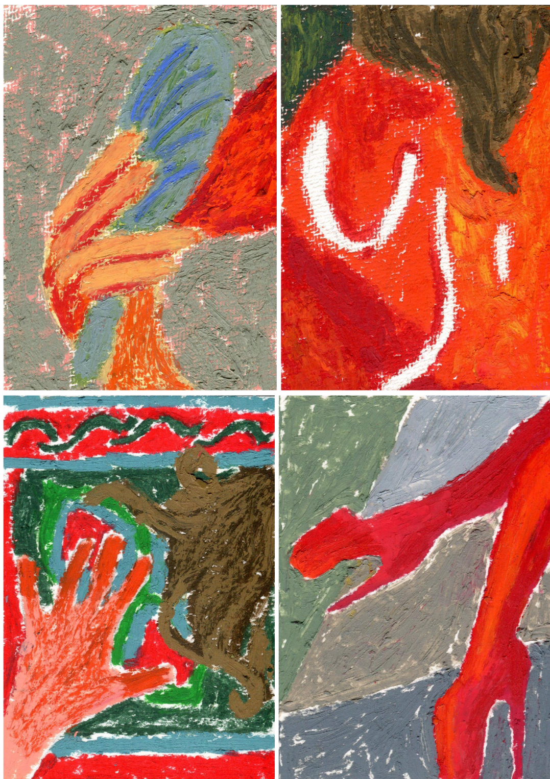
Ze série Pohlednice pro Tebe , olejový pastel na papíře, 10 x 15 cm, 2023