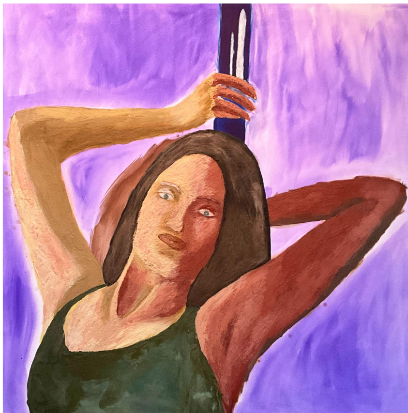
Bez názvu, enkaustika na plátně, 150 x 150 cm, 2023