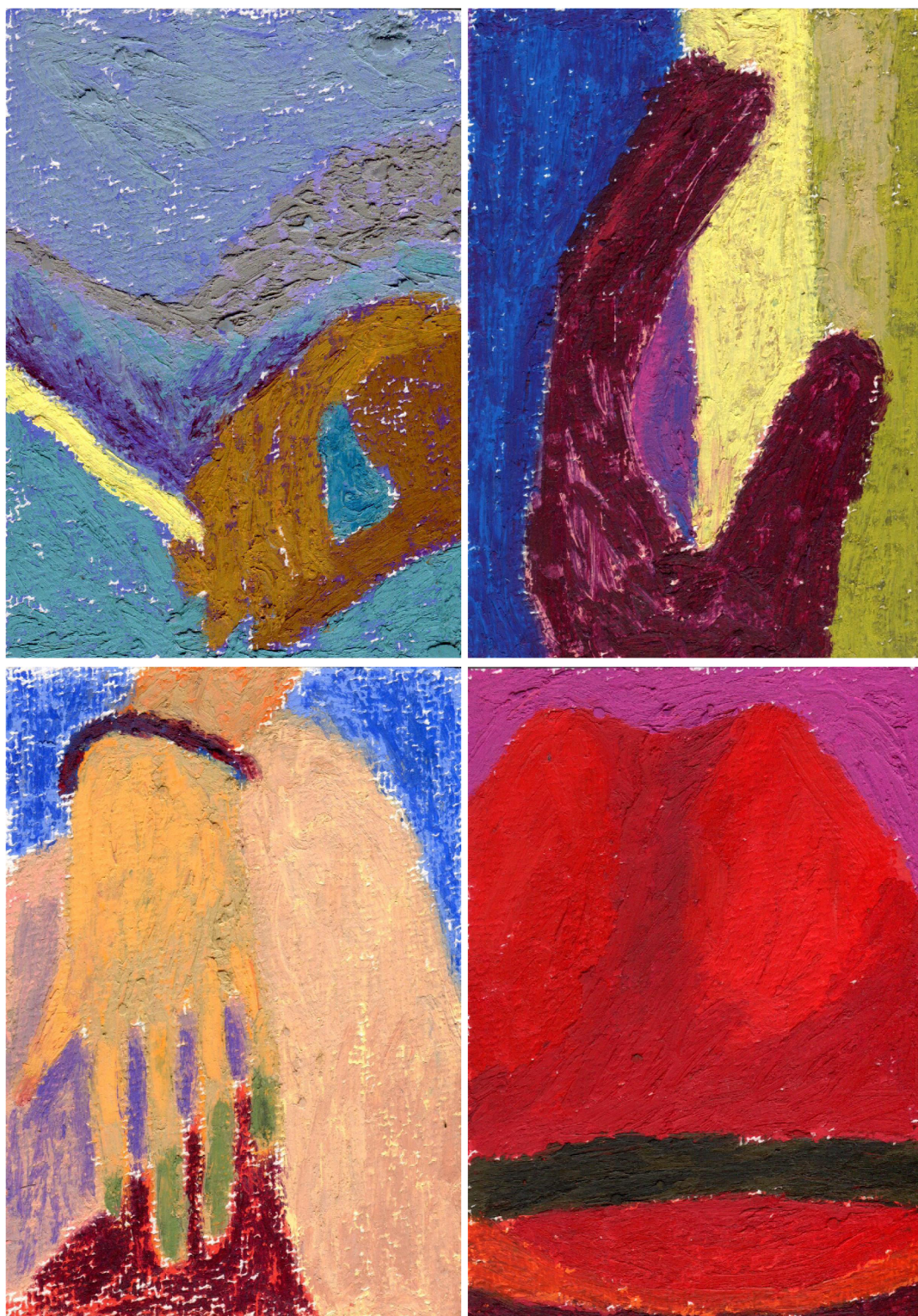
Ze série Pohlednice pro Tebe , olejový pastel na papíře, 10 x 15 cm, 2023