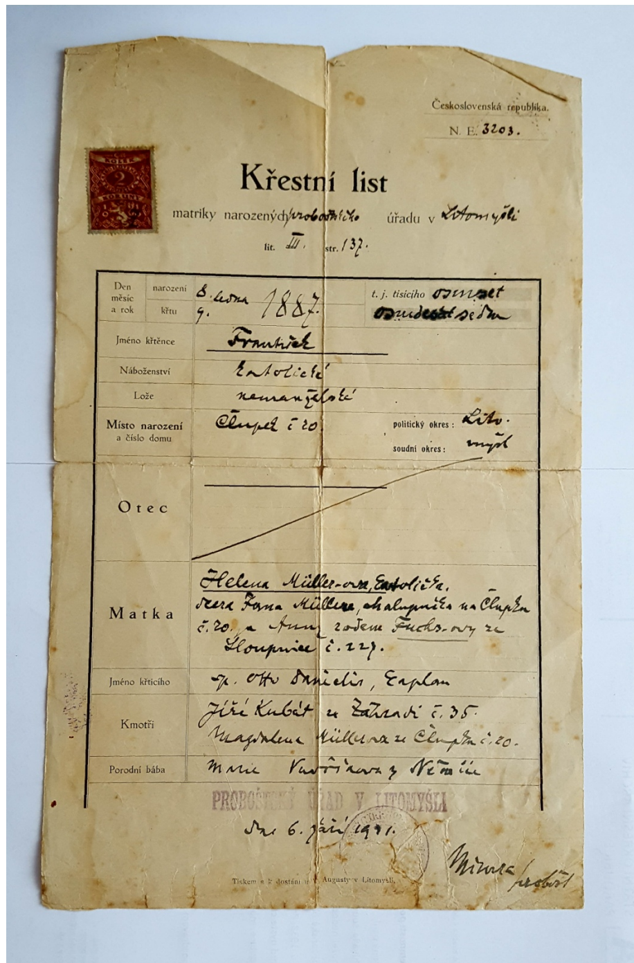
Příloha č. 7: Opis křestního listu Františka Müllera vydaný dne 6. září 1919. Proboštský úřad v Litomyšli.