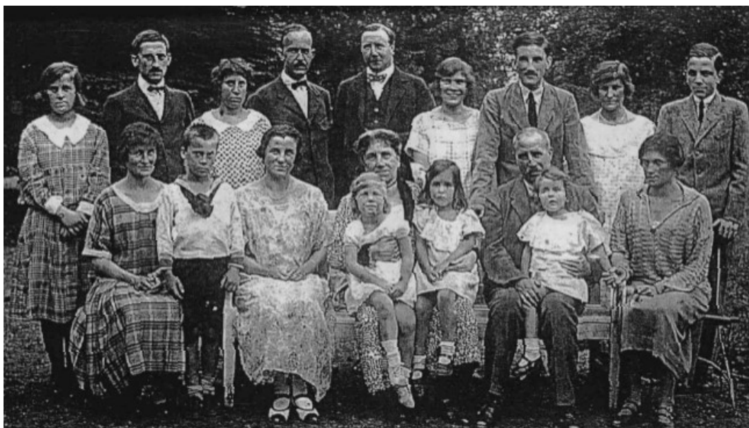
Příloha č. 6: Rodinná fotografie Mensdorffů-Pouilly z Chotělic (rok 1928).