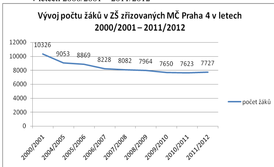
Graf 2: Vývoj počtu žáků v ZŠ zřizovaných v MČ Praha 4 v letech 2000/2001 – 2011/2012

Zdroj: Koncepce rozvoje školství na území MČ Praha 4 v letech 2011-2014 [online]. [cit. 2012-28-2]. Dostupné z WWW:< http://www.praha4.cz/files/=47451/6Z-42-PR1.doc >.