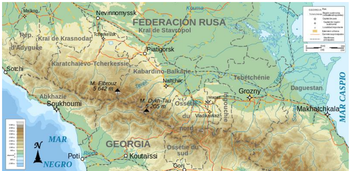
Obr. 1 Topografická mapa Kavkazského regionu 7

Jako „Severní Kavkaz“ se v ruské geografii zpravidla označuje území těch subjektů Ruské federace, které zcela, nebo alespoň významnou částí svého území leží na severním podhůří Kavkazu. Konkrétně se jedná o Severní Osetii, Inguško, Čečensko, Dagestán a Karačejevsko-čerkeskou republiku.