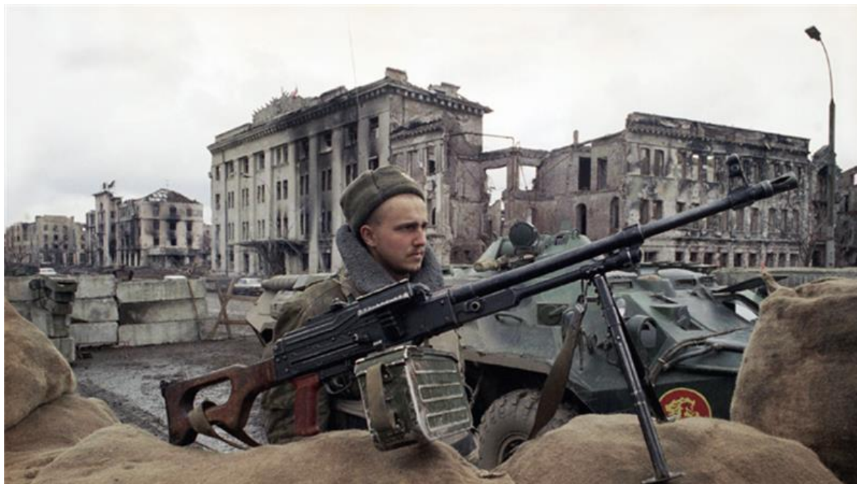
Obr. 4 Čečenský voják při obraně města Groznyj 17

Zakajev, funkce prezidenta ale už obsazena nebyla. Zakajevův vliv zůstal ale značně omezený a zdá se, že v současnosti se už žádné relevantnější exilové skupiny k projektu Čečenské republiky Ičkerie nehlásí. 16