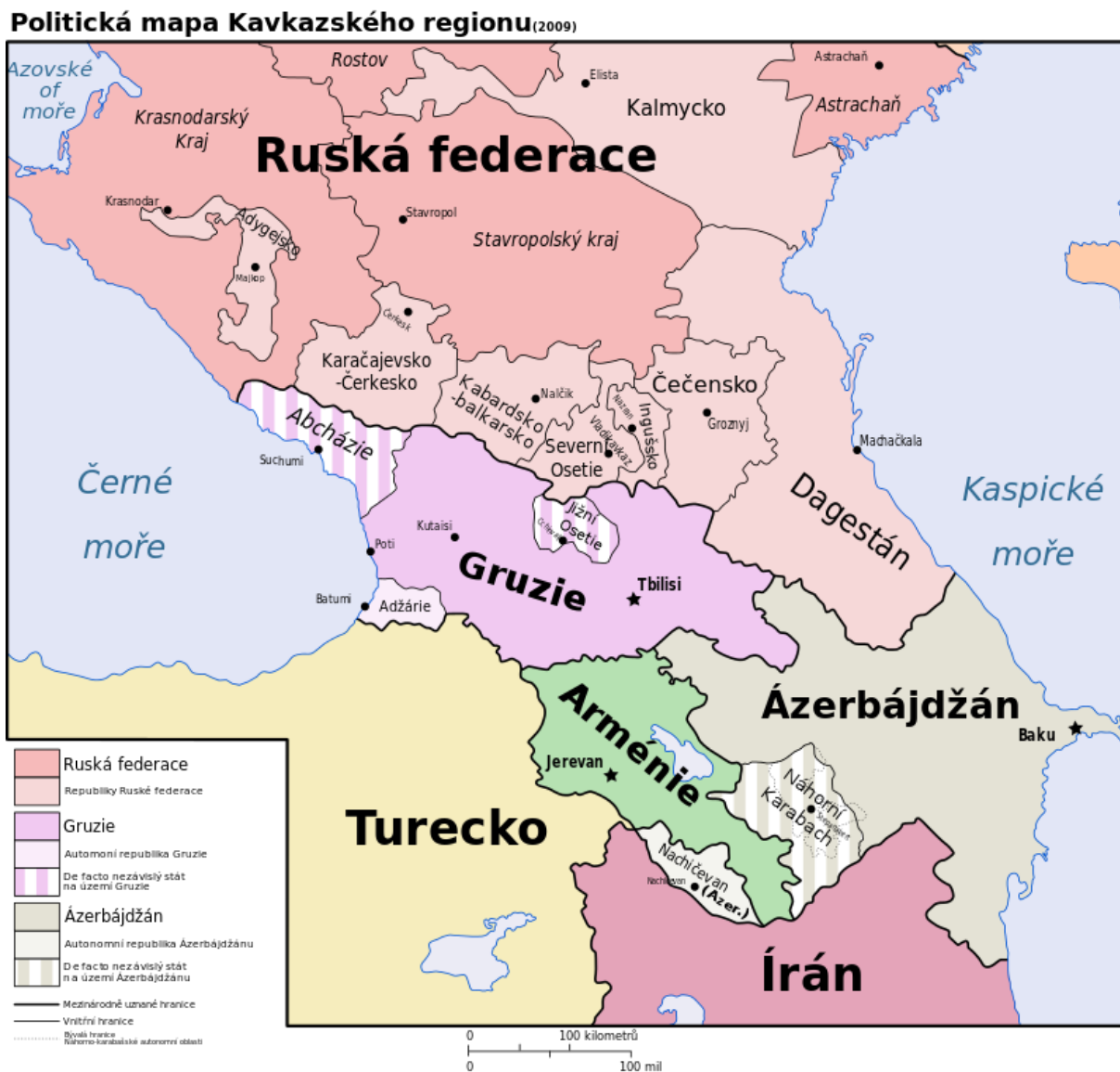
Obr. 2 Politická mapa Kavkazského regionu 8

Hlavní město Groznyj, s téměř třemi sty tisíci obyvateli, leží na úpatí Velkého Kavkazu ve výšce přibližně 130 m n. m. Město založili jako vojenskou pevnost v roce 1818 terečtí kozáci u břehu řeky Sunža. V roce 1869 dostalo jméno Groznyj. Územní strukturu Čečenska tvoří 15 rajónů (okresů) a 5 měst, kromě již zmíněného hlavního města to jsou Urus-Martan, Gudermes, Šálí a Naurskaja. 9