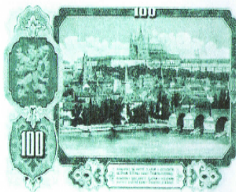
Stokorunová bankovka emise 1953, tištěná v Moskvě. Byla vydána do oběhu 1. června 1953 při peněžní reformě. Obrazové příklady dodalo ministerstvo financí v Praze. Původně se počítalo, že na líci bude uplatněn motiv z Admelaova Orloje na staroměstské radnici v Praze nebo motiv z cyklu M. Alše „Vlast“. Ilc, rub.

Praha: Jirásek, Z. - Šála, J. Velká peněžní kupa. Praha, Sotkání 1992.