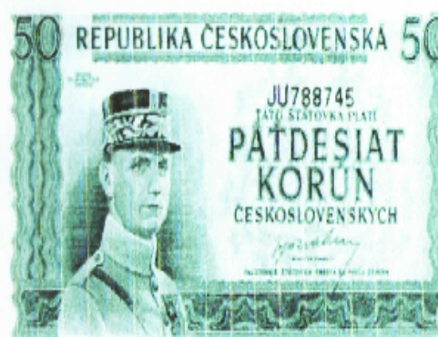
Padesátkorunová státní emise, s podpisem ministra financí Fejerabenda, b. d., s portrétem M. R. Štefánika – Ilc.