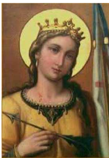
Obrázek 2: svatá Voršilka