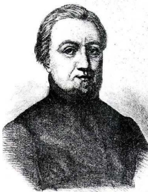
Obrázek 5: Bohuslav Balbín (1621 - 1688)

Zdroj: GOOGLE: Obrázky. [online]. [cit. 2020-03-03]