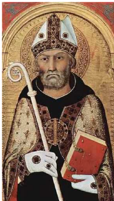
Obrázek 1: Aurelius Augustinus