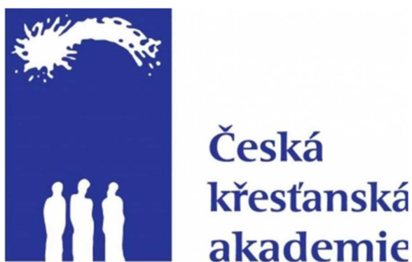
Obrázek 7: logo ČKA