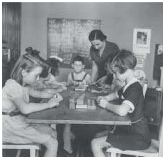
Obrázek 6: židovská škola