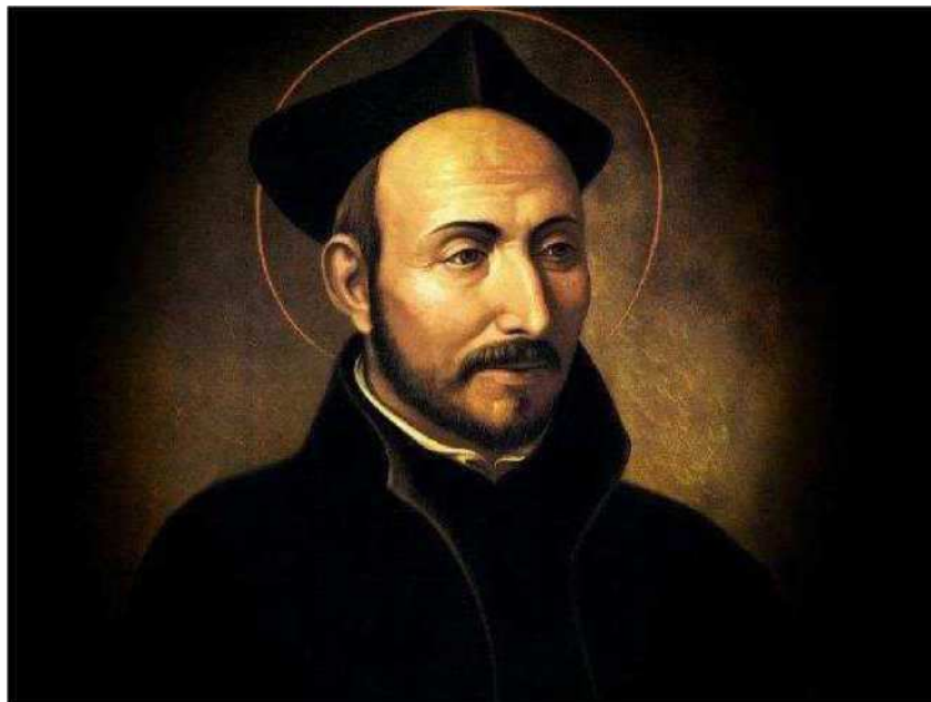
Obrázek 3: Ignác z Loyoly (1491 - 1556)

Zdroj: GOOGLE: Obrázky. [online]. [cit. 2020-03-03]