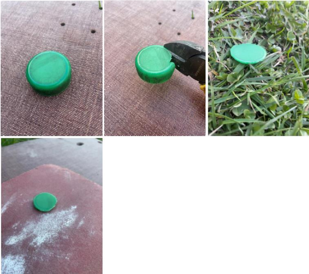
Fotografie č. 6