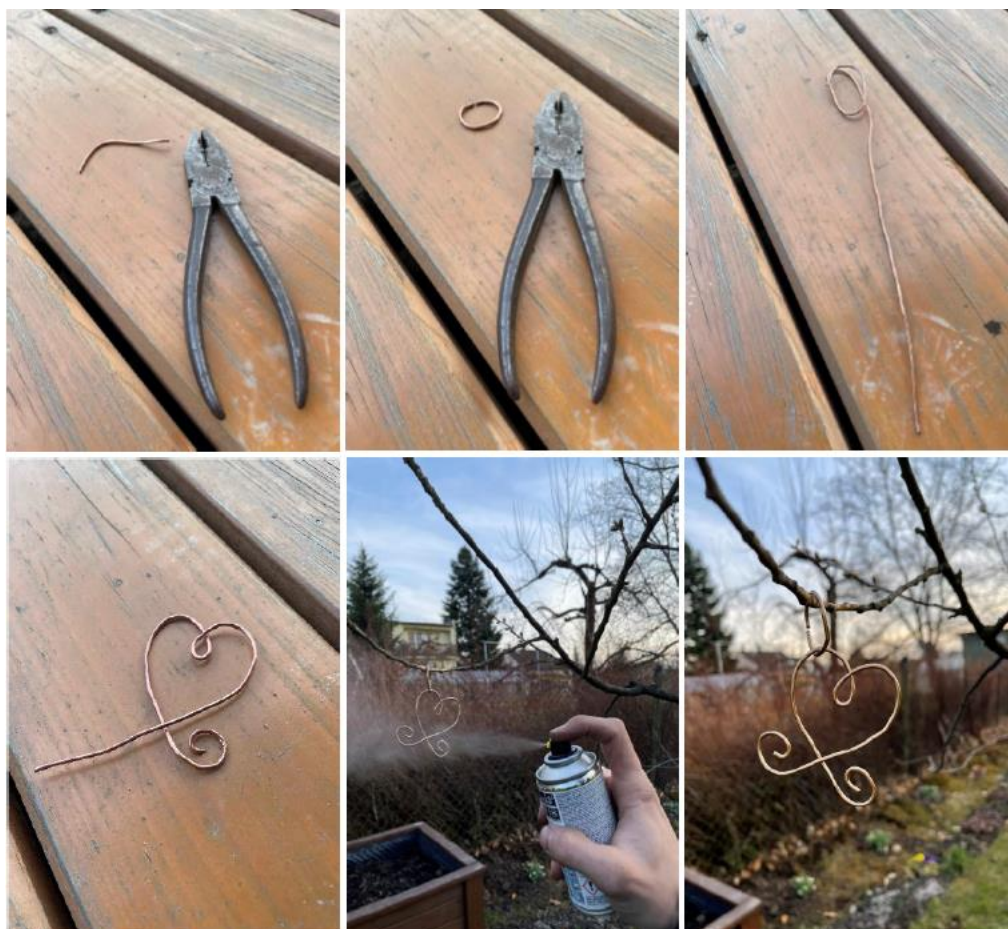
Fotografie č. 10