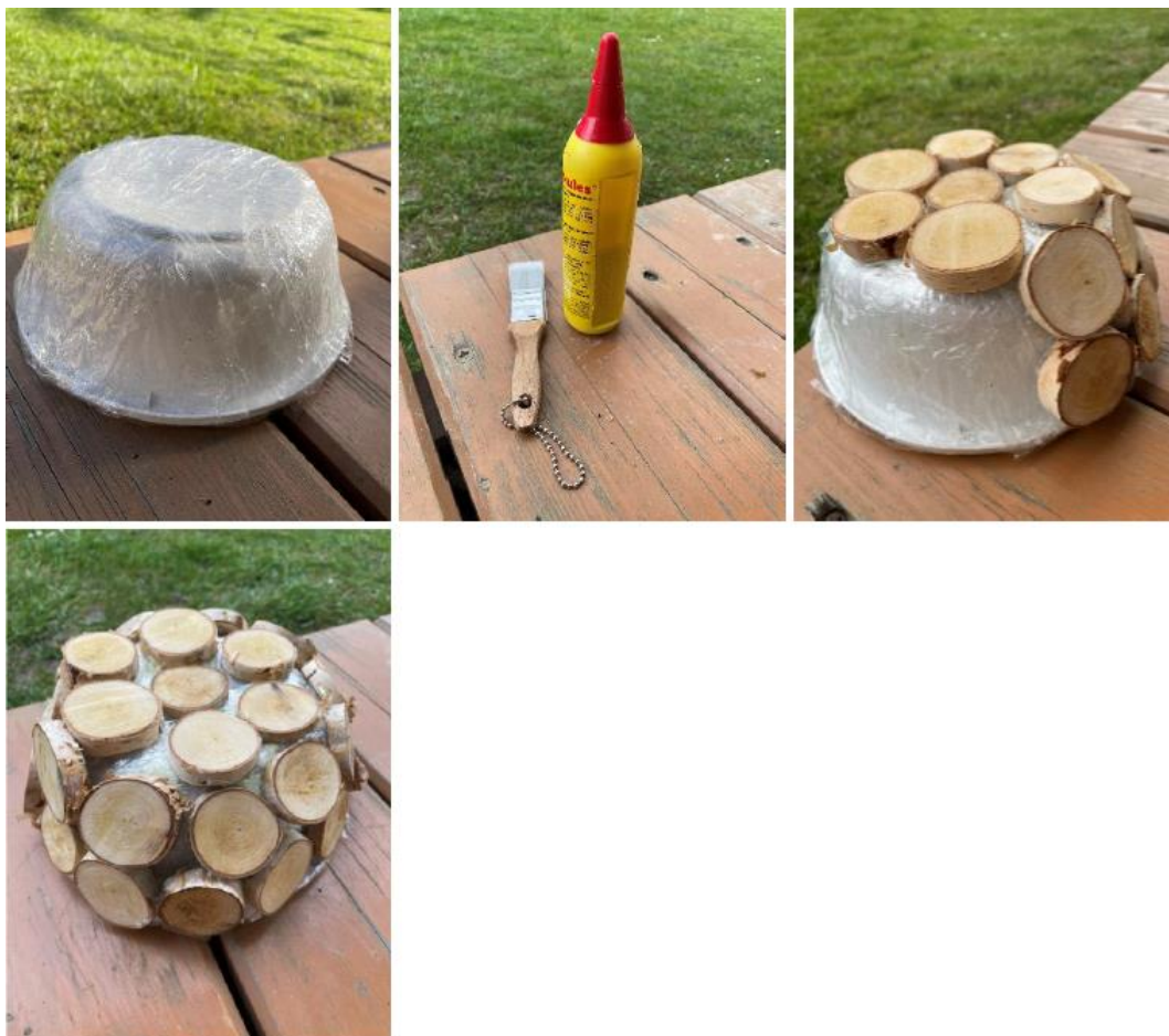
Fotografie č. 7