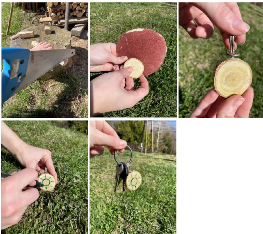
Fotografie č. 9