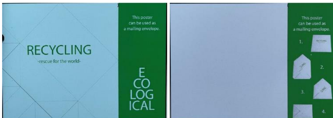
Fotografie č. 3