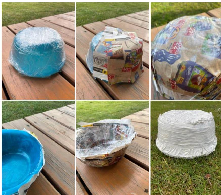
Fotografie č. 2