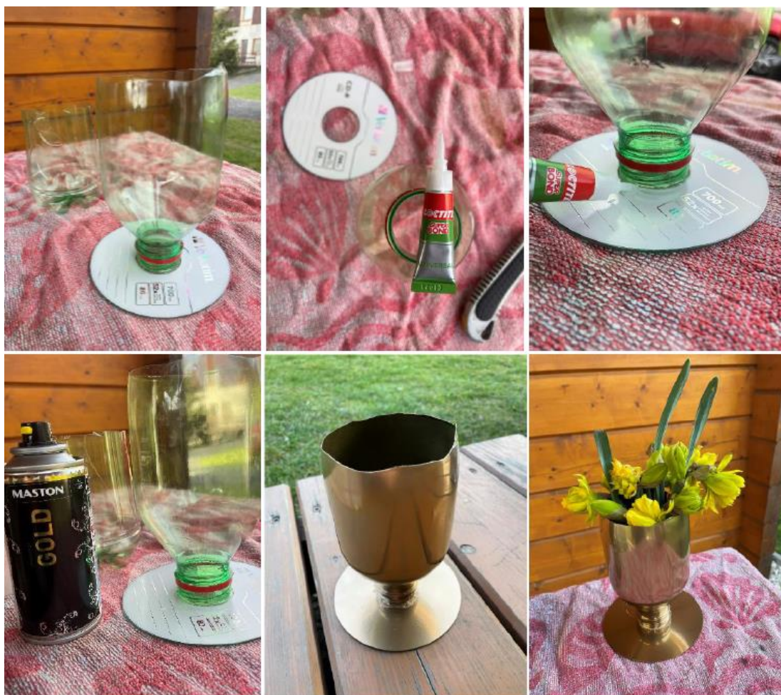
Fotografie č. 5