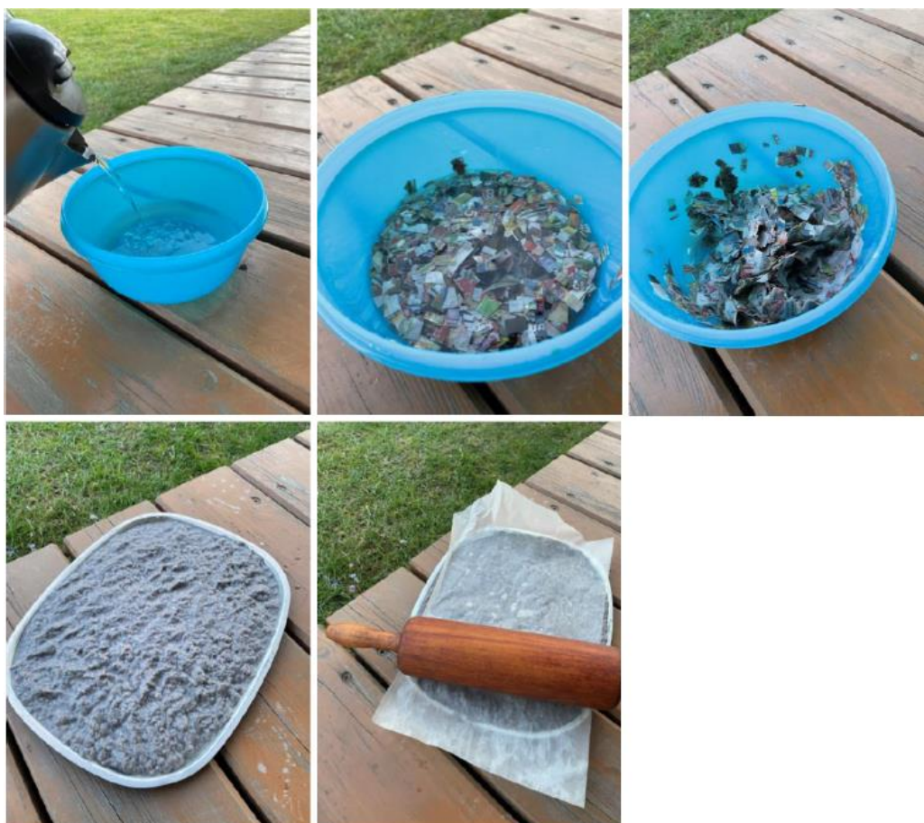
Fotografie č. 1