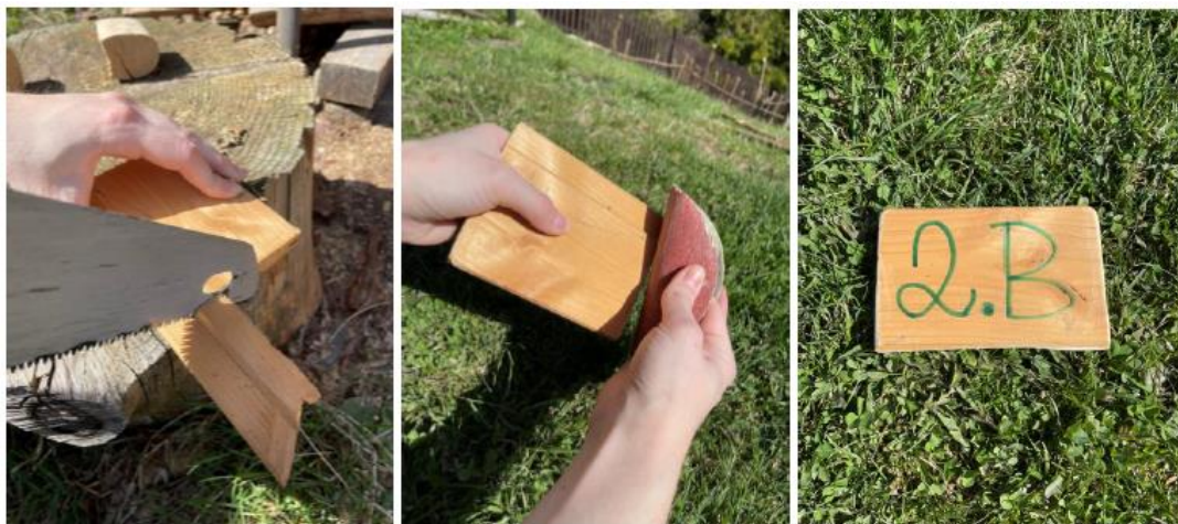
Fotografie č. 8