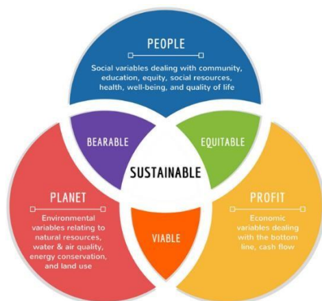
Obrázek 4: Tripple bottom line CSR