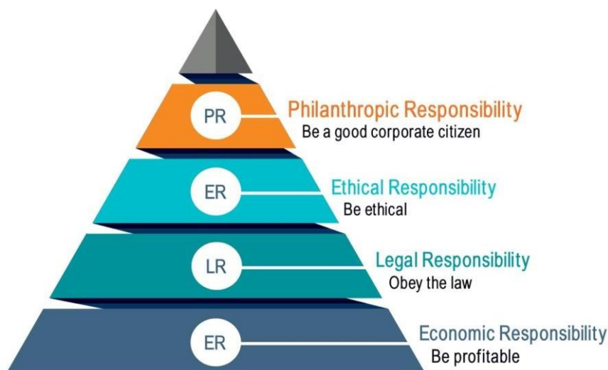
Obrázek 1: Pyramida společenské odpovědnosti firem