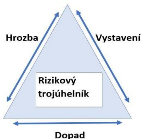
Obrázek 5: Rizikový trojúhelník