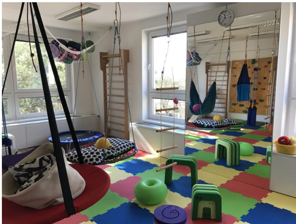
Obrázek 2 Ukázka vybavení terapeutické místnosti (Play Si).

Terapie ASI probíhá zpravidla v místnostech, které jsou vybaveny speciálními pomůckami, jako jsou například nestabilní plošiny, velké míče či houpačky. Důraz je kladen také na pestrý výběr struktur a materiálů (Kolář et al., 2020, s. 310). Obrázek 2 ukazuje možnou výbavu