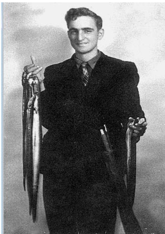
Obrázek 1: Ota Pavel

Zdroj: Ota Pavel. [online]. [cit. 2013-02-15].