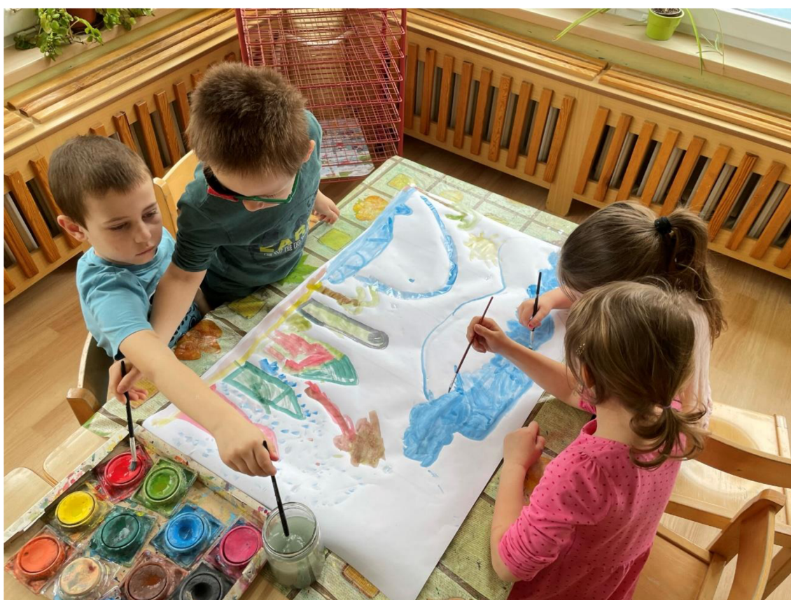
Obrázek 6: Společné kreslení: skupina 2