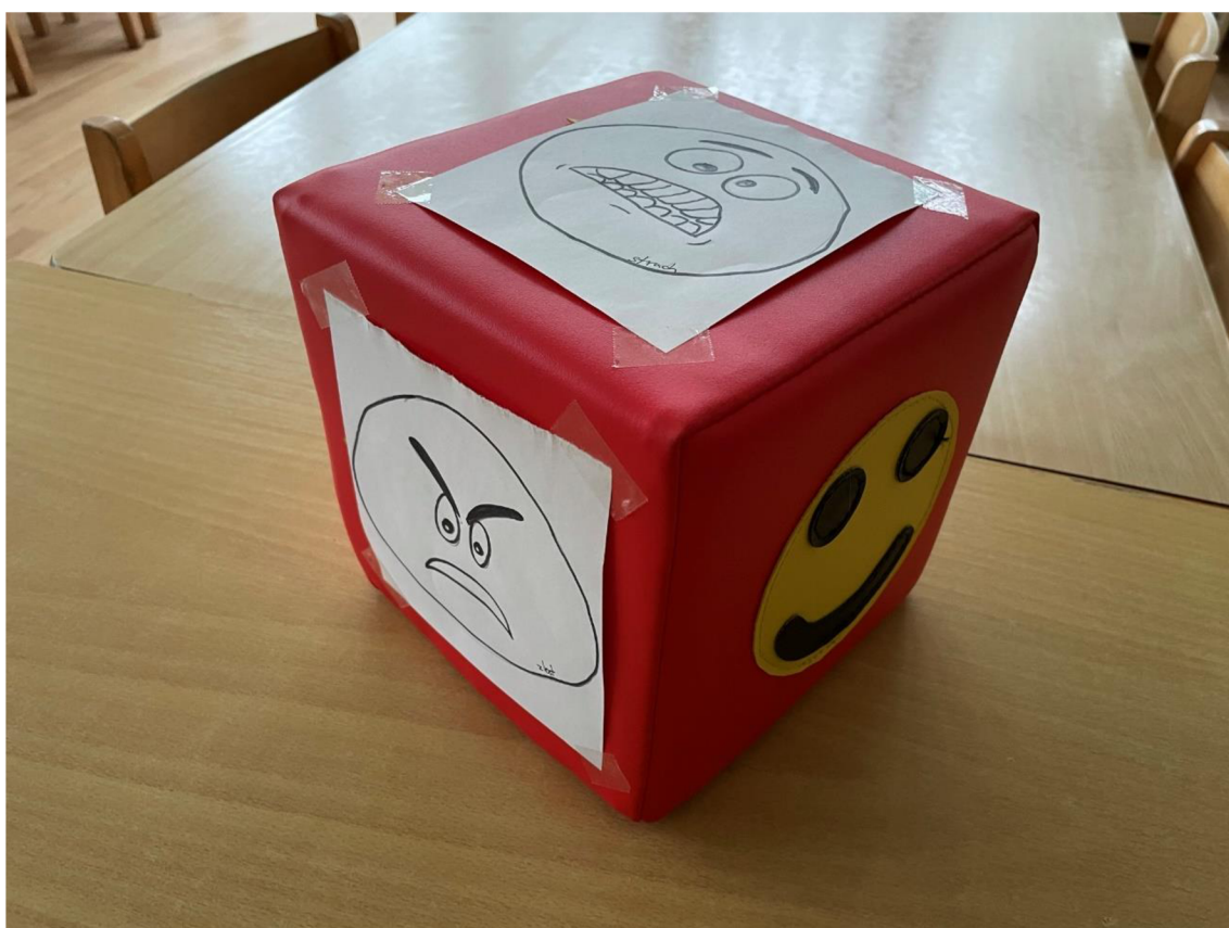
Obrázek 10: Kostka emocí