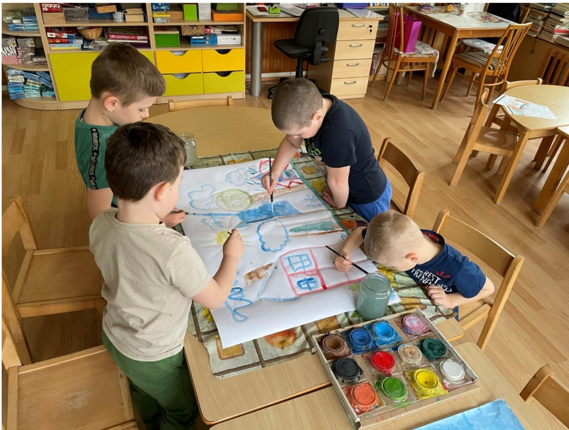
Obrázek 7: Společné kreslení: skupina 3