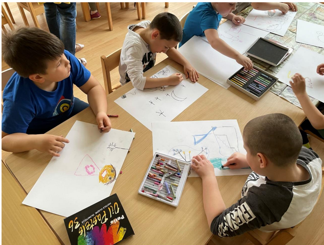
Obrázek 3: Malování vlastních strachů