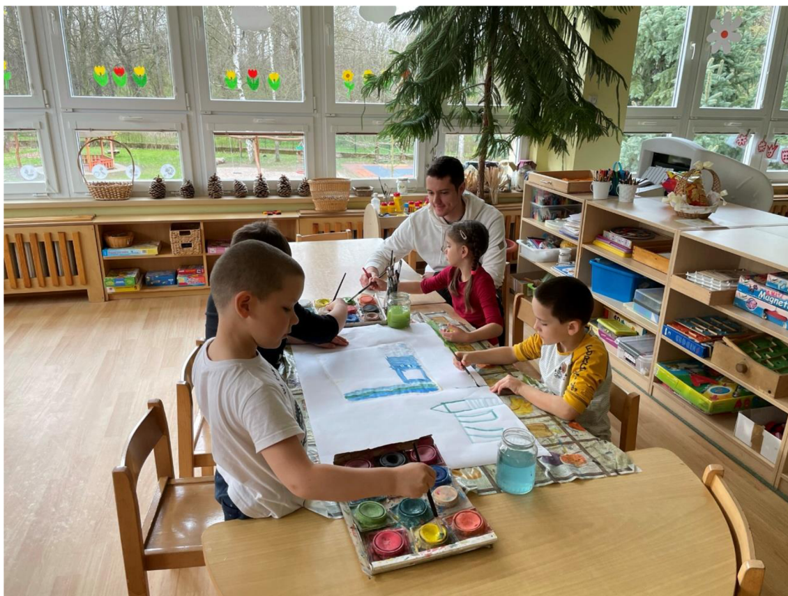
Obrázek 5: Společné kreslení: skupina 1