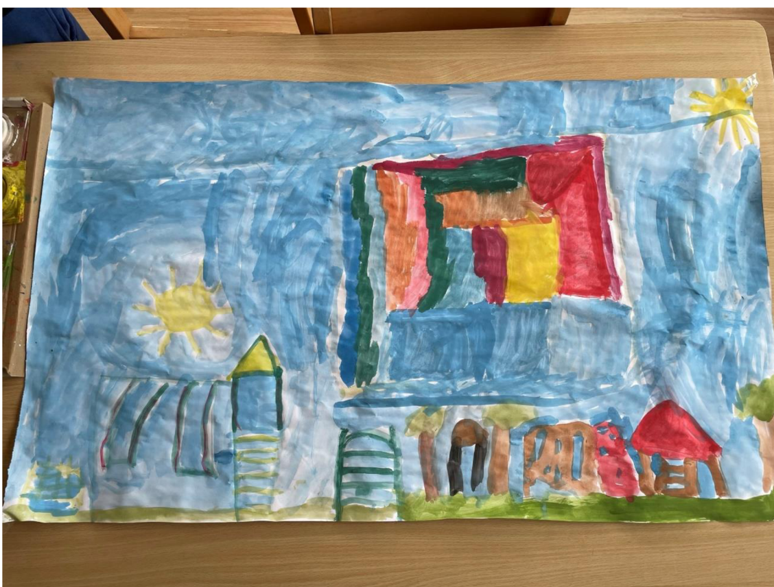
Obrázek 8: Výsledek tématické skupinové kresby