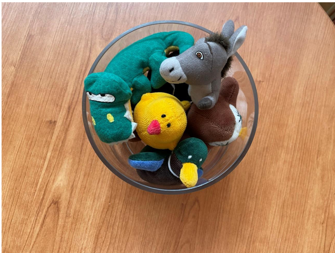
Obrázek 9: Maňasci k pohádce „Jak si zvířátka povídají o strachu“