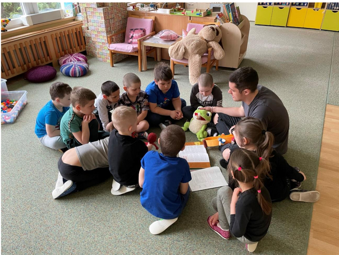
Obrázek 2: Práce s knihou