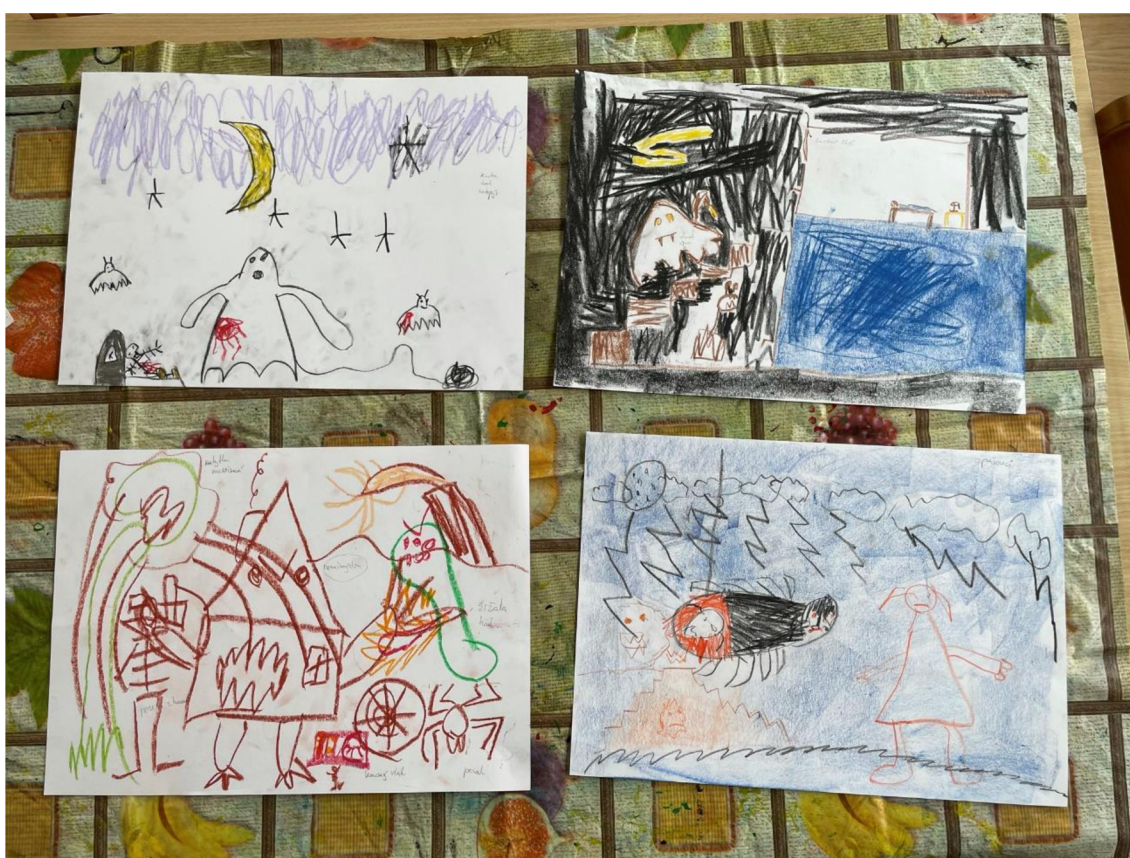
Obrázek 4: Ukázka strachů dětí