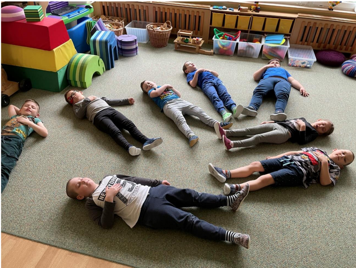
Obrázek 1: Návčik relaxace