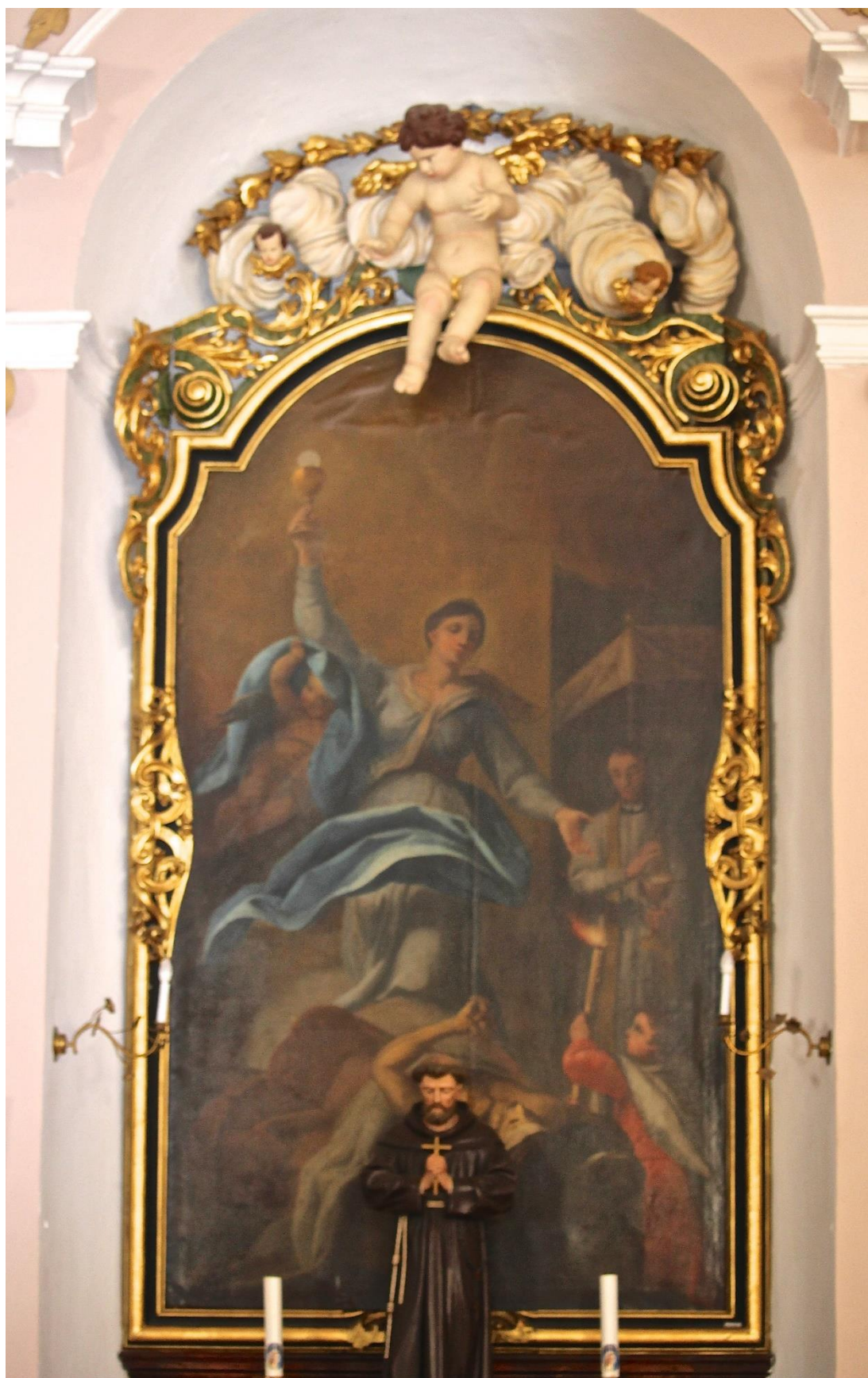
Příloha č. 14. Oltářní obraz sv. Barbory a socha sv. Františka z Assisi na bočním oltáři v kostele sv. Liboria v Jesenci. Foto Anna Burgetová.