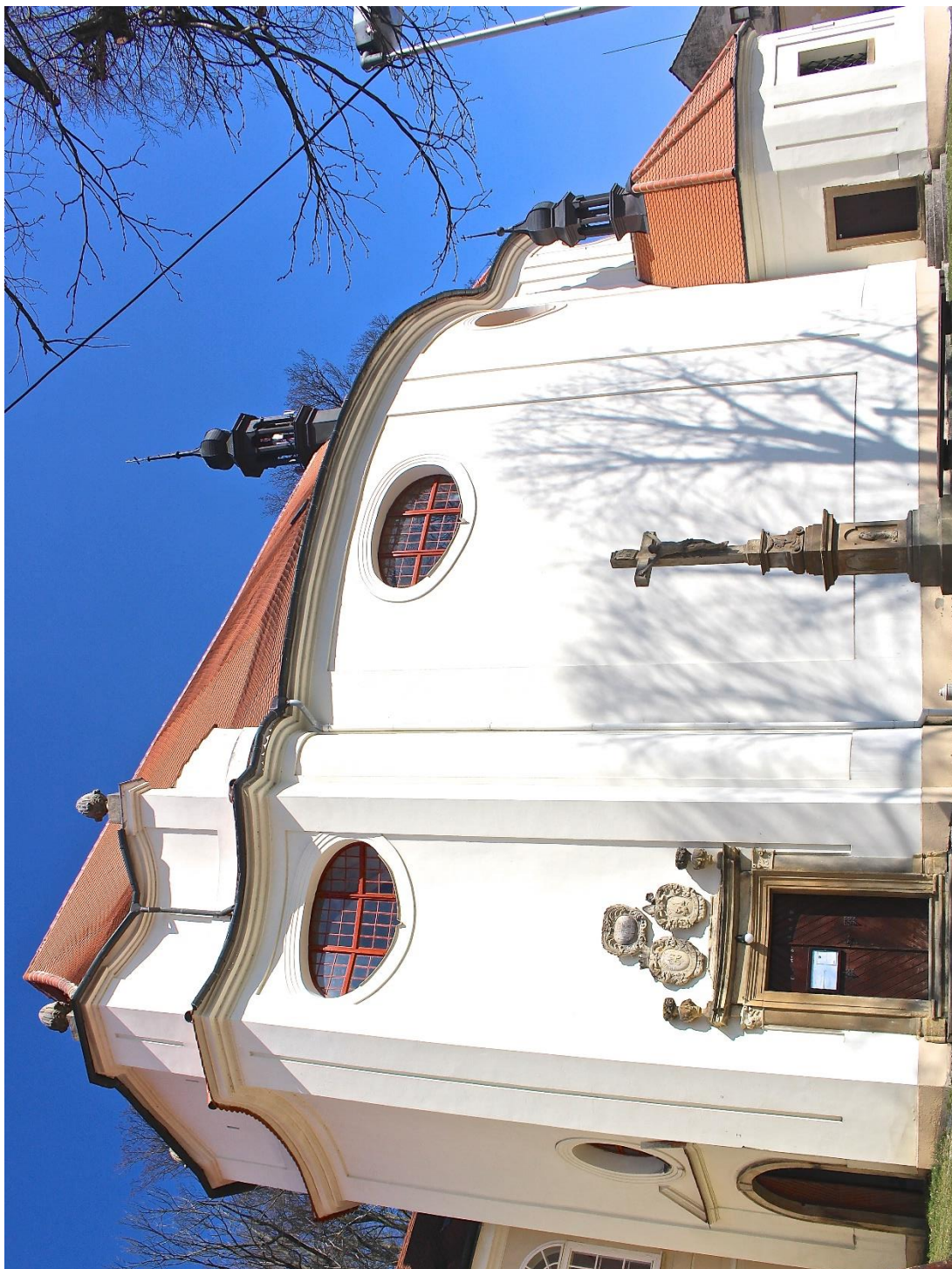
Příloha č. 3. Kostel sv. Liboria v Jesení, pohled z jihozápadní strany.