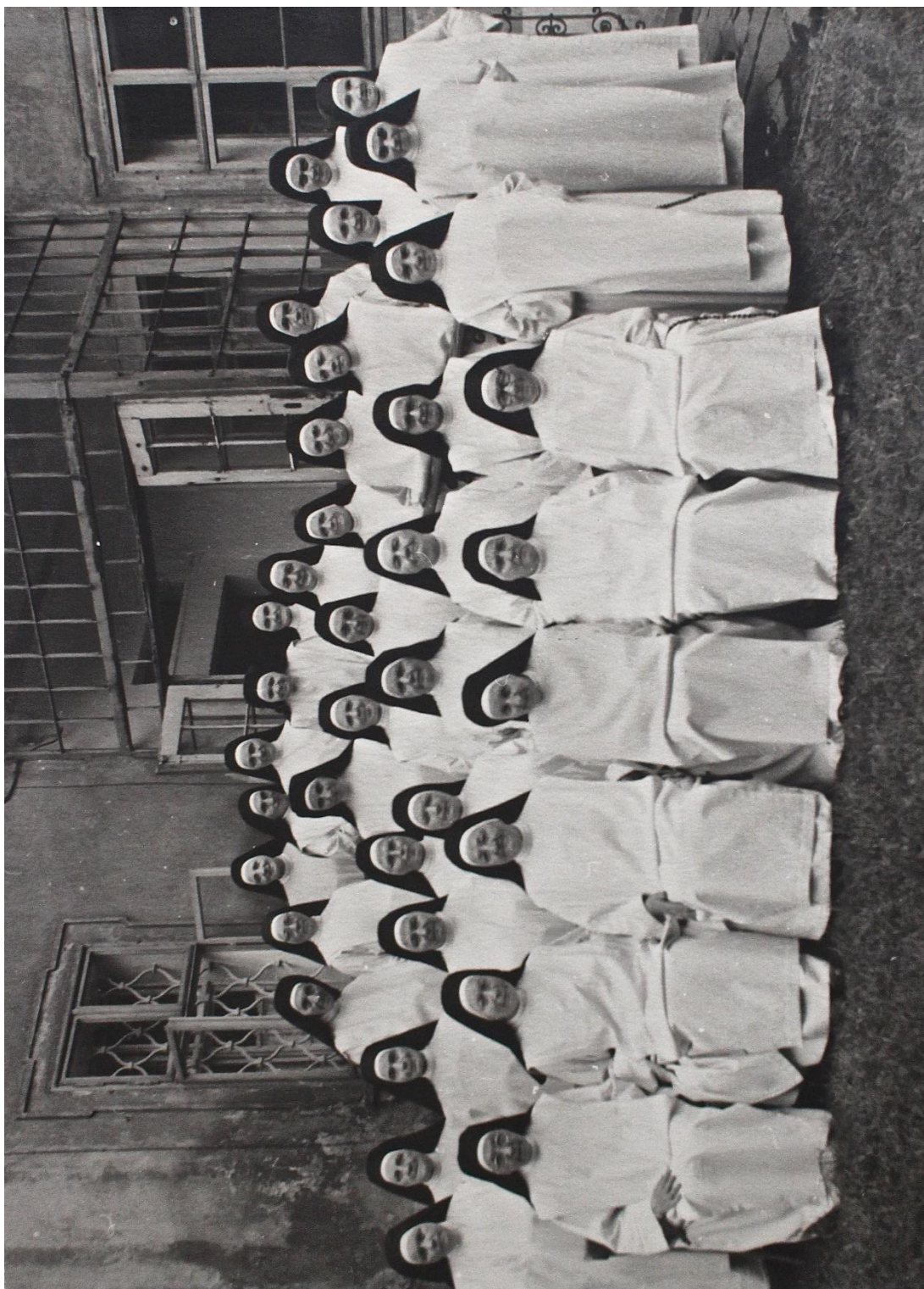
Příloha č. 33. Sestry dominikánky v Kadani. Archiv České kongregace sester dominikánek v Brně, sign. F22a, Fotoalbum Kadaň.