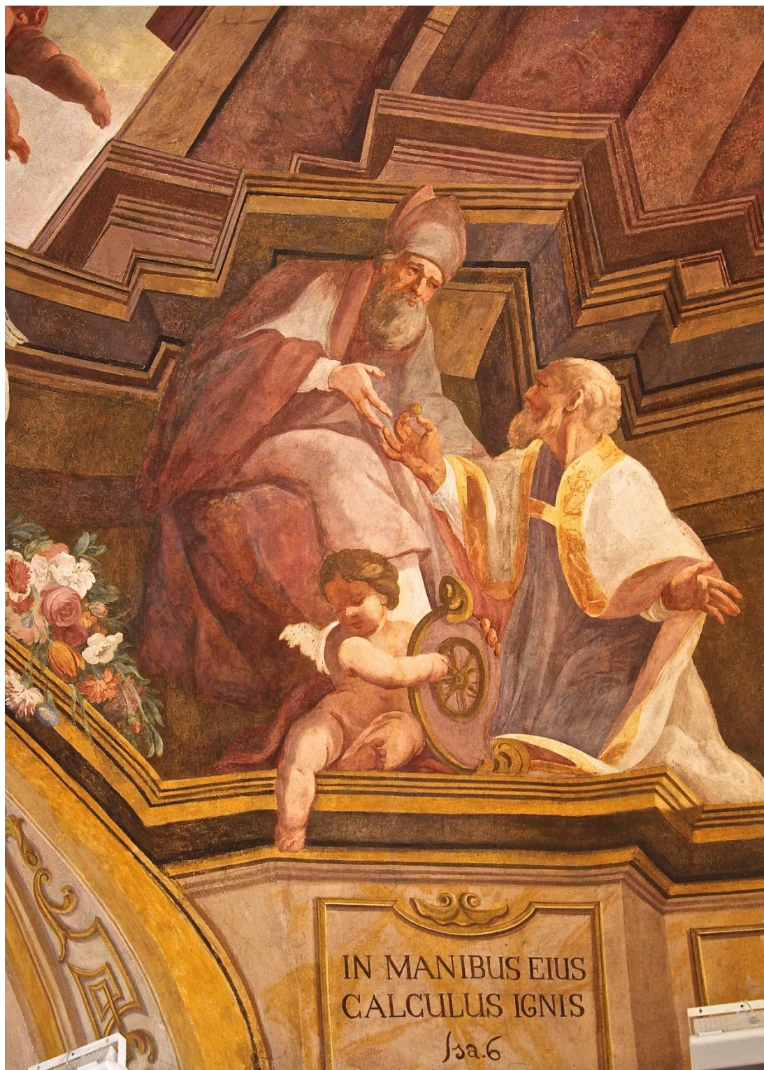
Příloha č. 7. Jan Michael Fissé (přípsáno), Sv. Liborius uzdravuje mohučského arcibiskupa Wenera z Eppsteinu, kolem roku 1714. Detail fresky na klenbě lodi v kostele sv. Liboria v Jesenci.