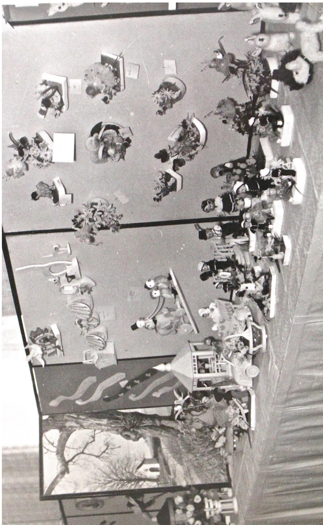
Příloha č. 26. Výstava výrobků vyrobených chovankami ústavu v Jesenci. Konala se v červnu 1966 v jesenecké sokolovně.