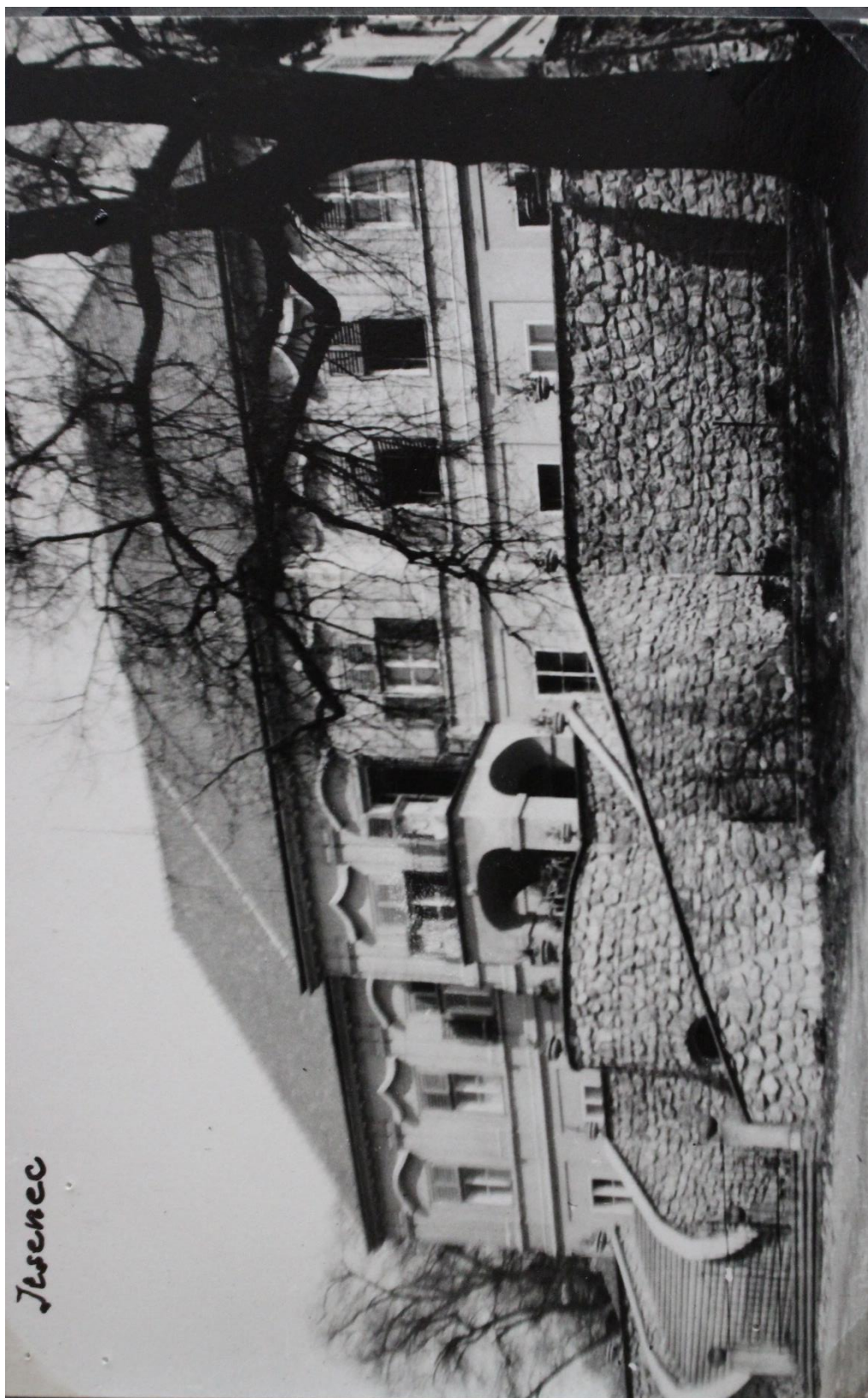
Příloha č. 21. Zámek v Jesenci v době, kdy jej vlastnila Česká kongregace sester dominikánek.