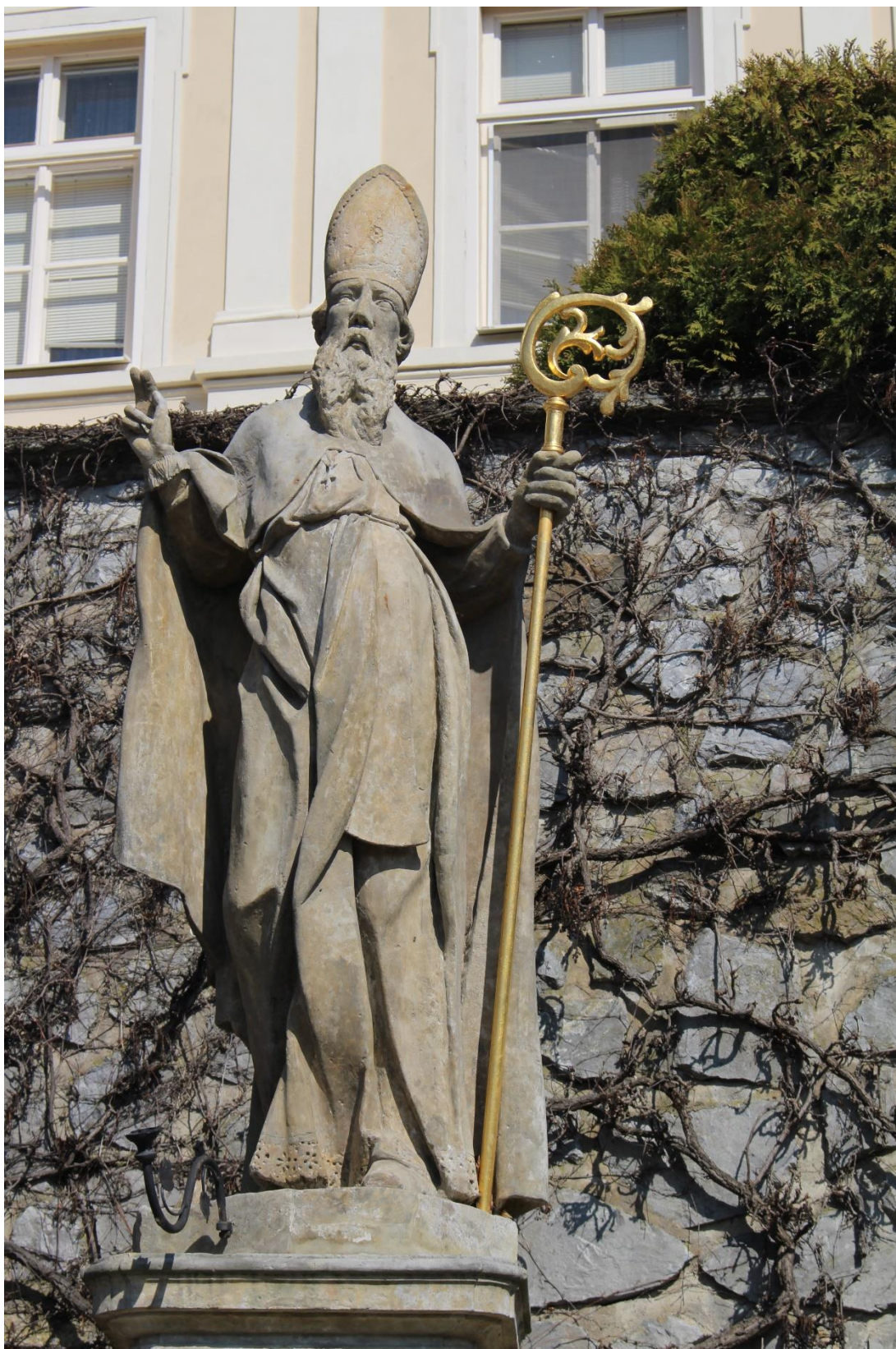
Příloha č. 18. Socha sv. Liboria z roku 1736, která je umístěná pod terasou zámku v Jesenci, vpravo od zámeckých schodů.