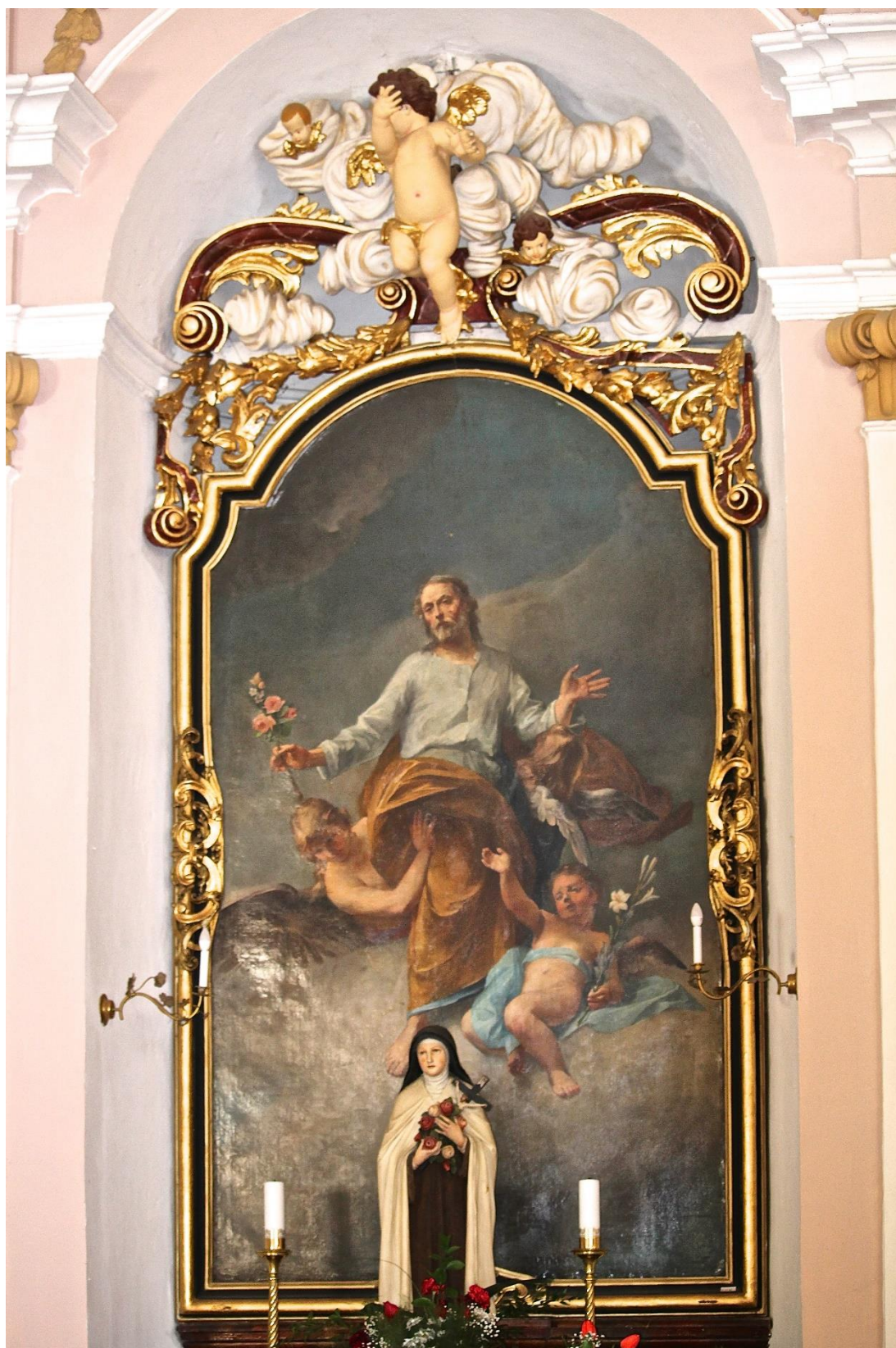
Příloha č. 13. Oltářní obraz sv. Josefa a socha sv. Terezie z Lisieux na bočním oltáři v kostele sv. Liboria v Jesenci.