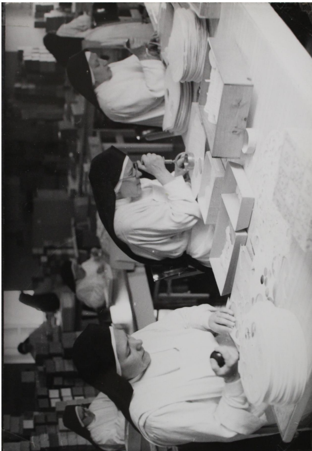
Příloha č. 35. Sestry dominikánky při výrobě hostií v Broumově.