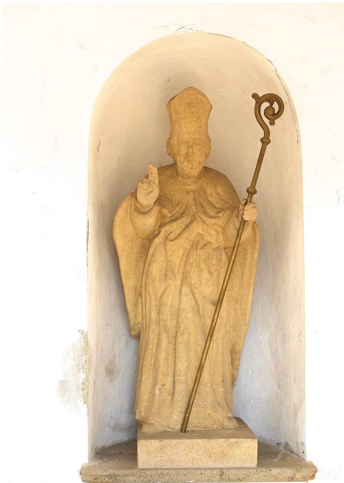
Příloha č. 20. Socha sv. Liboria, kterou nechala zhotovit paní Zuzana Kateřina do poutní kaple sv. Liboria.