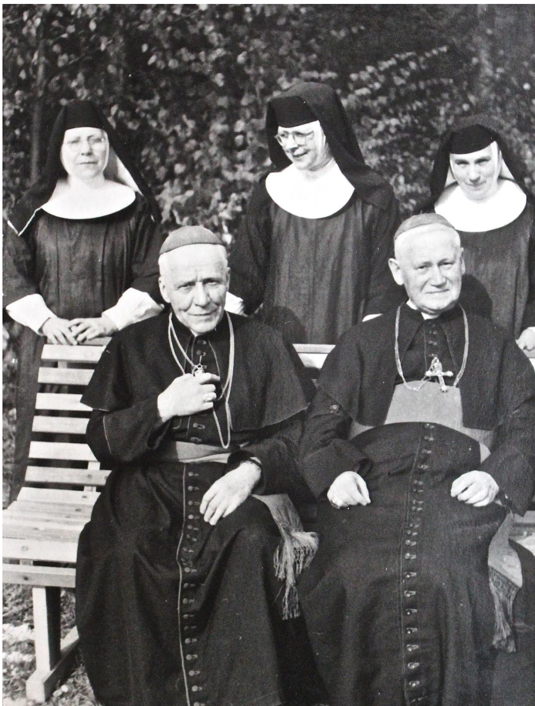
Příloha č. 31. Sestry dominikánky v Bohosudově s tehdejšími arcibiskupem pražským Josefem Beranem a biskupem Františkem Tomáškem.