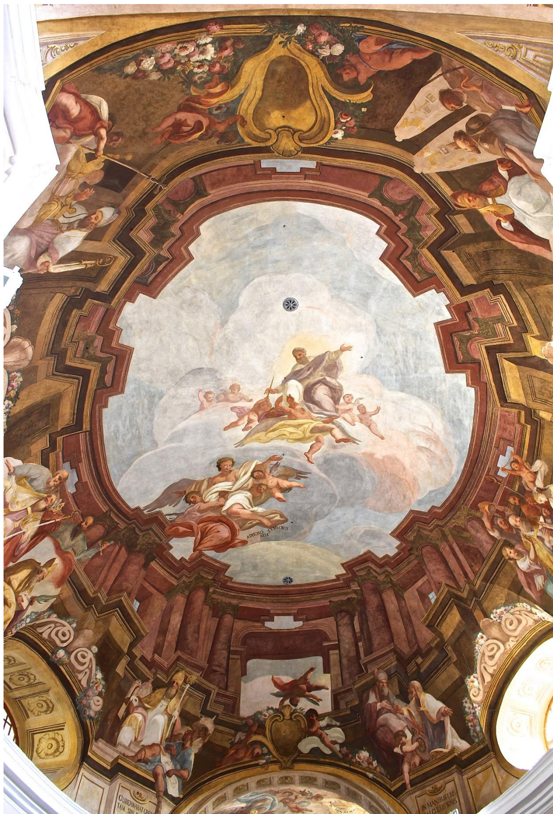
Příloha č. 5. Jan Michael Fissé (připsáno), Duše přijímaná Bohem a šest scén se sv. Liborem, kolem roku 1714. Freska na klenbě lodi v kostele sv. Liboria v Jesenci.