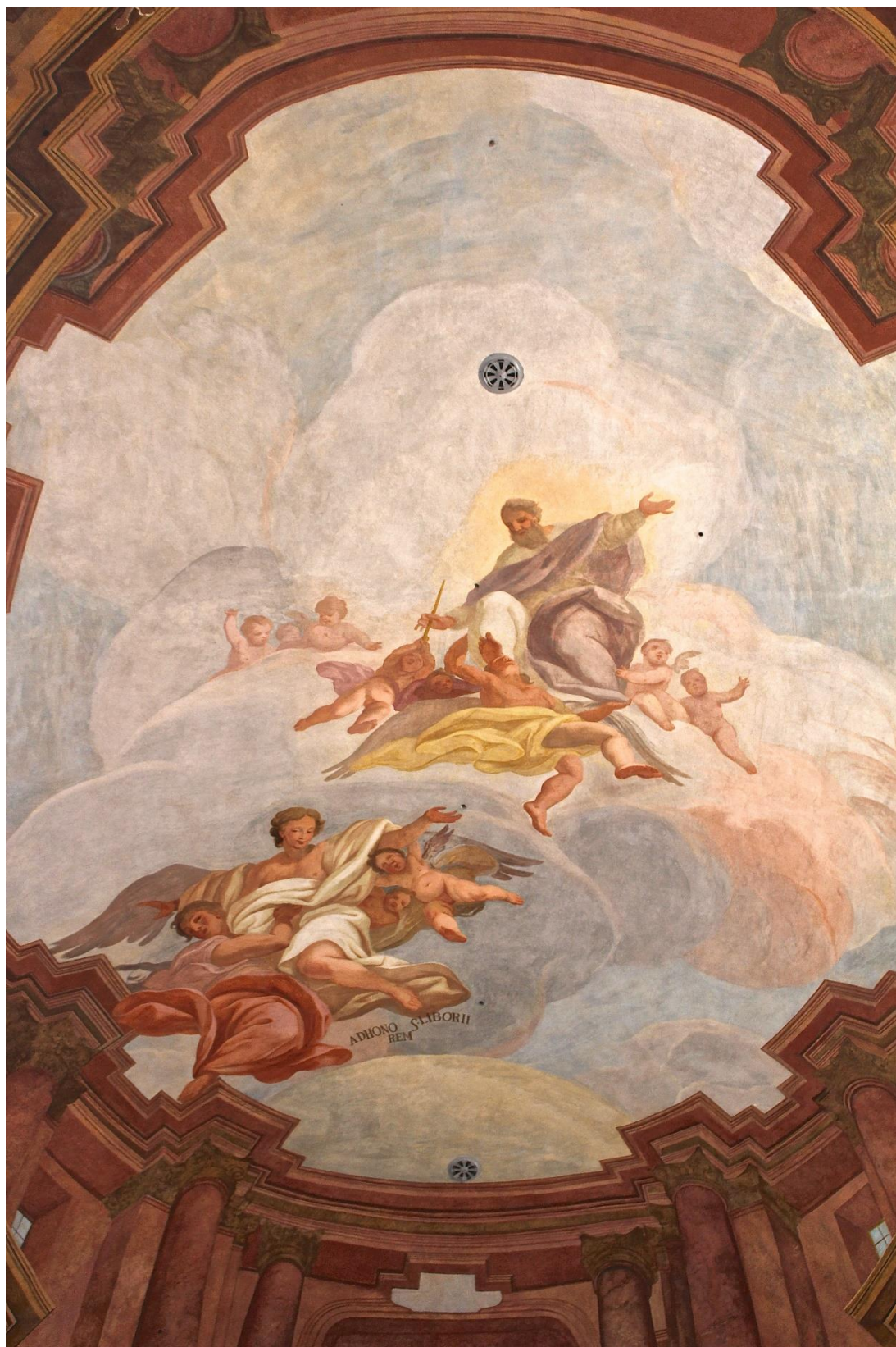
Příloha č. 6. Jan Michael Fissé (připsáno), Očištěná duše, bíle oděná, putuje k Bohu Otci, nesenému anděly , kolem r. 1714. Detail fresky v kostele sv. Liboria v Jesenci.