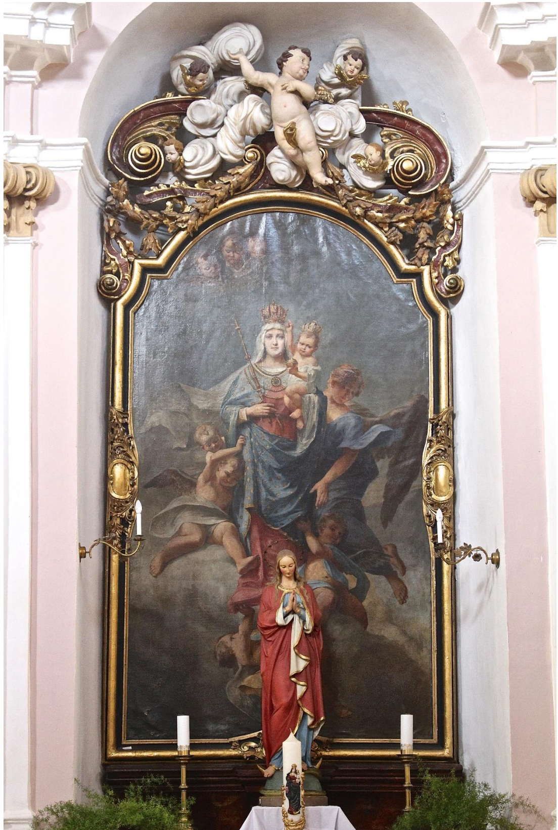
Příloha č. 12. Oltářní obraz Panny Marie Křtinské a socha Panny Marie Pomocnice v kostele sv. Liboria v Jesenci.