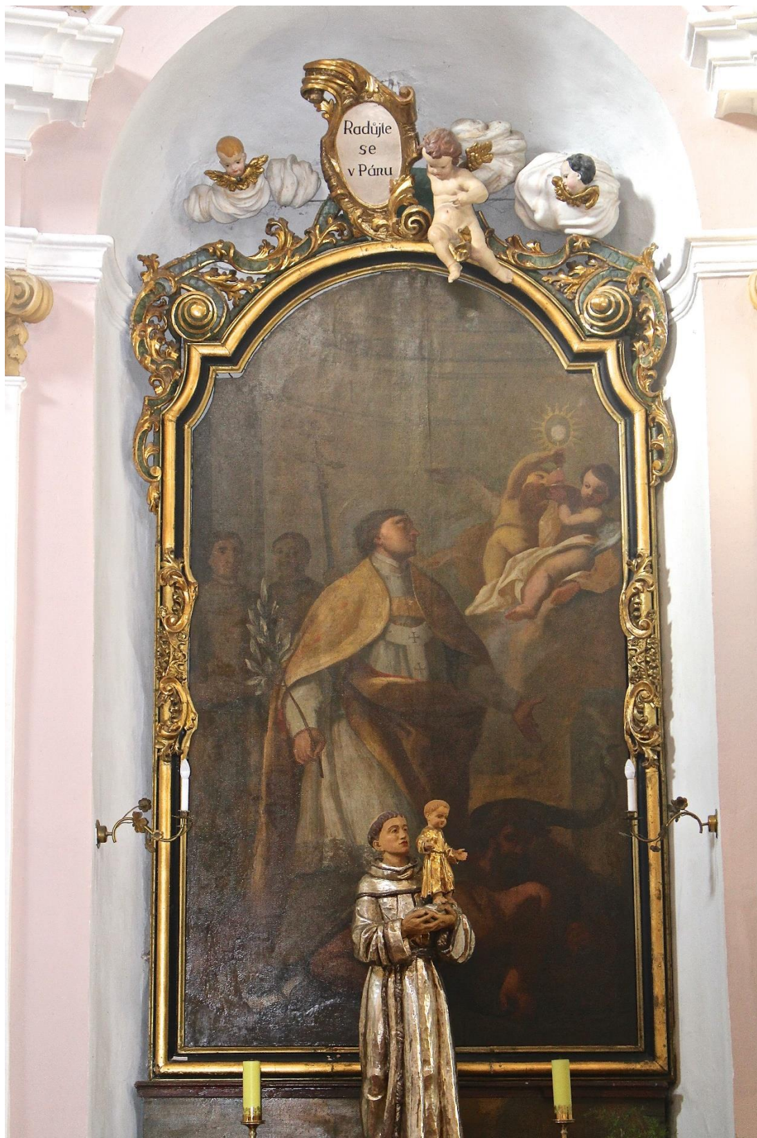
Příloha č. 15. Oltářní obraz sv. Norberta a sousoší sv. Antonína Paduánského s Ježíškem na bočním oltáři v kostele sv. Liboria v Jesenci.