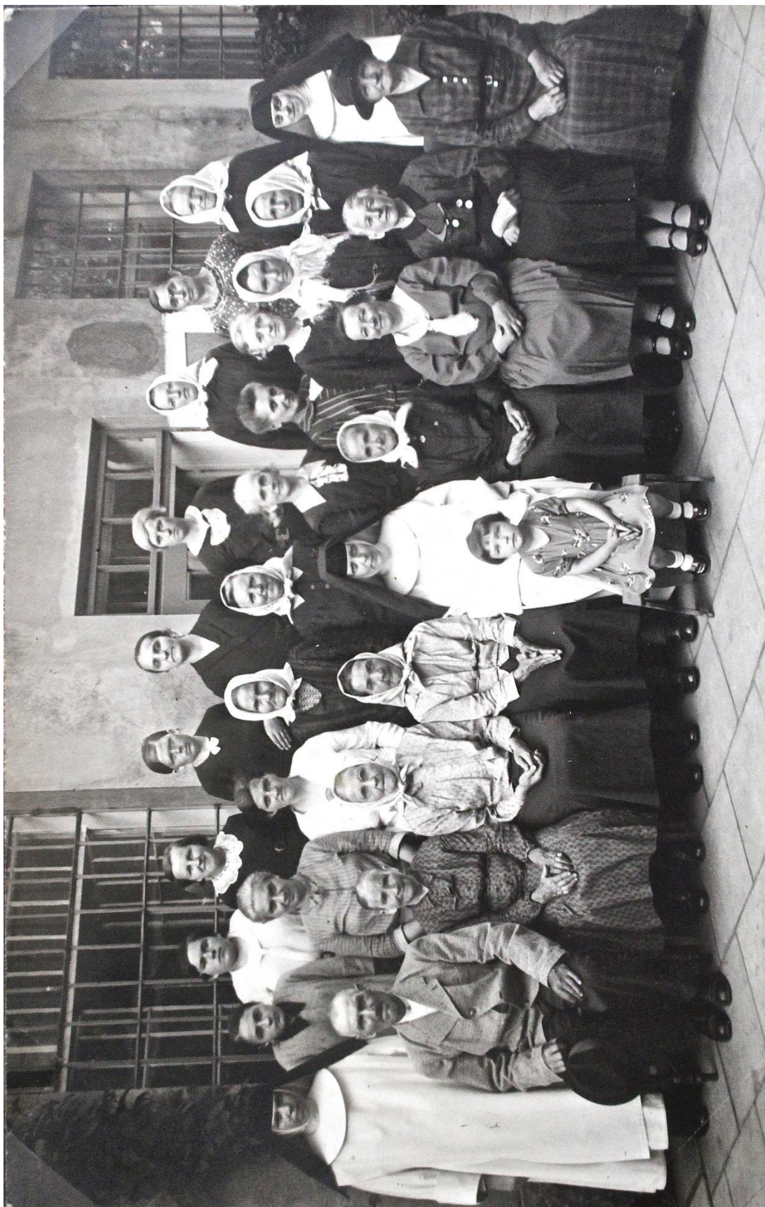
Příloha č. 25. Chovanci Zaopatřovacího ústavu sv. Liboria v Jesenci. Archiv České kongregace sester dominikánek v Brně , sign. F6, Fotoalbum Jesenec, Řepčín, Olomouc.