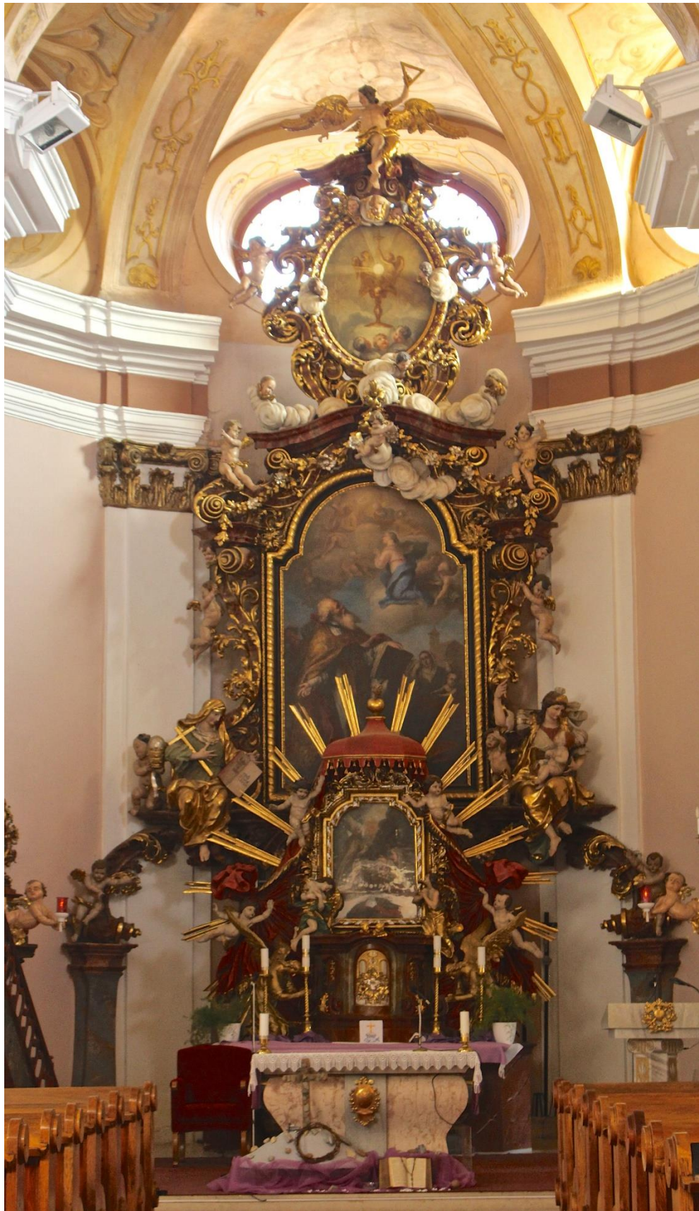
Příloha č. 11. Barokní oltář v kostele sv. Liboria v Jesenci.