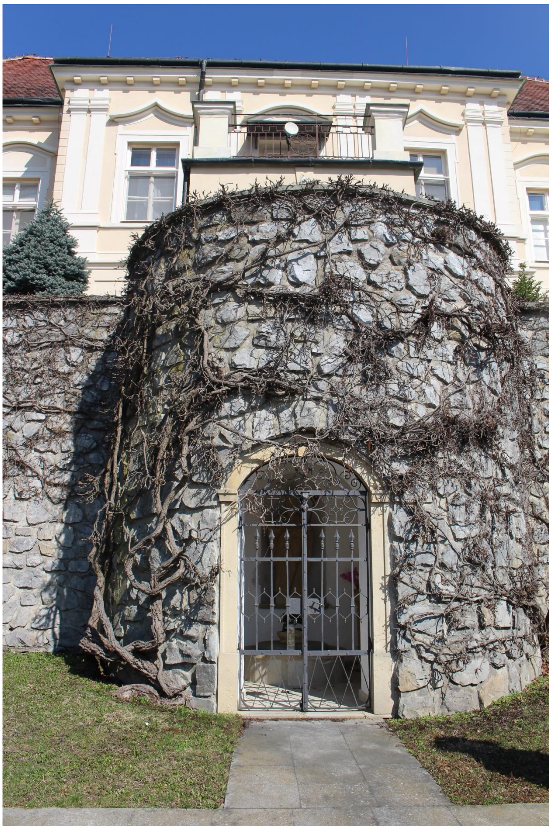
Příloha č. 19. Vodní kaple sv. Liboria vybudovaná v terase zámku mezi rameny zámeckého schodiště. Kaple stojí na místě původní poutní votivní kaple z roku 1673, vybudované Zuzanou Kateřinou na poděkování za uzdravení.