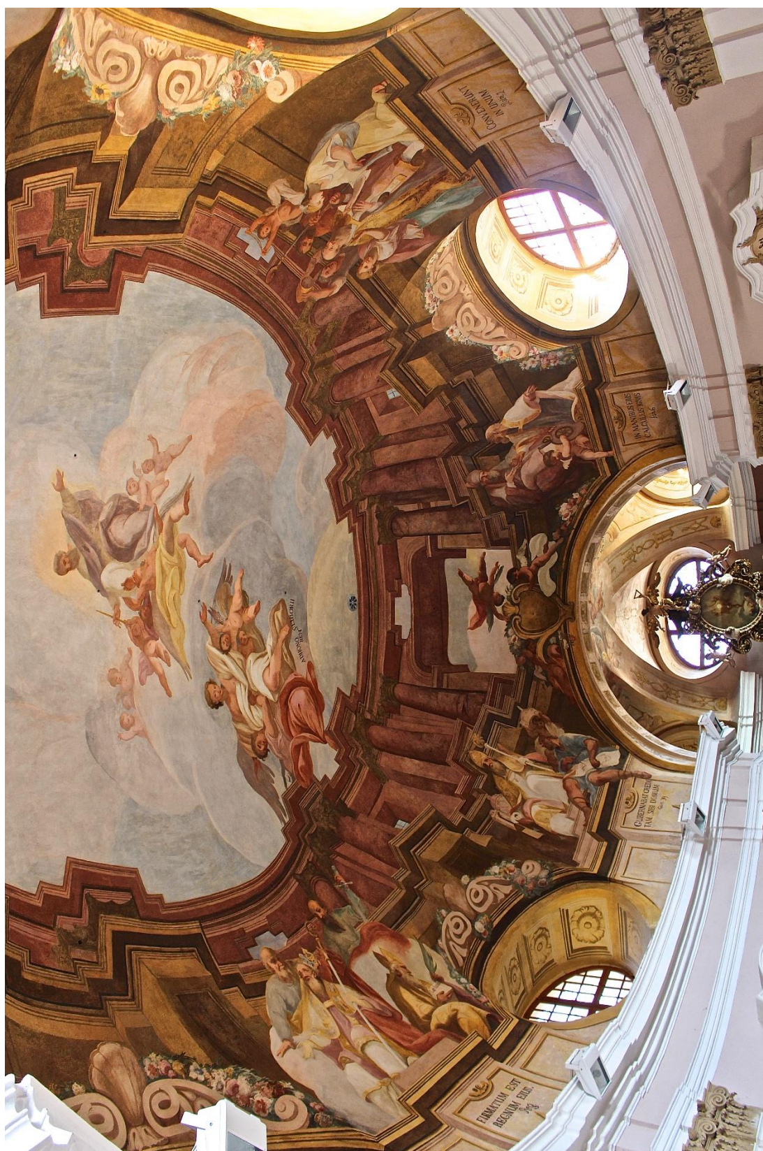
Příloha č. 4. Část nástropní fresky v přední části lodi v kostele sv. Libnoria v Jesenci.