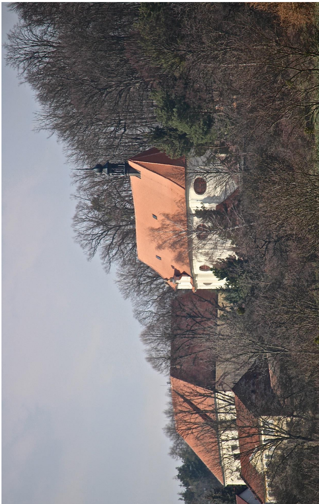
Příloha č. 1. Zámek a kostel sv. Liboria v Jesení z jihovýchodní strany.