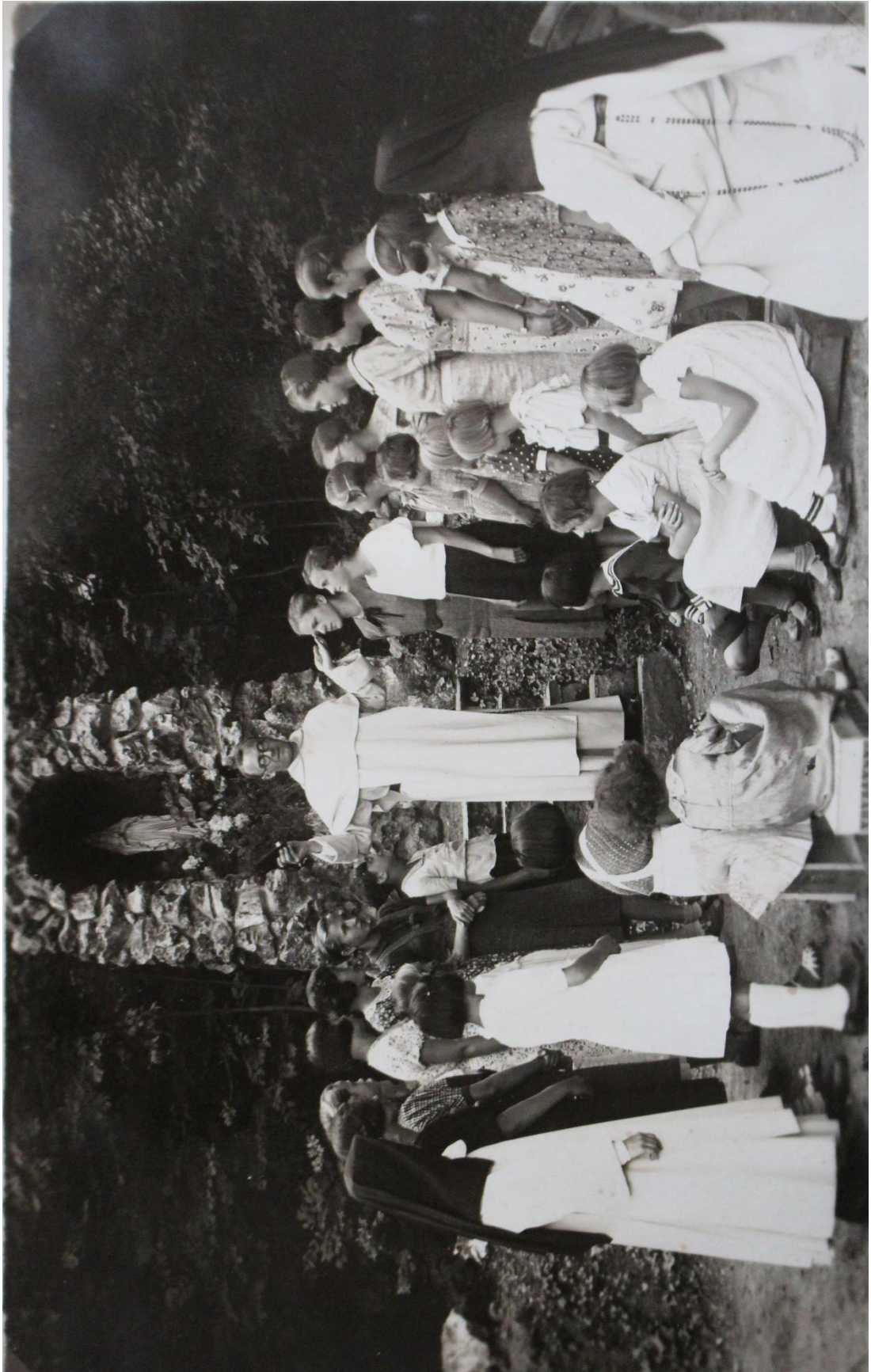
Příloha č. 24. Dívky na kurzu pro kuchařky a hospodyně v Jesenci. Archiv České kongregace sester dominikánek v Brně, sign. F6, Fotoalbum Jesenec, Řepčín, Olomouc.