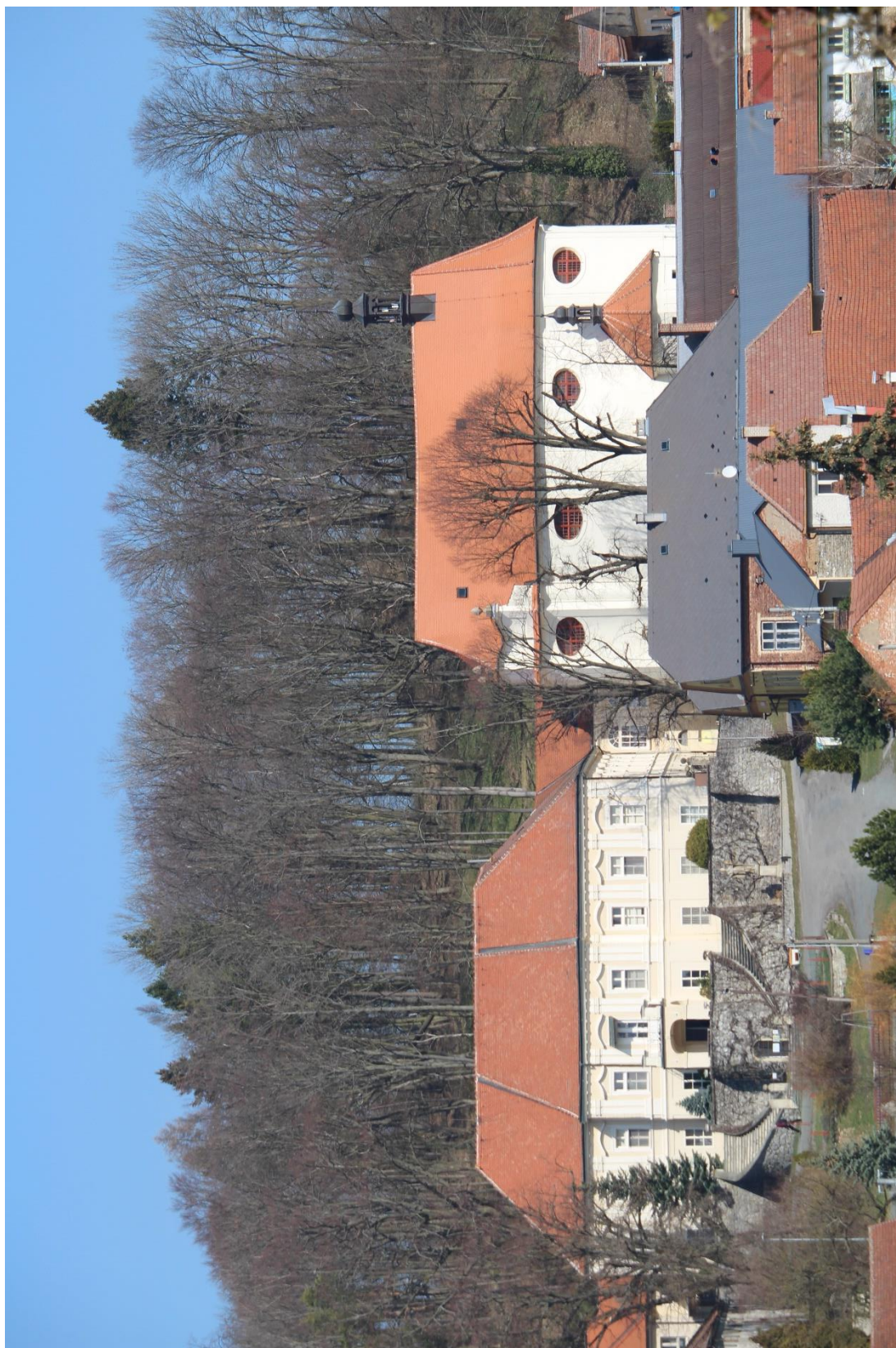
Příloha č. 2. Zámek a kostel sv. Liboria v Jesenci, pohled z jižní strany, z místní části Měrotín.