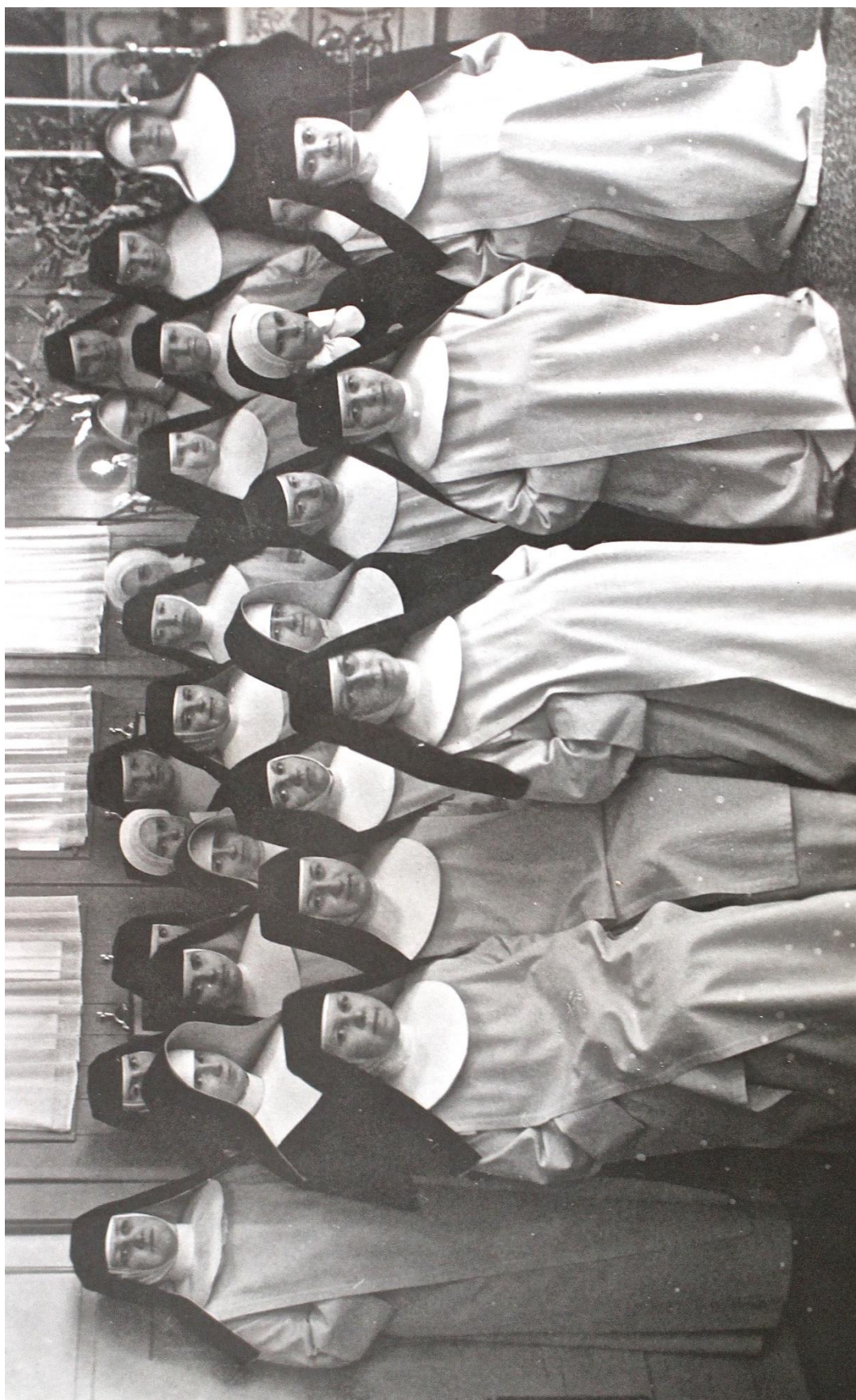
Příloha č. 32. Sestry dominikánky v Bohosudově. Archiv České kongregace sester dominikánek v Brně , sign. F28, Fotoalbum Bohosudov.