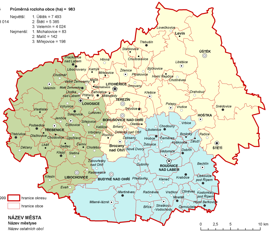
Obrázek 2: Administrativní rozdělení okresu Litoměřice

● NÁZEV MĚSTA ● NÁZEV MĚSTYSCE ● NÁZEV OSTATNÍCH OBČÍ