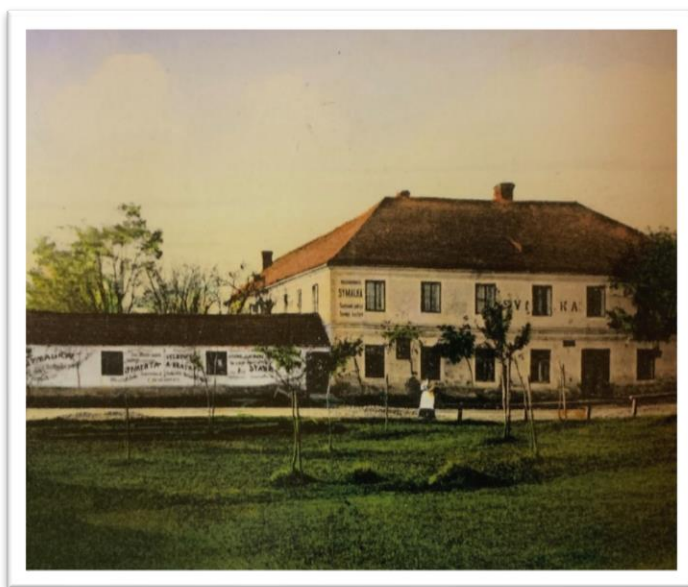
Obrázek 11. Hostinec Sýmalka, který byl postaven záměrně poblíž nové železniční stanice. Později se stal hojně navštěvovaným místem tělovýchovných organizací a základní škola zde měla řadu let tělocvičnu. Obrázek je pořízen v době před I. světovou válkou. Fotografie převzata z knihy Hlušítková, M. (2018). Borovany tehdy a dnes . Borovany: Město Borovany.

Tato sportovní organizace v Borovanech fungovala v letech 1926 až 1936. Všechna sportovní odvětví byla organizována pouze amatérsky. Nejvýznamnější částí spolku byl oddíl kopané, který se později registroval do soutěže. 44