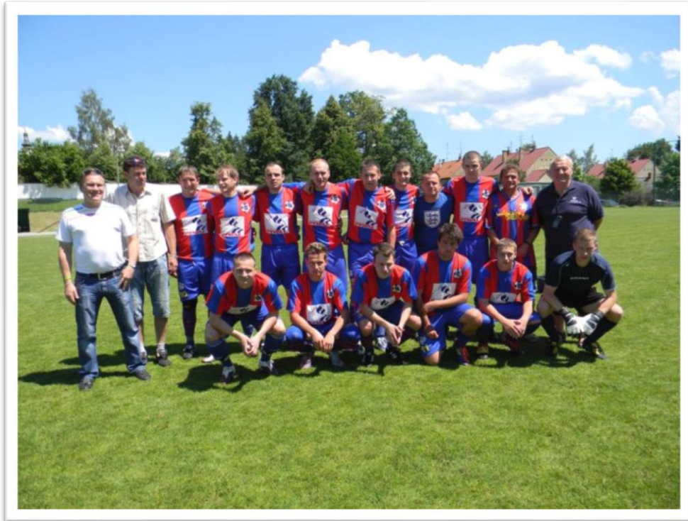
Obrázek 21. Družstvo mužů, které od roku 2010 postupně postoupilo až do I.A třídy, což je nevyšší soutěž, která se kdy v Borovanech hrála v seniorské kategorii. V této soutěži tým hrál dvě sezony.

v sezoně 2012/2013 hrálo opět III. třídu. V té hrál tým až do svého zrušení pro nedostatek hráčů v roce 2015. Opětovně byl tým založen v roce 2018 a nyní hraje IV. třídu.