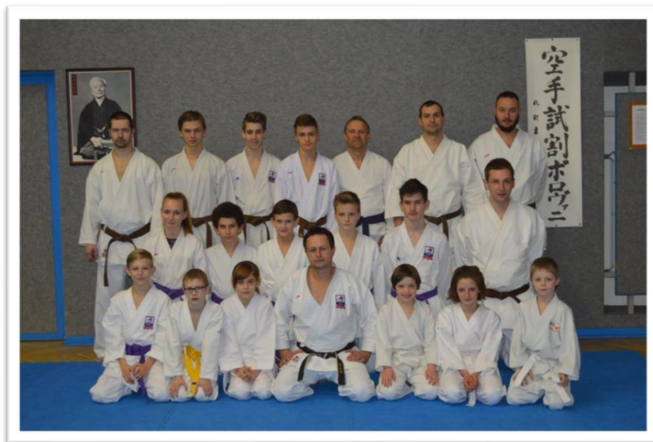
Obrázek 24. Fotografie borovanského oddílu karate Tameshi-wari, pořízena při společném focení v roce 2016.