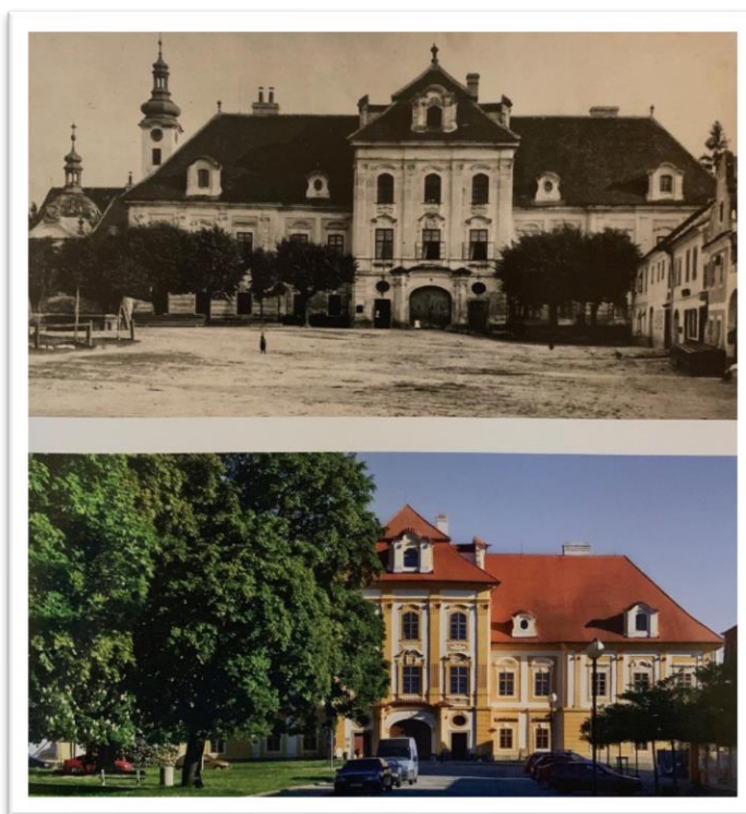
Obrázek 1. První fotografie zachycuje prelaturu augustiniánského kláštera v roce 1768. Na druhé fotografii je podoba náměstí v roce 2013.

V této době byl největším obecním problémem nedostatek vody. Vyřešen byl stavbou dvoukilometrového vodovodu, který byl přiveden ze studně u pramenů radostického potoka pod lesem Na Vápencích. V obci se vodovod rozváděl do kašen. Bylo nutné provádět neustálou údržbu, avšak vydržel až do 30. let dvacátého století. 6