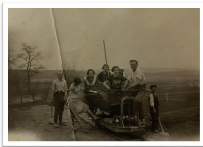
Obrázek 12. Na fotografii jsou zachyceni členové brigády při výstavbě prvního sokolského cvičiště v roce 1922.