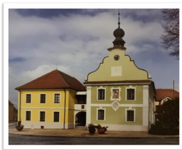
Obrázek 3. Původní barokní objekt se sousedním domem v současnosti tvoří Městský úřad v Borovanech.

V důsledku nárůstu obyvatel byla snaha vystavit vyhovující novou školu. Po několikaletém snažení se to povedlo až v roce 1997, kdy byl vystaven nový školní areál, situovaný západně od zámku, jenž byl poté mezi lety 2005 až 2010 postupně přebudován na knihovnu, infocentrum a různé výstavní prostory. 15