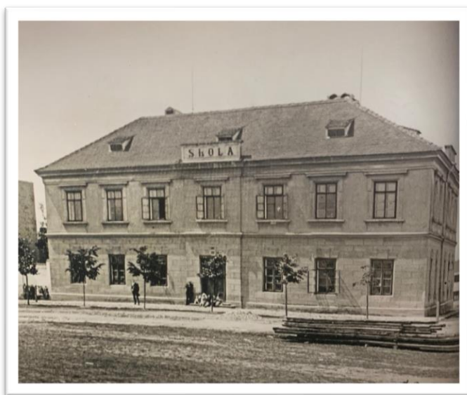
Obrázek 2. Nová budova obecné školy na Horním náměstí, která byla otevřena roku 1887.

hospodaření byl klášter a jeho majetek velmi zadlužen a téměř zpusťošen, ačkoli měl zpočátku za hospodářského úředníka velmi schopného Jakuba Krčína z Jelčan. Vilém tedy roku 1564 klášter zrušil a Borovany připojil ke svému panství. To bylo také důvodem k vytvoření samostatné správy, která zde začala intenzivněji hospodařit. V té době Borovany dostaly statut městečka a svůj znak. Byl zde také zahájen provoz pivovaru. Po smrti Viléma převzal majetek jeho mladší bratr Petr Vok z Rožmberka. Ten zemřel roku 1611 a následně se Borovany staly majetkem Švamberků. Ti o veškerý majetek přišli kvůli účasti na stavovském povstání. Na počátku třicetileté války byly Borovany i klášter vypáleny a zdevastovány armádou. 7