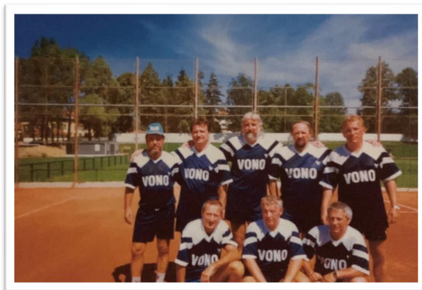
Obrázek 16. Nohejbalový oddíl zachycen na nohejbalové hřišti v Borovanech. Oddíl vznikl v roce 1983 a hřiště bylo vybudováno v roce 1986.