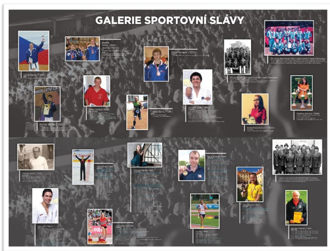
Obrázek 26. Podoba dvou panelů, na kterých jsou zobrazeni nejúspěšnější sportovci Borovany. Tyto panely jsou umístěny v chodbě u tělocvičny ZŠ Borovany.

Závodnice v jóga sportu. Na MČR v juniorech v roce 2015 získala druhé místo, na ME v Praze skončila čtvrtá a byla nominována na MS v Indii, kterého se neúčastnila. Na MČR v roce 2016 získala druhé místo a opět nominaci na MS, tentokrát v Itálii. Na tomto MS získala páté místo.