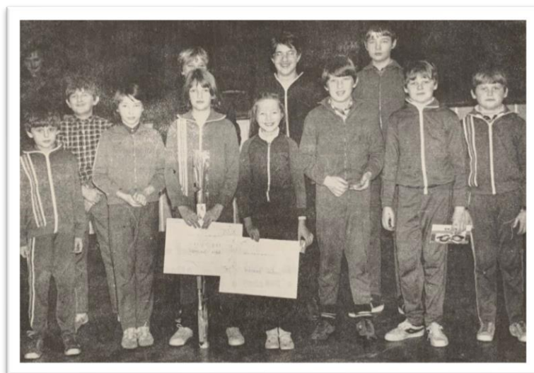
Obrázek 19. Oddíl mladých rybářů na soutěži v rybolovné technice. Jedná se o devátý ročník Velké ceny Borovan. Fotografie převzata z měsíčníku Palcát, Borovany: Městský národní výbor Borovany, 1973. Ročník 1986. č. 5.