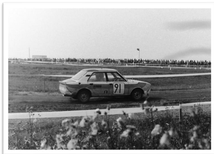
Obrázek 18. Fotografie z roku 1986, což byla jedna z prvních sezon motoristického sportu v Borovanech. Na fotografii je také zachycena velká účast diváků. V první etapě závodů Borovanská strouha jich chodívalo pravidelně kolem 4000.