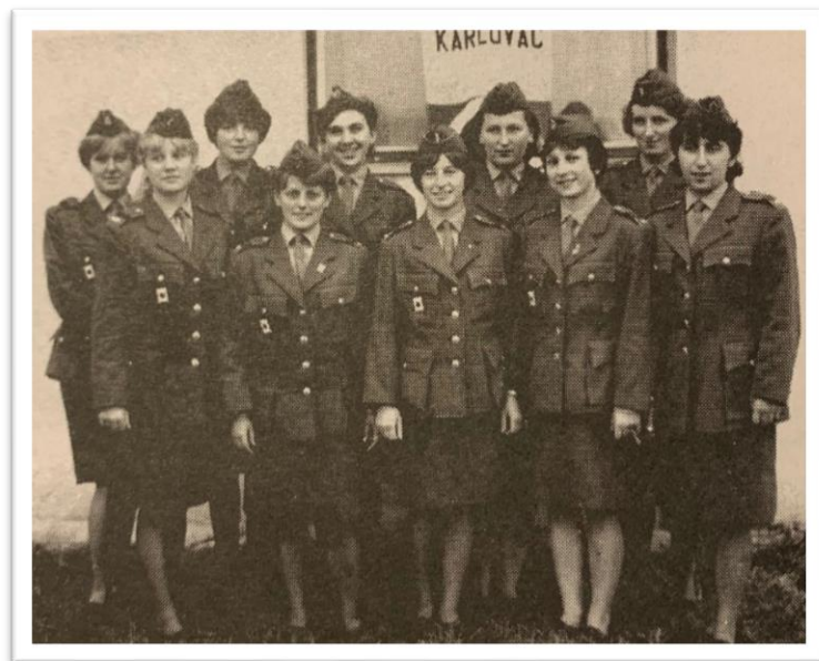
Obrázek 17. Družstvo žen ze Sboru dobrovolných hasičů Borovany, které se účastnilo v roce 1966 mezinárodní soutěže v jugoslávském Karlovaci. Ženy zde vybojovali druhé místo v konkurenci osmdesáti sedmi mužských týmů.

Jelikož byly na příslušníky často kladeny velké fyzické i psychické nároky, začínala se objevovat všestranná příprava hasičských sborů. V 50. letech minulého století se tak začal rozvíjet i hasičský sport. Vznikaly nové disciplíny, které vycházely z prvků hasičského nácviku, a závodilo se především na čas. Sport se začal velmi rozvíjet a hasičské ústředí začalo vydávat první propozice, které byly postupem času upřesňovány až do dnešní podoby. Soutěže probíhaly v rámci okresů, krajů a následně v rámci celé republiky. 80