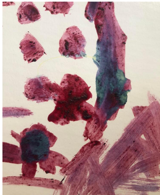
Obrázek 3: Výsledek činnosti „Borůvkovi návrháři“