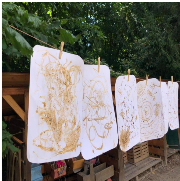
Obrázek 9: Výsledek činnosti „Malování hlinou“