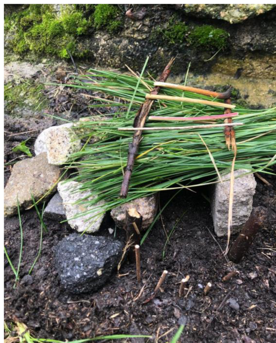
Obrázek 6: Výsledek činnosti „Stavba z kamene“