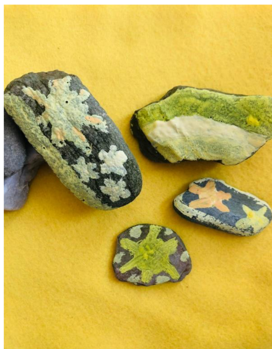
Obrázek 10: Výsledky činnosti „Talisman“