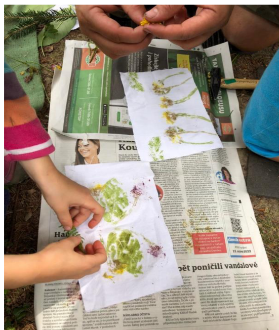
Obrázek 5: Výsledek činnosti „Vytloukávaná batika“