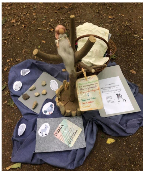
Obrázek 7: Ranní kruh šedý