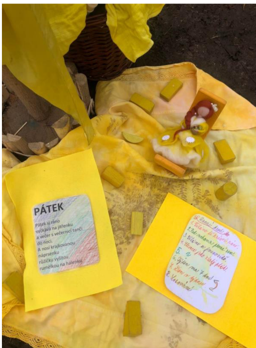
Obrázek 11: Ranní kruh žlutý