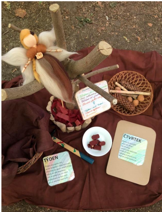
Obrázek 8: Ranní kruh hnědý