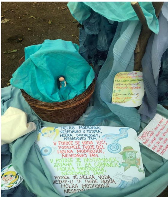
Obrázek 2: Ranní kruh modrý