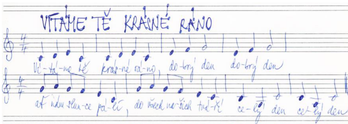
Obrázek 1: Píseň „ Vítáme tě krásné ráno “

říkanka: „ Pod nohama pevná zem, nad hlavou jasné nebe, rukama tvořím tento den a v srdci mám slunce tebe. “