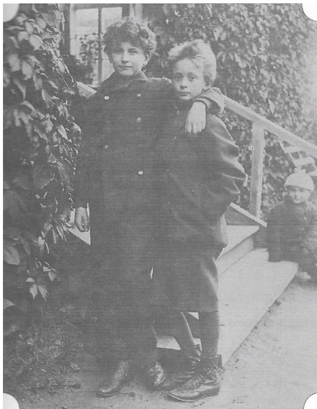
Образек ч. 5 N. S. Trubeckoj s bratrem Vladimirem

Dostupné z: Ермишина, К. Б. (2015). Князь Н. С. Трубецкой. Жизнь и труды. Москва: Синаксис