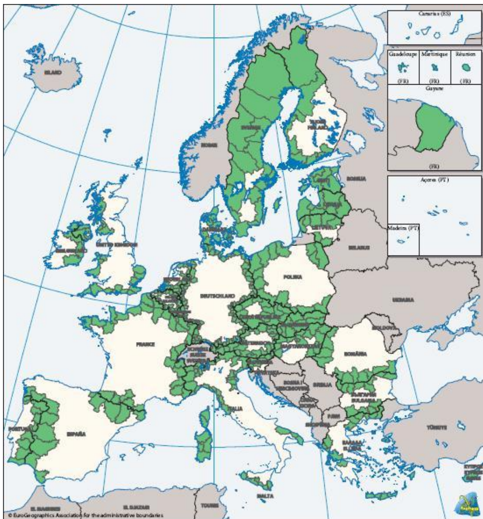
Obrázek 3: Regiony přeshraniční spolupráce Cíle 3