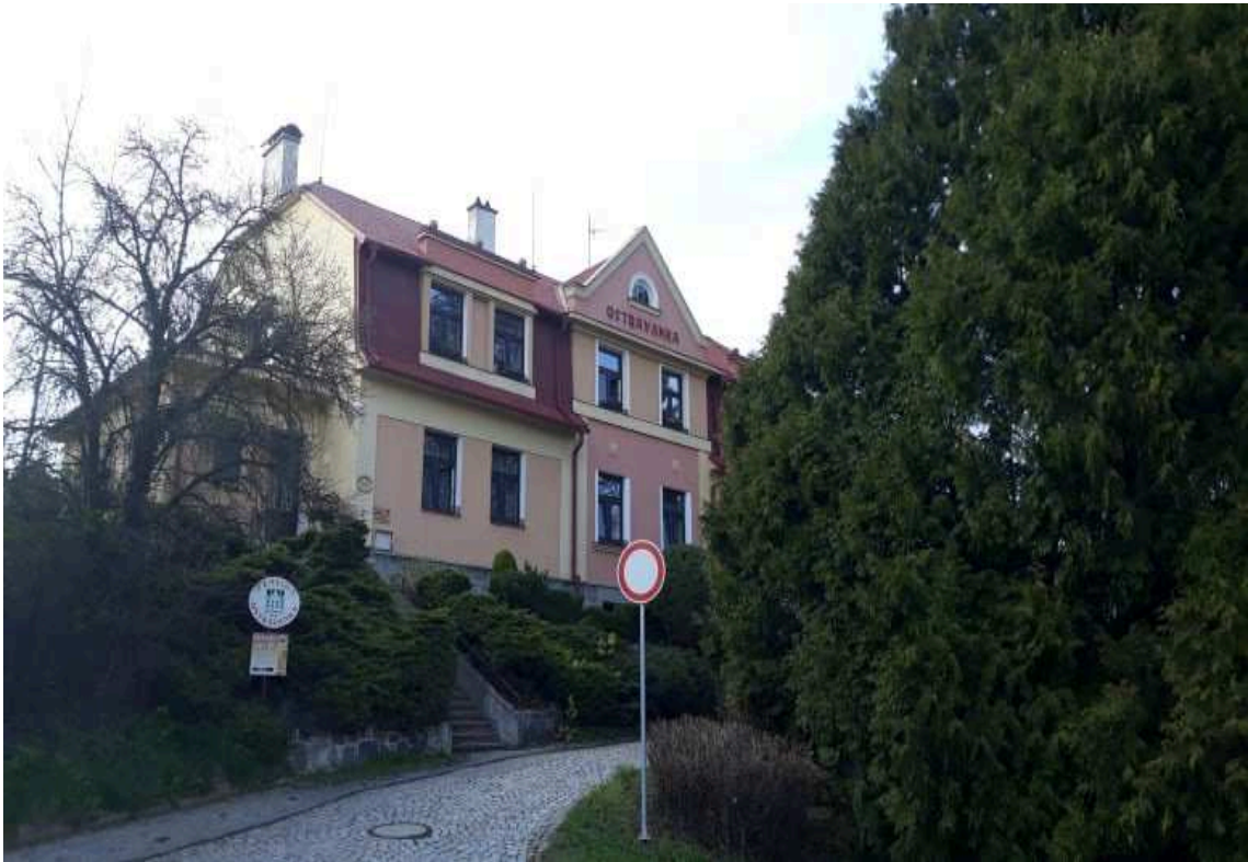
Obr. 3.3 Penzion Ostravanka