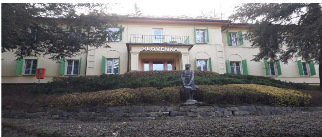
Obr. 2.7 Lázeňský dům Slovenka

Sanatorium, viz obr. 2.7 bylo vybudováno v roce 1925 v kombinaci neoempíru a art-déco podle projektu J. Svobody. Je umístěný v blízkosti lázeňské kolonády lemující řeku Bečvu. V roce 2008 proběhla rekonstrukce a sanatorium bylo propojeno s lázeňským domem Bečva spojovacím koridorem. [30]