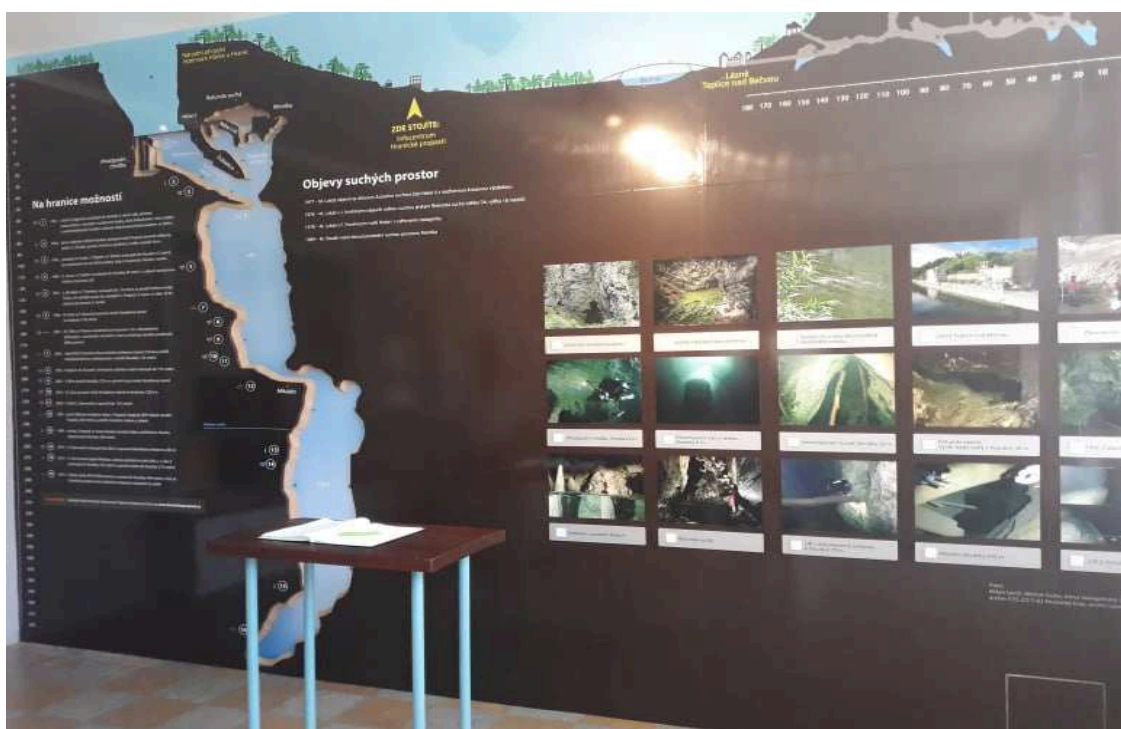
Obr. 2.2 Infocentrum hranické propasti

Infocentrum se nově vybuďovalo ve funkcionalistické budově z roku 1939. Tato budova je zároveň kulturní památkou a nese velký význam železniční architektury z 1. poloviny 20. století. Nyní je celková budova ve špatném stavu a město Hranice projednává se Správou železničních a dopravních cest další opravy. Následující obrázek ukazuje objevy v Hranické propasti, viz obr. 2.2. [31]