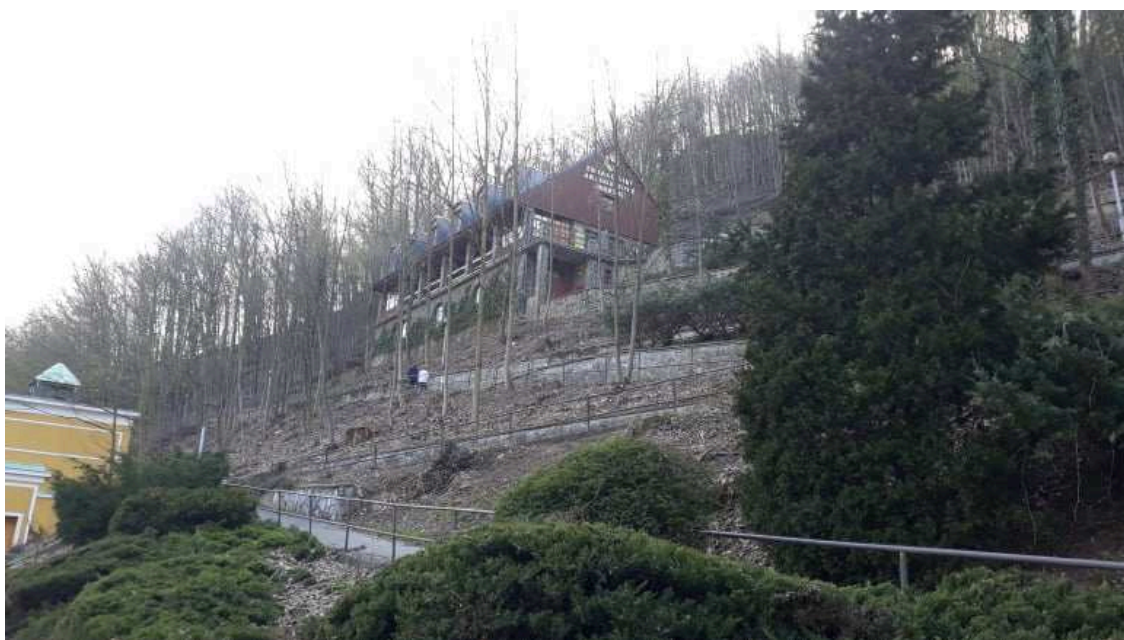
Obr. 2.1 Zbrašovské aragonitové jeskyně