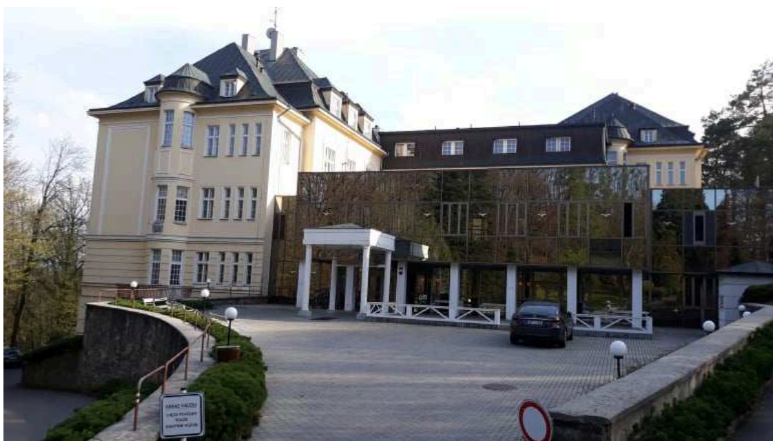
Obr. 2.5 Lázeňský dům Moravan