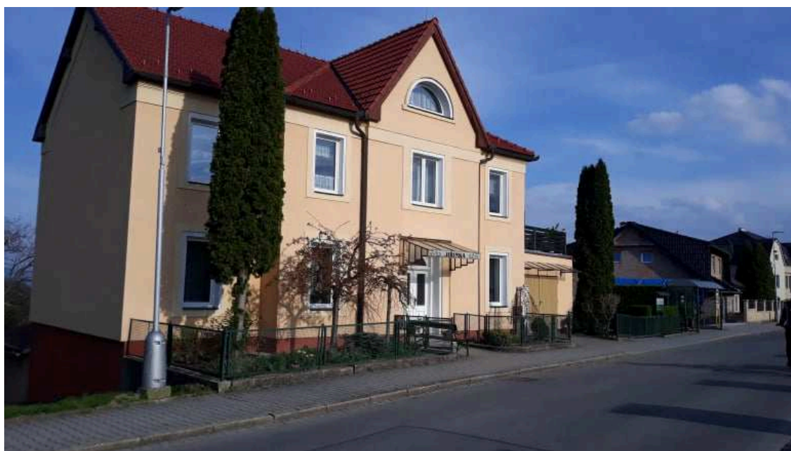
Obr. 3.2 Penzion Jiřinka