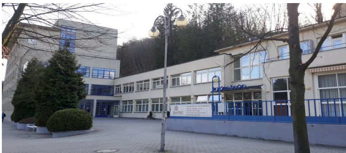
Obr. 2.6 Lázeňský dům Bečva