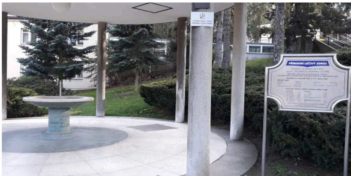
Obr. 2.3 Přírodní léčivý zdroj

Na obrázku níže je pavilón Gallašova pramene, viz obr. 2.3.