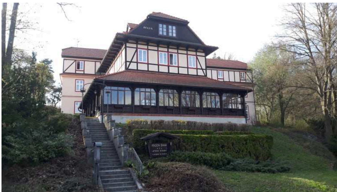
Obr. 3.1 Penzion Diana