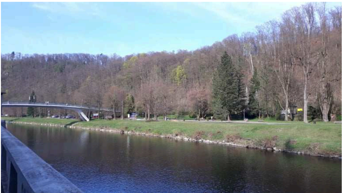
Obr. 2.4 Lázeňský park

Pohled na lázeňský park a řeku Bečvu z lázeňské kolonády, viz obr. 2.4.