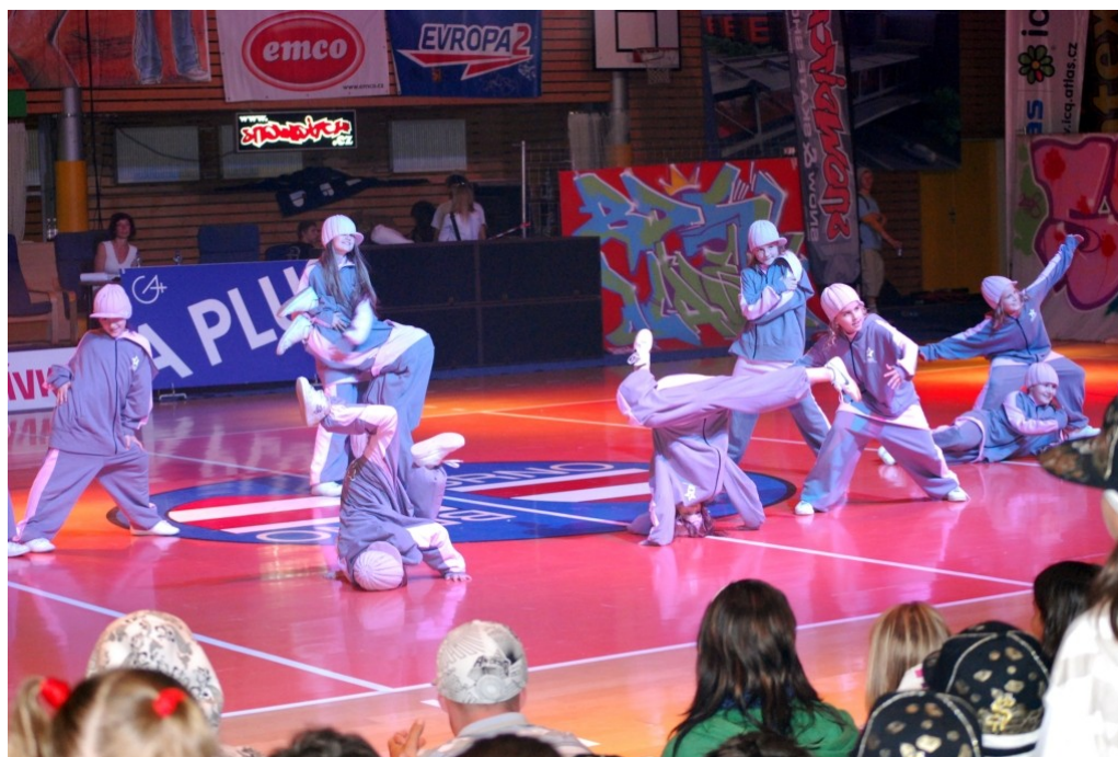
Obrázek 7. Sestava „TIME“, Mistrovství České republiky Hip hop formací 7.6.2008 Brno