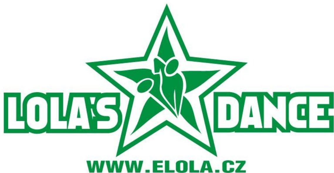
Obrázek 1. Logo taneční školy LOLA'S DANCE