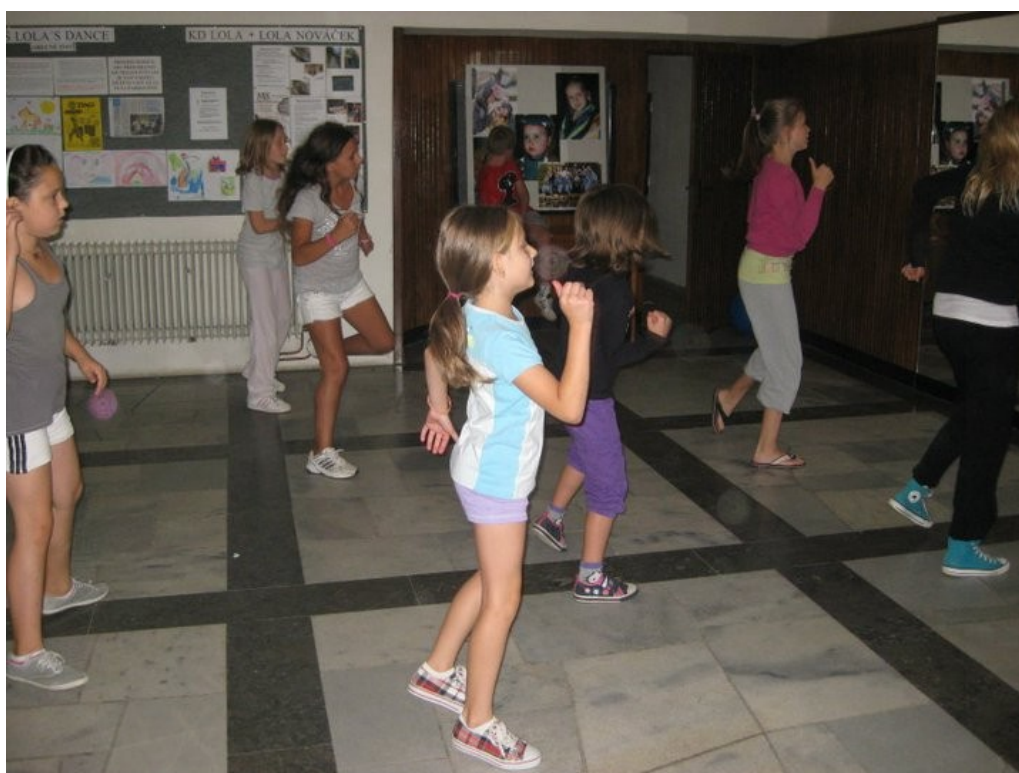
Obrázek 4. Trénink ve vestibulu kulturního domu