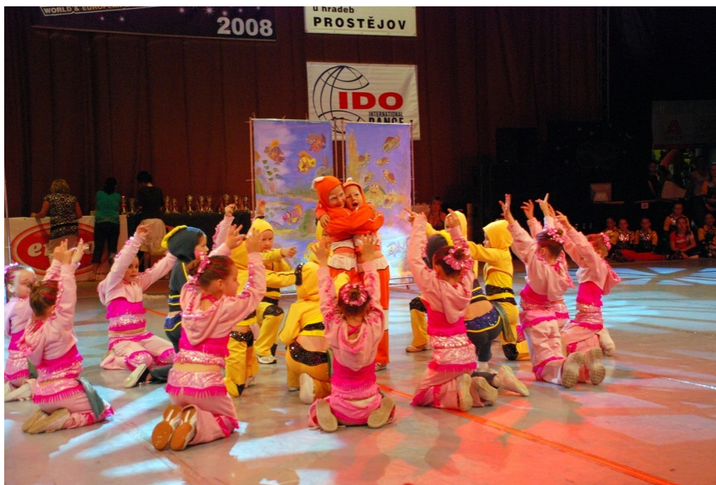
Obrázek 6. Sestava „KDO ŽE SE TO HLEDÁ?“, Mistrovství České republiky DVK formací 30.5.2008 Prostějov