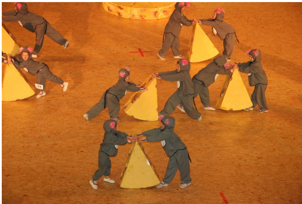
Obrázek 5. Sestava „V SÝRU NAJDEŠ SÍLU“, Mistrovství Moravy formací 29.-30.4.2006 Ostrava