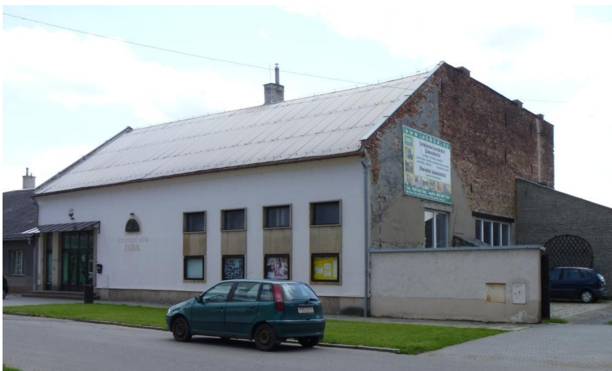
Obrázek 8. Kulturní dům Lola