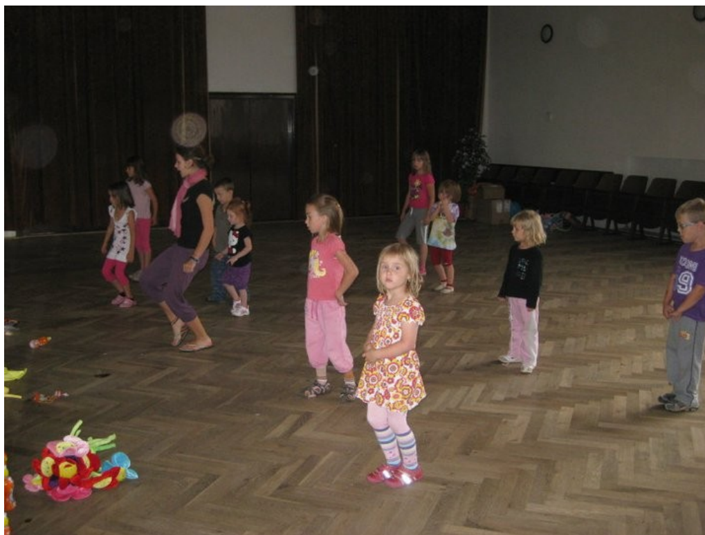
Obrázek 3. Trénink ve velkém sále