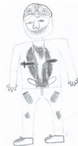
Obr. 2. Záznam průběhu testování chlapce z první skupiny (Dominika Bočanová, Agresivní tendence v kresbě dětí mladšího školního věku, 2017)

Záznam průběhu testování chlapce z druhé skupiny: