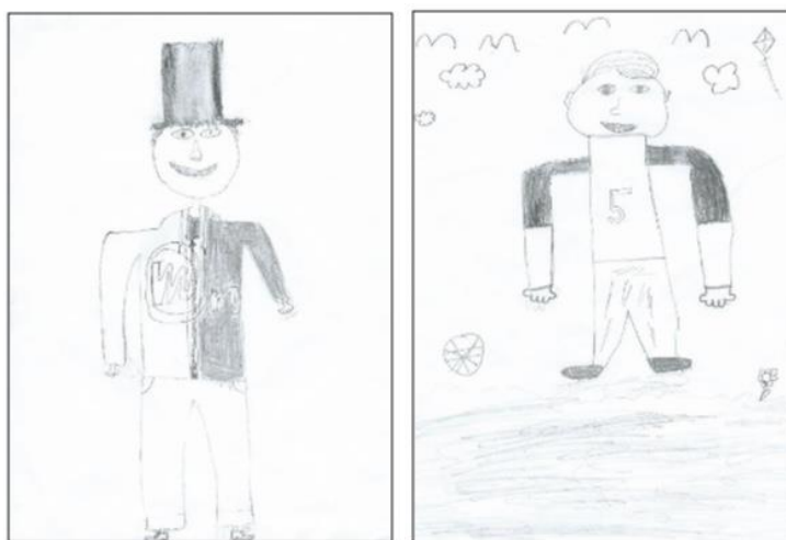
Obr. č. 5 – příklady vyobrazení kresby postavy (Dominika Bočanová, Agresivní tendence v kresbě dětí mladšího školního věku, 2017)

Autorka díky tomuto testu a srovnání, zjistila, jaký je rozdíl mezi kresbami chlapců mladšího školního věku s agresivními sklony a těch, kteří nemají agresivní sklony nebo mají menší míru agrese. Autorka provedla průzkum, který ukázal rozdíly v zobrazení těla. Chlapci s agresivními sklony nakreslili tělo s hranatými liniemi, což může být interpretováno jako projev agresivity. V druhé skupině chlapců se u žádného z nich nevyskytl tento znak. Autorka objevila další rozdíl při zobrazení ramen, když chlapci s agresivními sklony měli ramena s výraznými hranatými liniemi. Tento jev může být znovu interpretován jako tendence k agresivitě. V kolektivu chlapců, kteří nevykazují agresivní chování, nebyla nalezena žádná kresba s ostrými liniemi, pouze s kulatými.