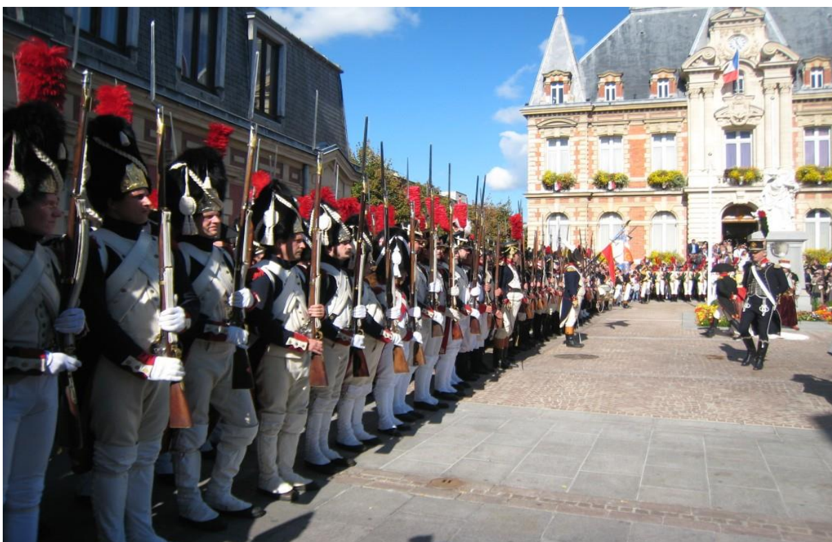
Dole: Malmaison, 2012