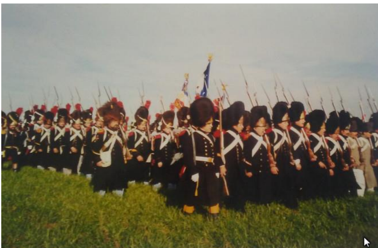
Dole: GIA v Lipsku roku 2003