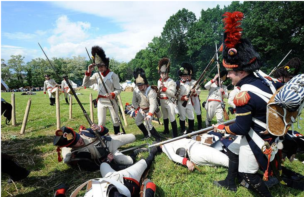
Dole: „Matrix“ v bitevní ukázce Schallaburg, 2009