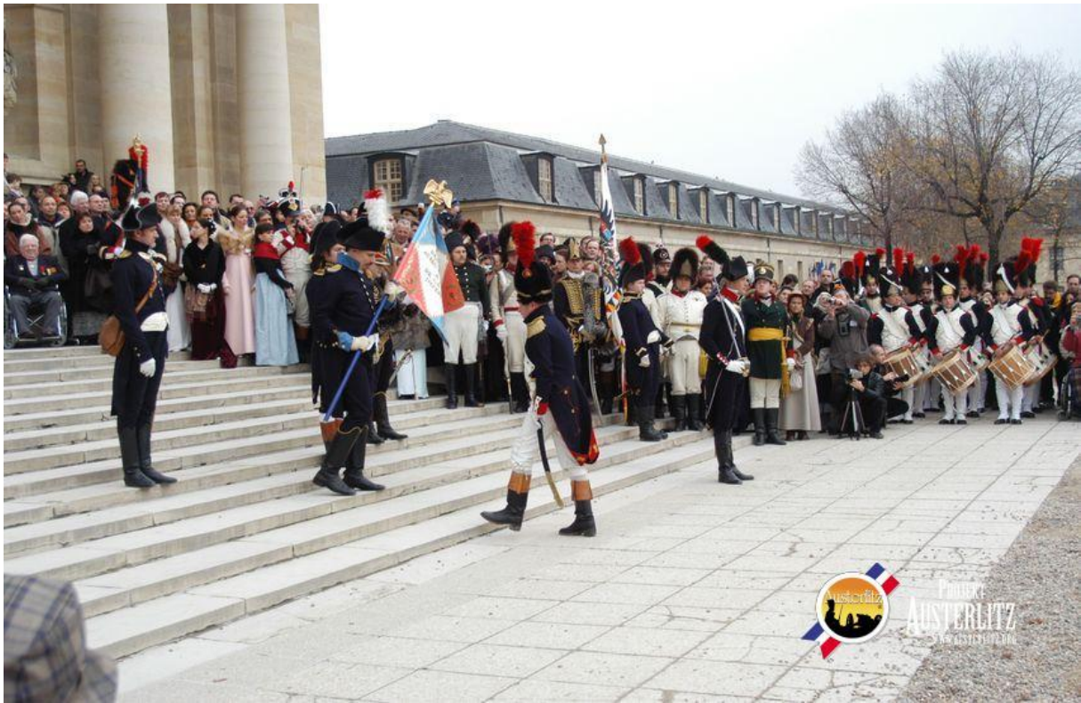
Nahoře: Předávání praporů, 2004 Dole: Členové GIA, rekonstrukce bitvy u Slavkova 2005