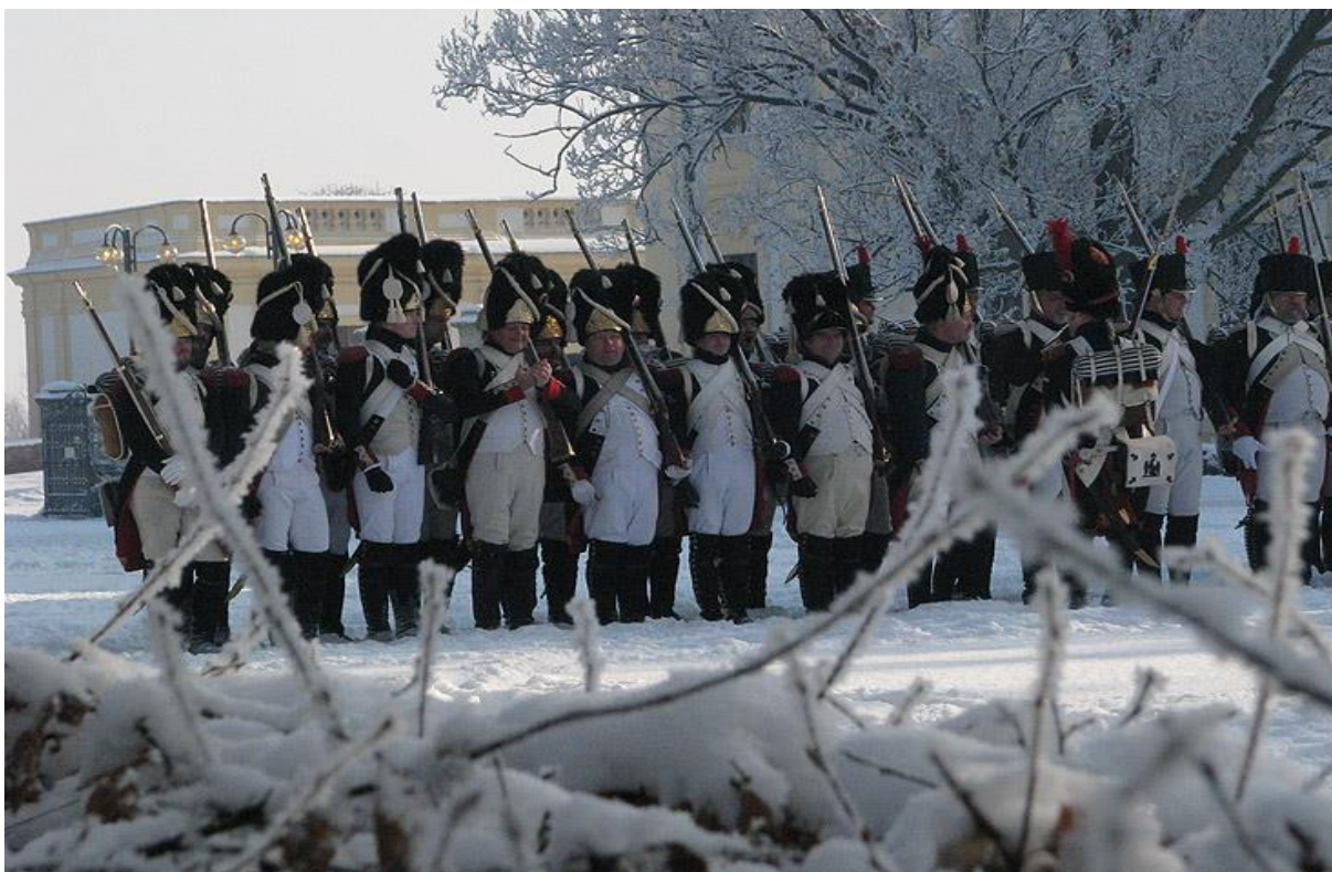
Nahoře: Jednotka GIA, Slavkov u Brna 2010 Dole: Granátníci GIA, bitevní pole u Jeny 2011