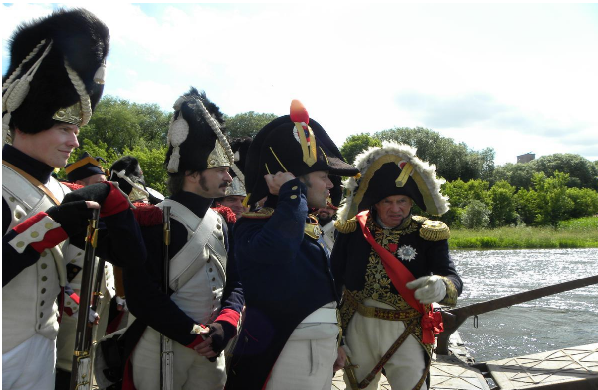
Nahoře: Překročení Němenu, Kaunas 2012