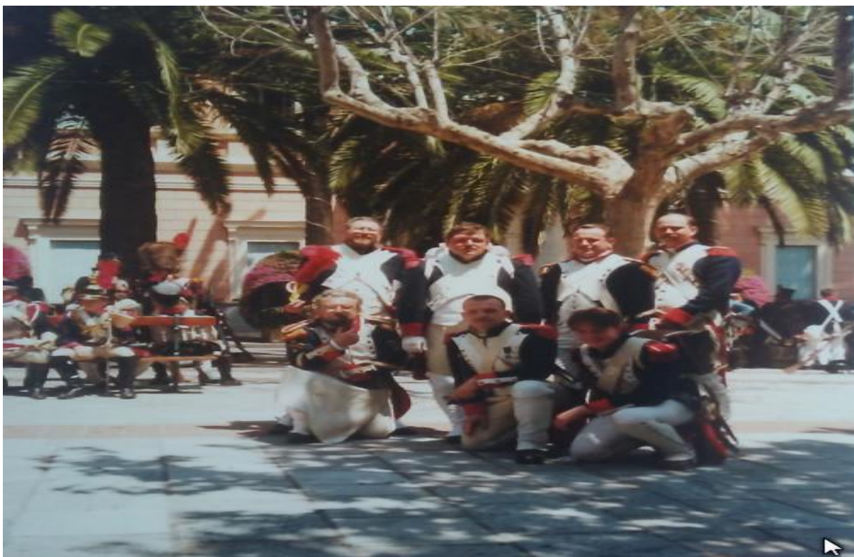
Nahoře: Členové GIA v Ajacciu roku 1997