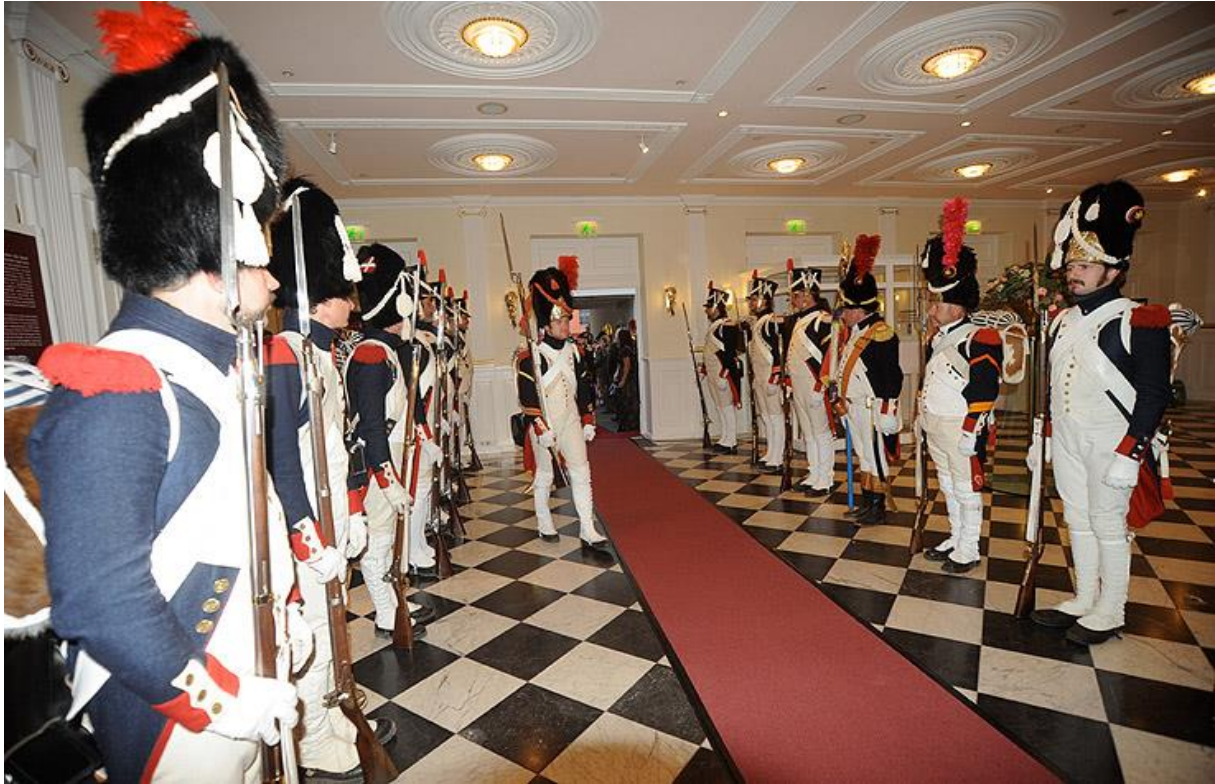
Nahoře: Kongres v Erfurtu, 2008