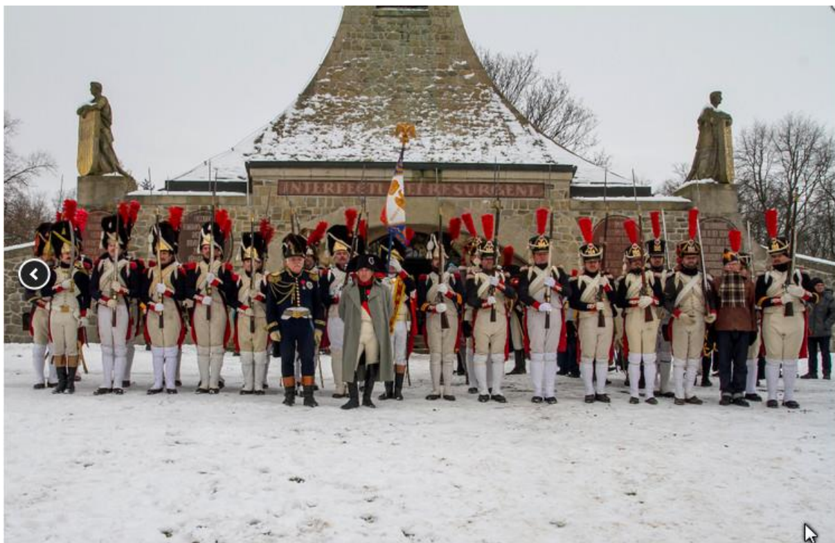
Jednotka La Garde Impériale d' Austerlitz při vzpomínkových akcích věnovaných bitvě u Slavkova 3. prosince 2017 na Mohyle míru.