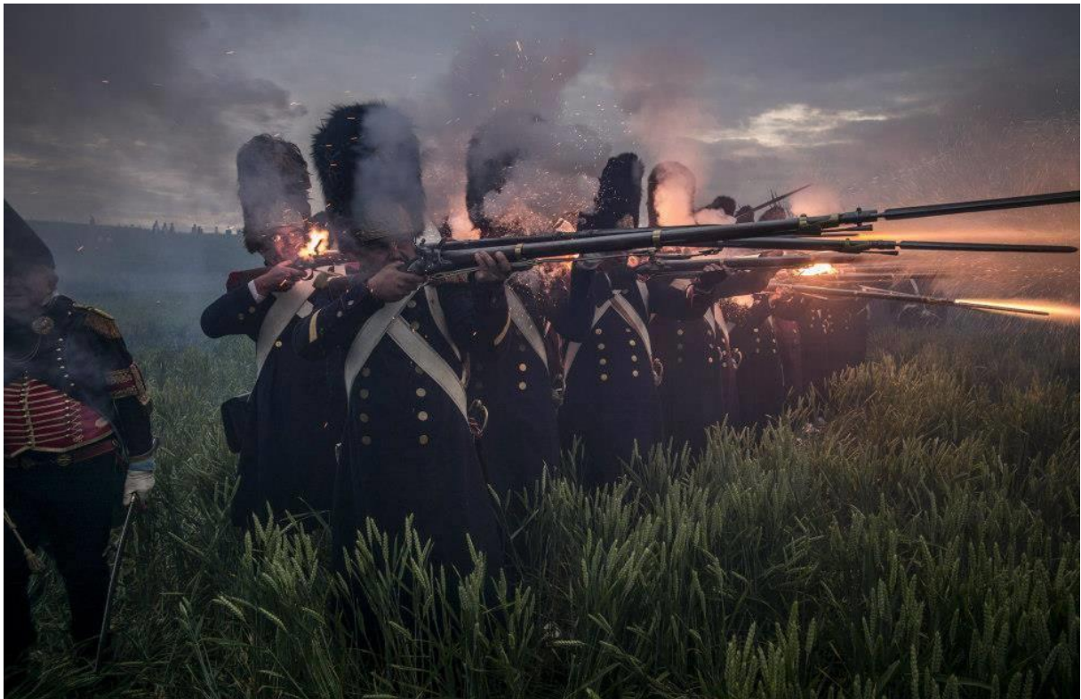
Dole: Waterloo, 2015