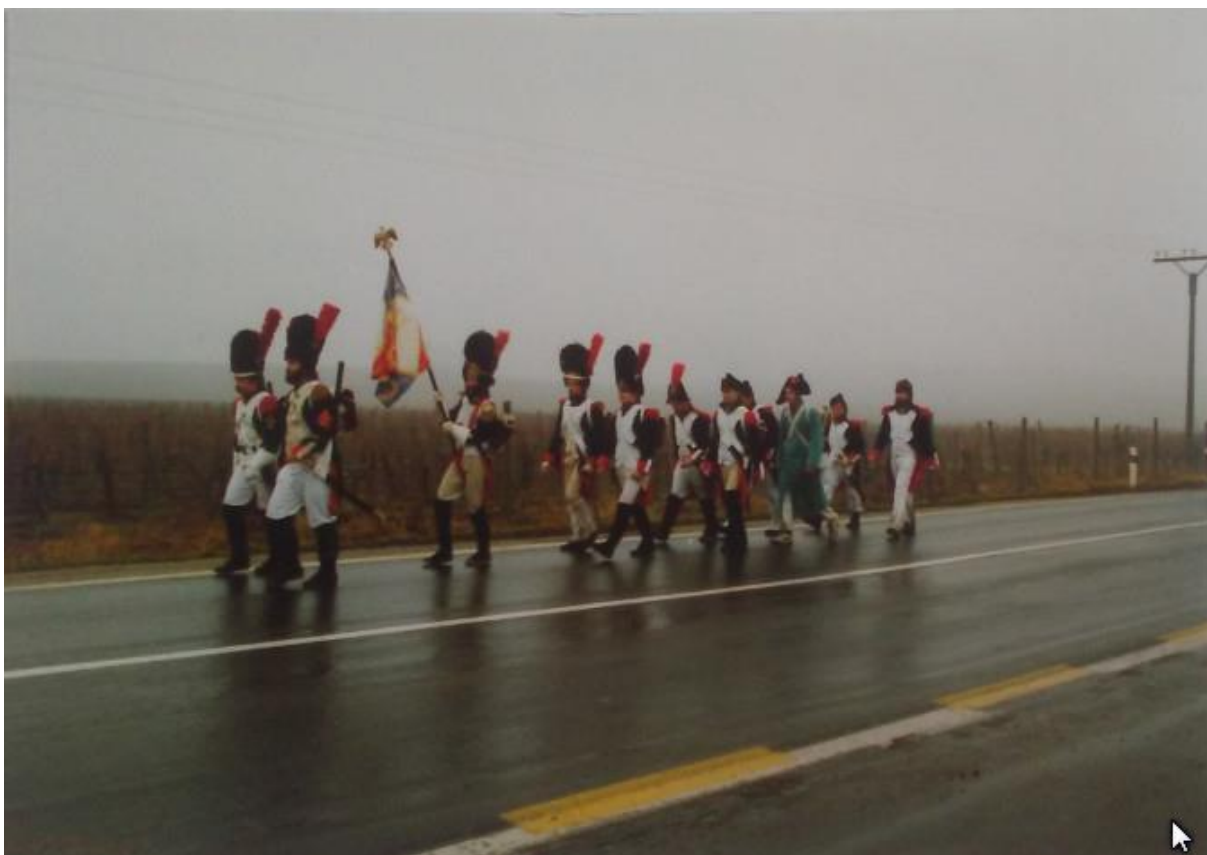
Dole: Friantův pochod, rok 1991