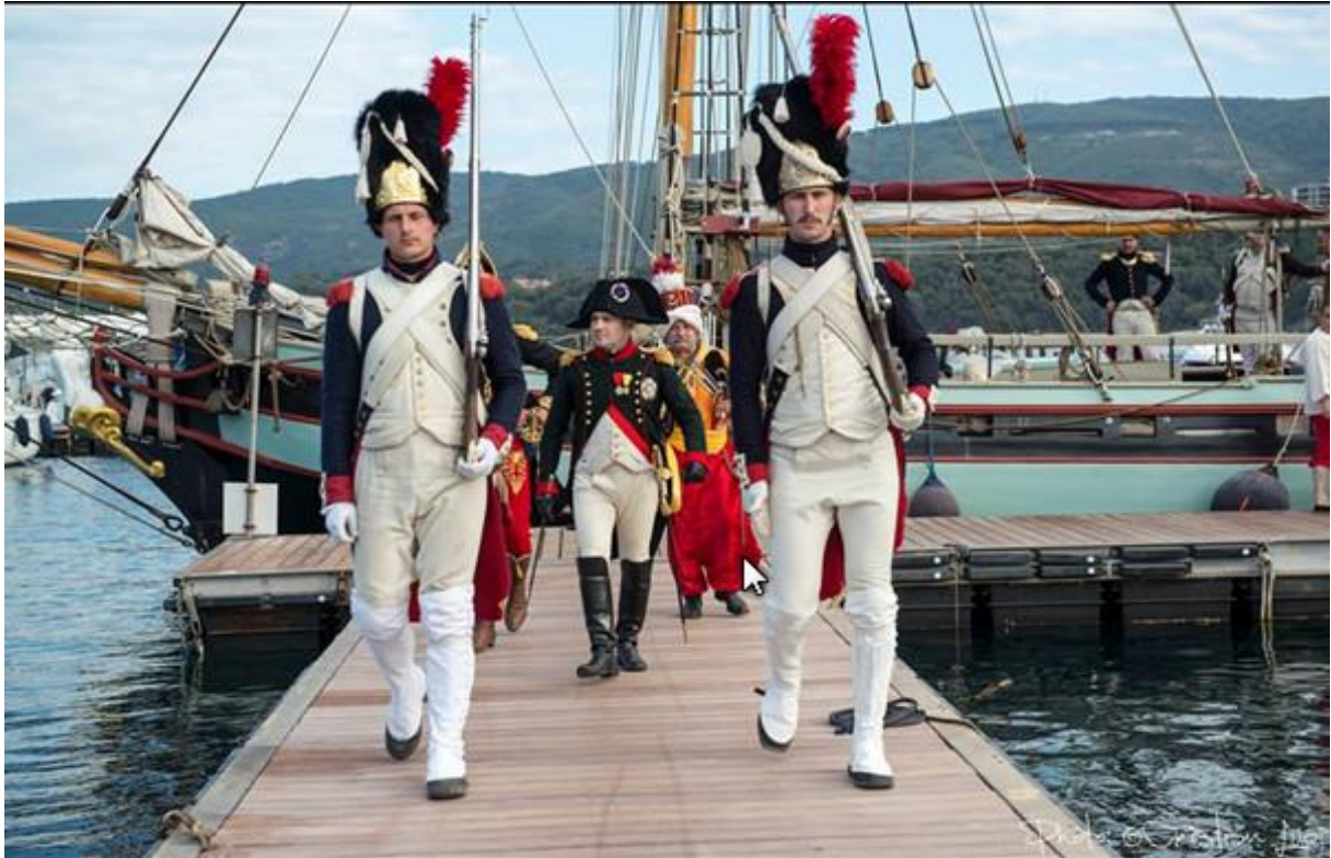
Nahoře: Příjezd císaře Napoleona na Elbu, Elba 2014