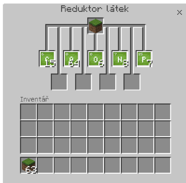
Obrázek 4: Reduktor látek

Úkoly vhodné ke zpracování v Minecraftu jsou například rozpoznávání toho, z jakých prvků se skládají věci kolem nás, pomocí reduktoru látek. Druhou možnou úlohou může být pro všechny žáky společné vytvoření periodické soustavy prvků pomocí nástroje na výrobu prvků. Žáci se rozdělí do skupin podle sloupců tabulky a na konci hodiny vytvoří kompletní tabulku prvků. Součástí knihovny Minecraftu je i výukový svět chemie, který nové nástroje představuje a zároveň žákům předává informace o bezpečné práci v laboratoři.