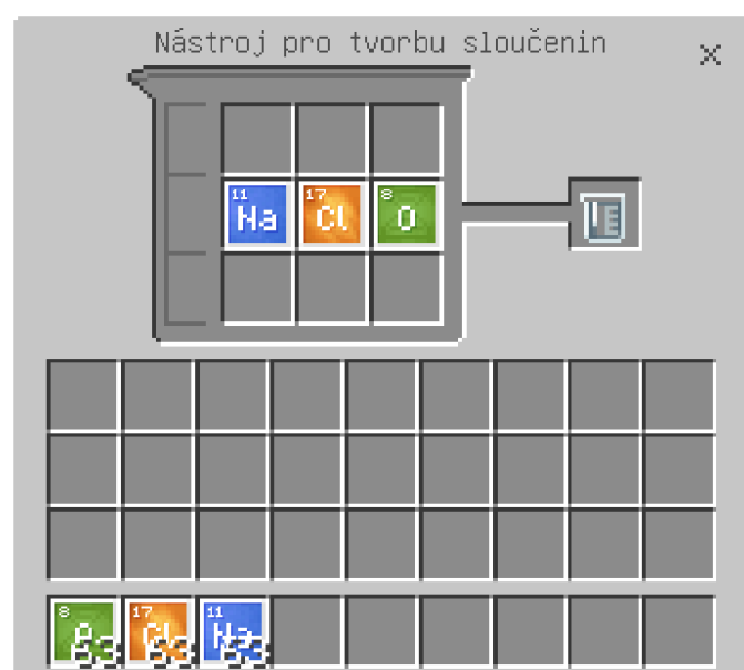
Obrázek 3: Nástroj pro tvorbu sloučenin