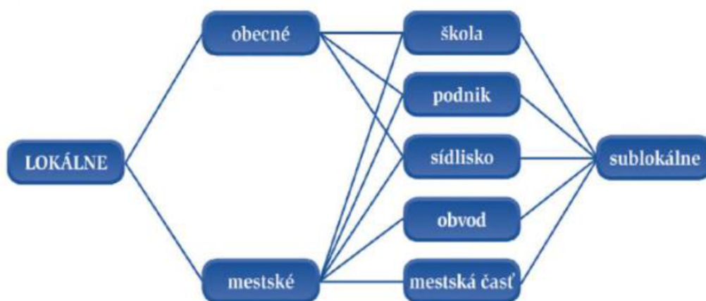
Obr.2 Schéma lokálních periodik podle Tušera

Vzhledem k tomu, že v lokalitách vydávají svoje prostředky masové komunikace i sublokální subjekty, např. školy, podniky, sídliště, obvody, městské části, mluví i o sublokálních periodikách – školních, podnikových (firemních), sídlištních, obvodních či městských částí.