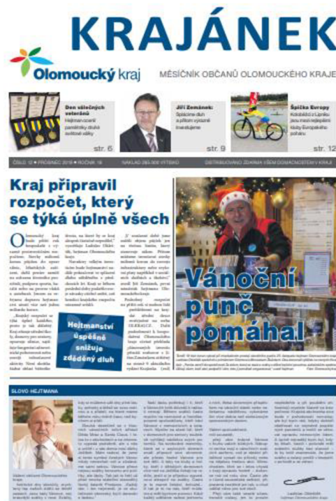
Obr.4 Titulní strana Olomouckého kraje prosinec 2019 – vydáván krajem

Čtenář má možnost si vybrat z více komerčních regionálních titulů, tato možnost u regionálního tisku vydávaného samosprávou není.