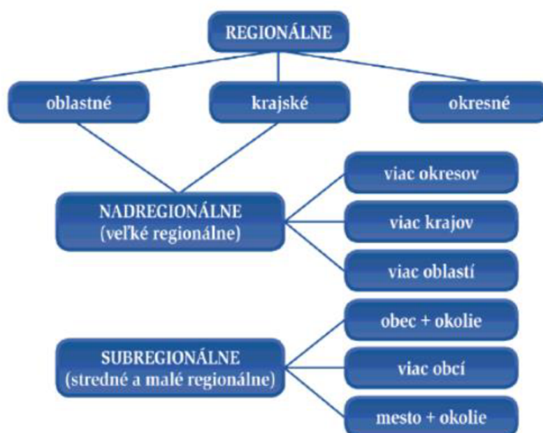
Obr.3 Schéma regionálních periodik podle Tušera

Krajská média, kterými se tato bakalářská práce zabývá, spadají pod regionální tisk, protože působí pouze v jednom regionu – kraji – a nepřesahují jeho hranice.