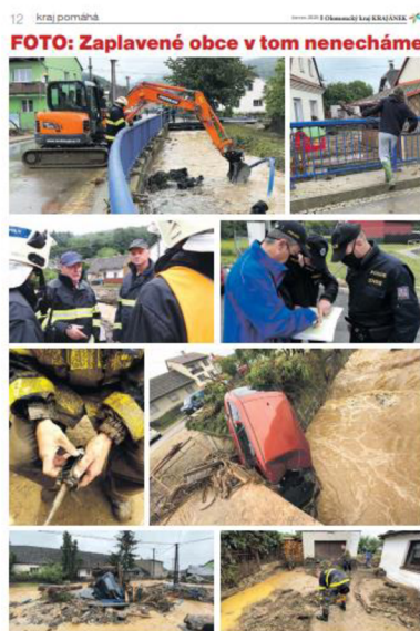
Obr.7 Ukázka fotoreportáže „Kraj pomáhá“

Většina rubrik se periodicky opakuje v každém čísle, jedná se o rubriky „Slovo hejtmána“, „Zpravodajství“, „Téma“, „Regiony“, „Příběhy, relax“, „Neziskové organizace“, „Zábava“, „Rozhovor“, „Inzerce“, „Kultura“.