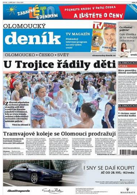
Obr.5 Titulní strana Olomouckého deníku září 2017 – komerční médium

Komerční média získávají zisk především z inzerce. Ta se vyskytuje v radničních novinách také, ale v menší míře. Například ve zkoumaném měsíčníku Olomoucký kraj (dříve Krajánek) je inzerci vyhrazena jedna strana a nikde jinde se reklamní bannery nenacházejí. V tom se liší od komerčního tisku, kdy se reklamní sdělení vyskytují téměř na každé straně, někdy i na titulní, jak lze vidět na obrázku č. 5.