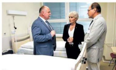
Už loni se za přispění Olomouckého kraje otevřelo v prostějovské nemocnici nové oddělení. Zdravotníci se tam starají o nevládně nemocné a umírající.

Pro Olomoucký kraj, který spolu s Hospicovou péčí Caritas odbornou konferenci organizoval, je téma paliativní péče jednou z dlouhodobých priorit. Na jejím systematickém zlepšování začalo hejtmantství pracovat jako jedno z prvních v Česku. Letos