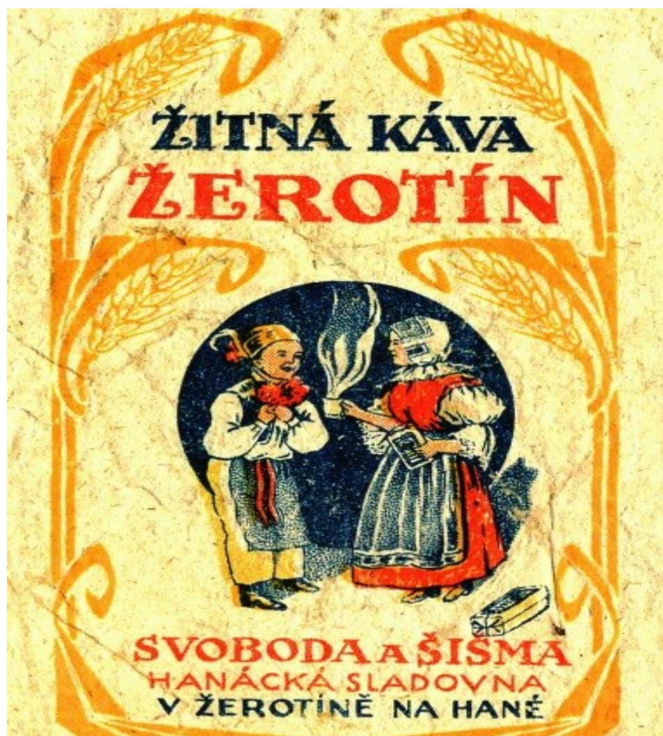
Dobová reklama na žerotínskou kávu (zdroj: O. F. Pol, Hnojice).