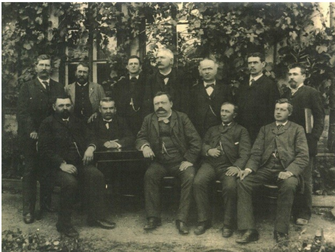
Představitelé Rolnicko-čtenářské besedy.