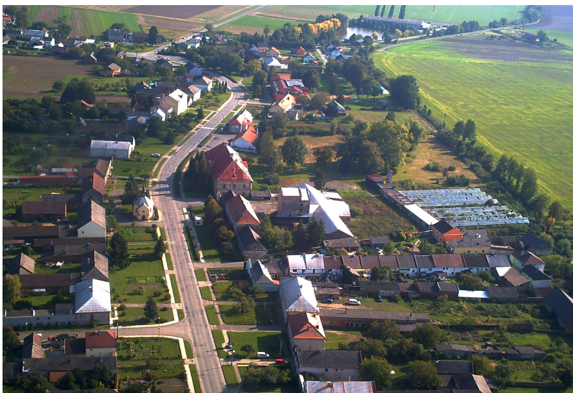
Letecký pohled na část obce Žerotín a na zámecký areál.