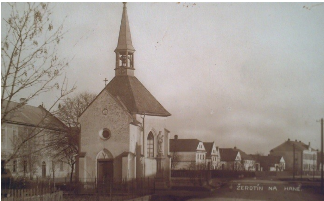
Kaple sv. Marty.