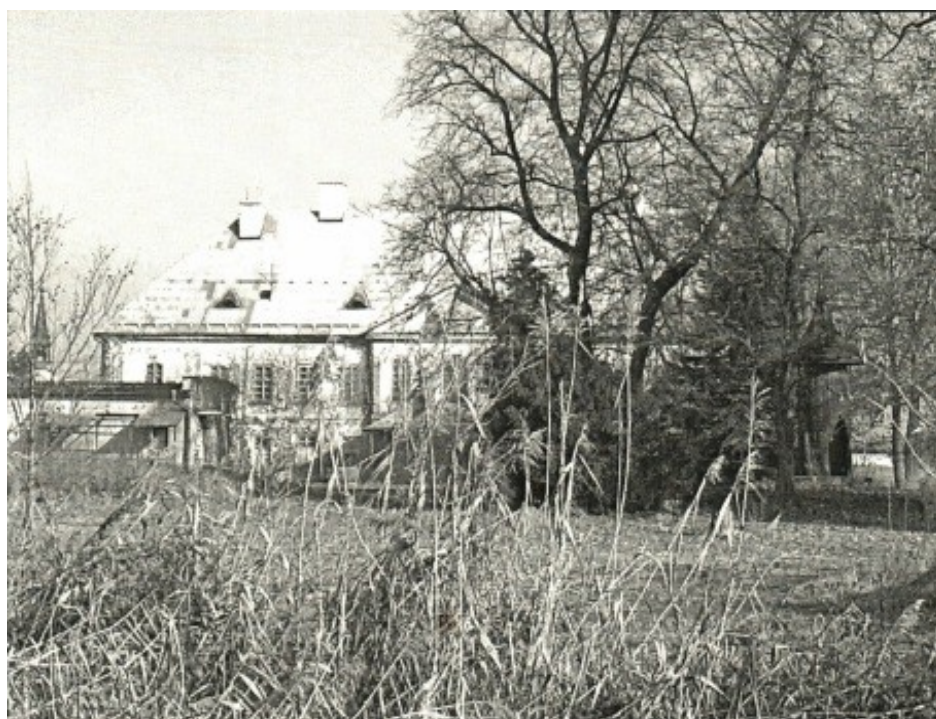
Stav zámeckého parku v roce 2010.