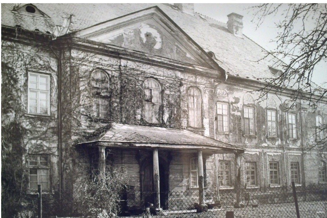
Průčelí a zadní trakt zámku.