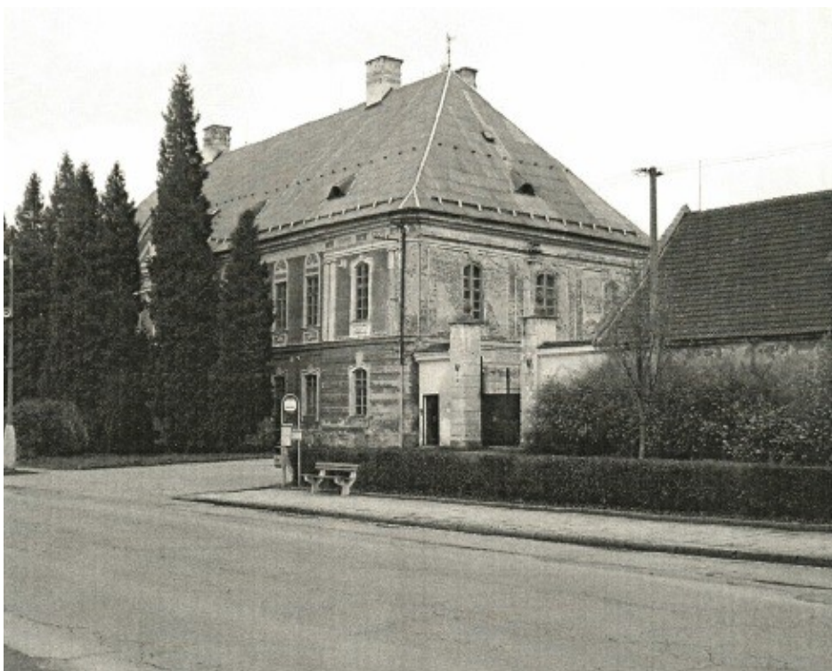
Stav zámku v roce 2010.