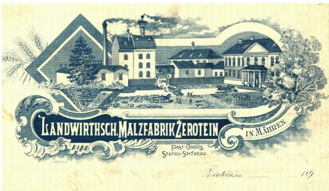
Rolnická sladovna v Žerotíně – německé znění firmy.