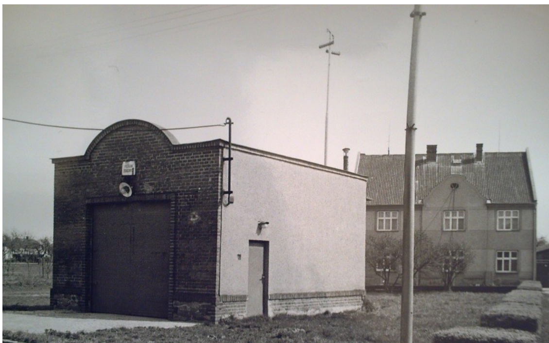
Hasičská zbrojnice z roku 1930.