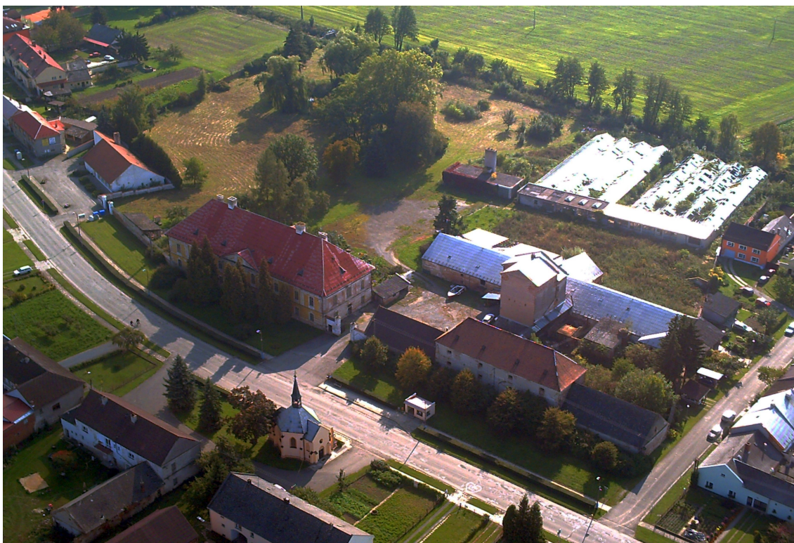
Zámecký areál s budovami sladovny a se zbytky parku (zdroj: V. Krejčí).