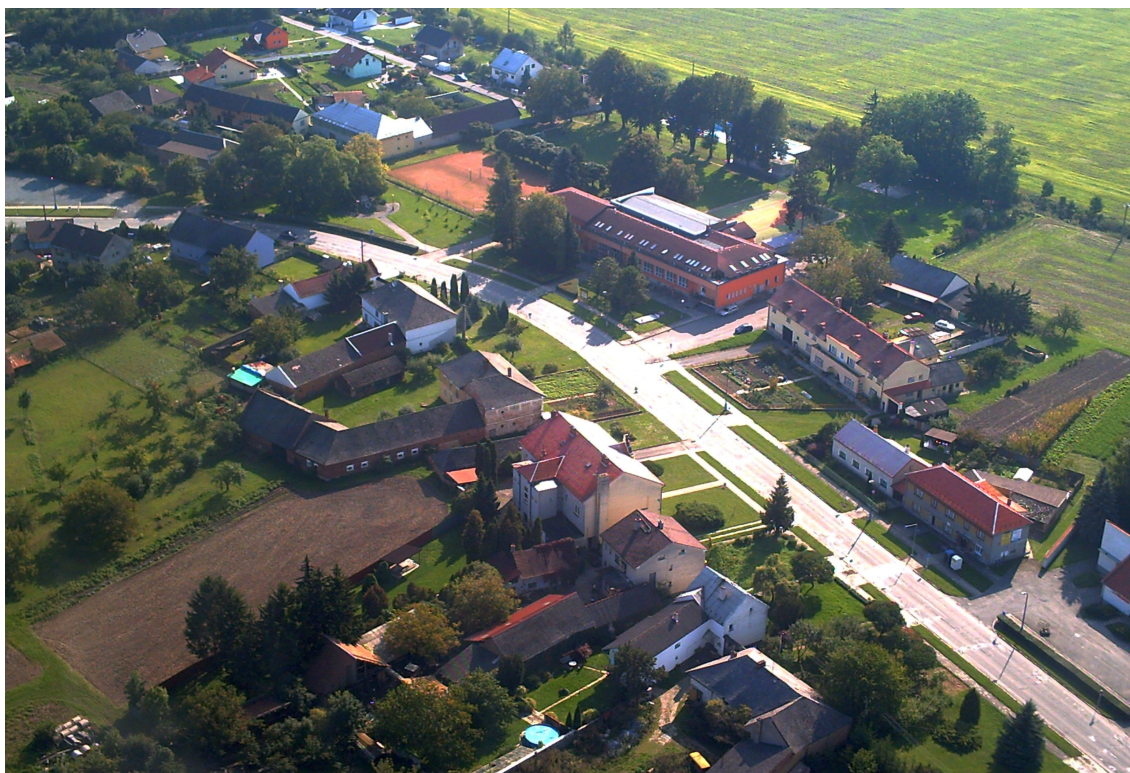
Letecký pohled na část obce Žerotín a na kulturní dům.