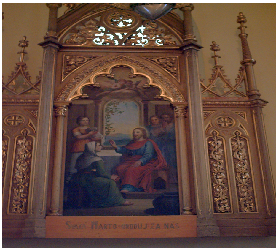
Oltářní obraz v kapli (zdroj: V. Krejčí).