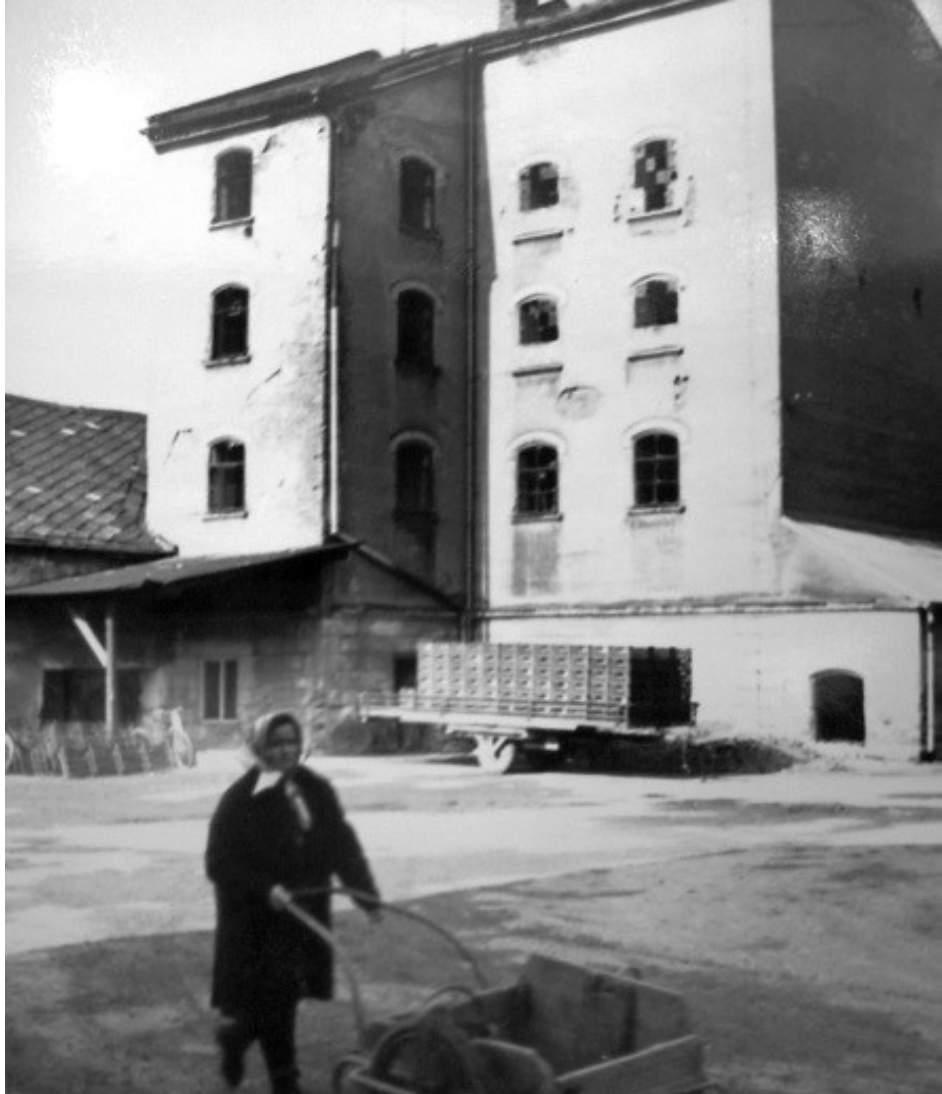
Část bývalé sladovny. Rok 1982.