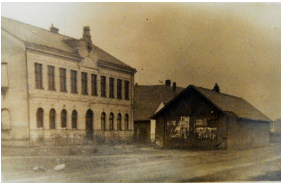
Budova nové školy z roku 1904 a obecní kůlna, která byla zbourána 17. 3. 1930.