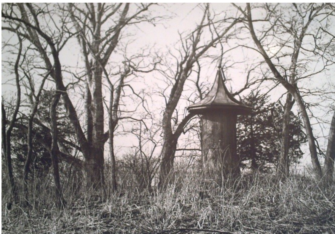
Torzo parku a zahradní altán z dubu (zdroj: Vlastivědné muzeum v Olomouci).