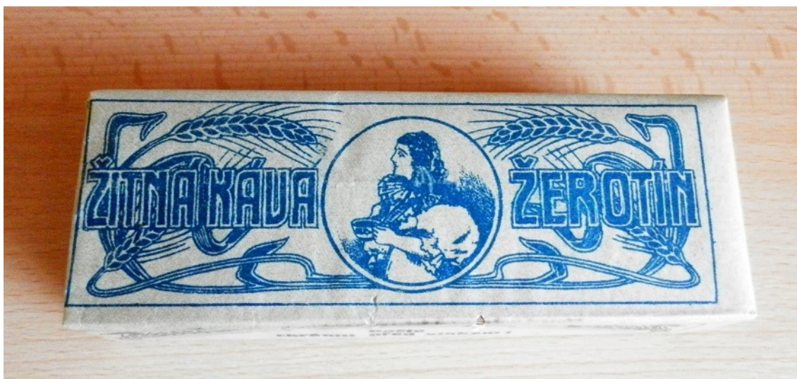
Obal výrobku žitné kávy. Výrobce byl jeden z následujících právních nástupců původní Rolnické sladovny v Žerotíně.