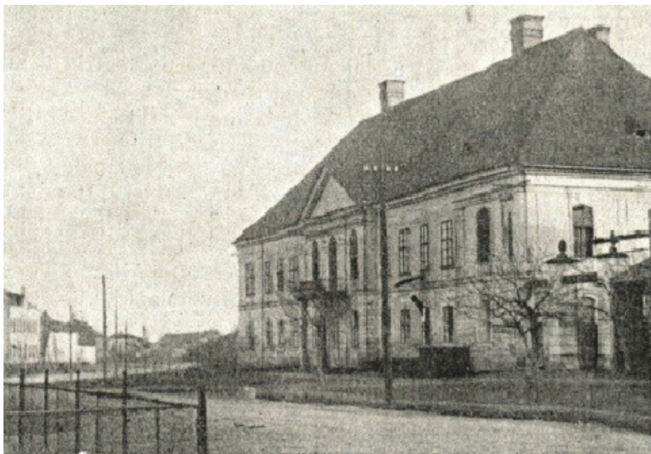
Stav zámku kolem roku 1931.