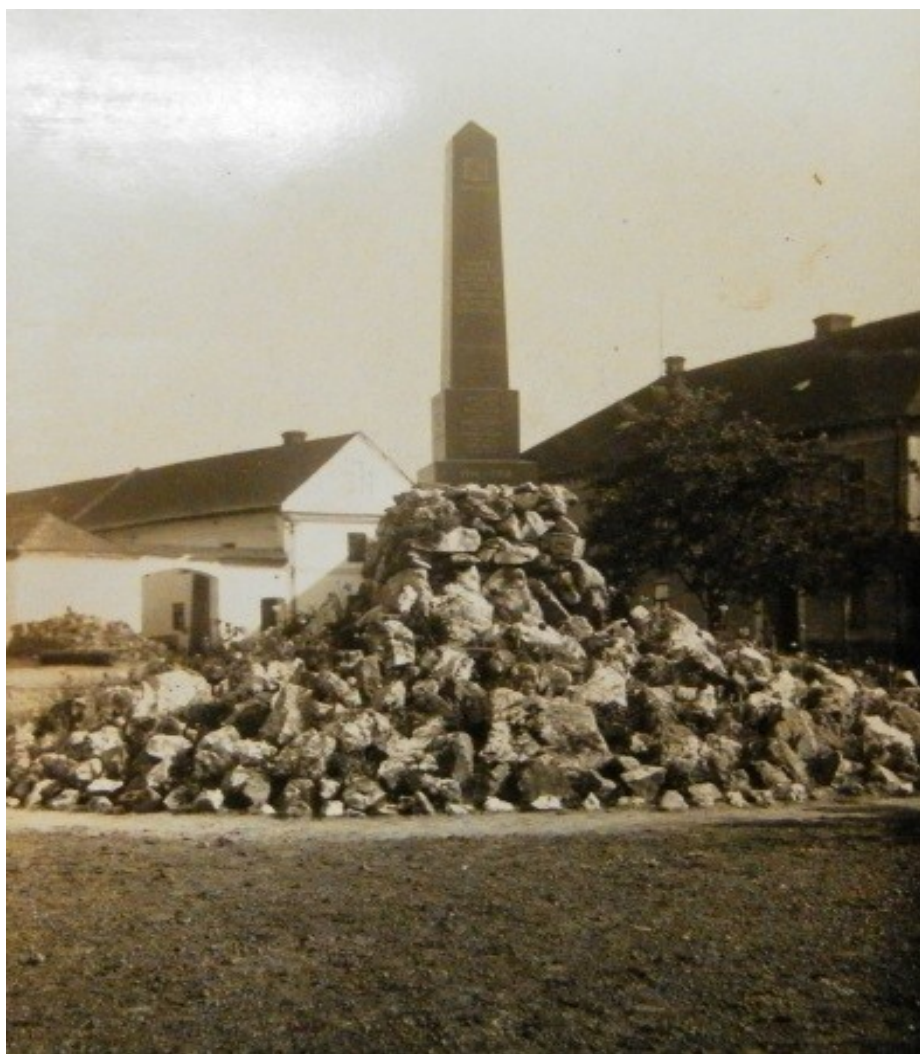
Původní podoba pomníku obětí první světové války. Byl postaven během roku 1930.