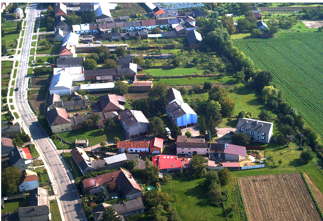
Letecký pohled na část obce Žerotín (zdroj: V. Krejčí).