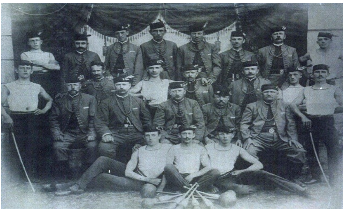
Tělocvičná jednota Sokol Žerotín.