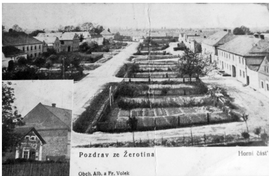
Žerotín – horní část obce.