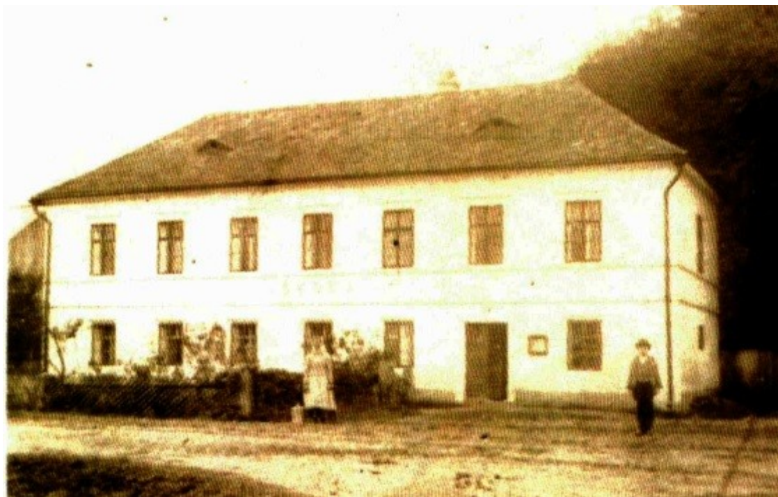
Budova staré školy.