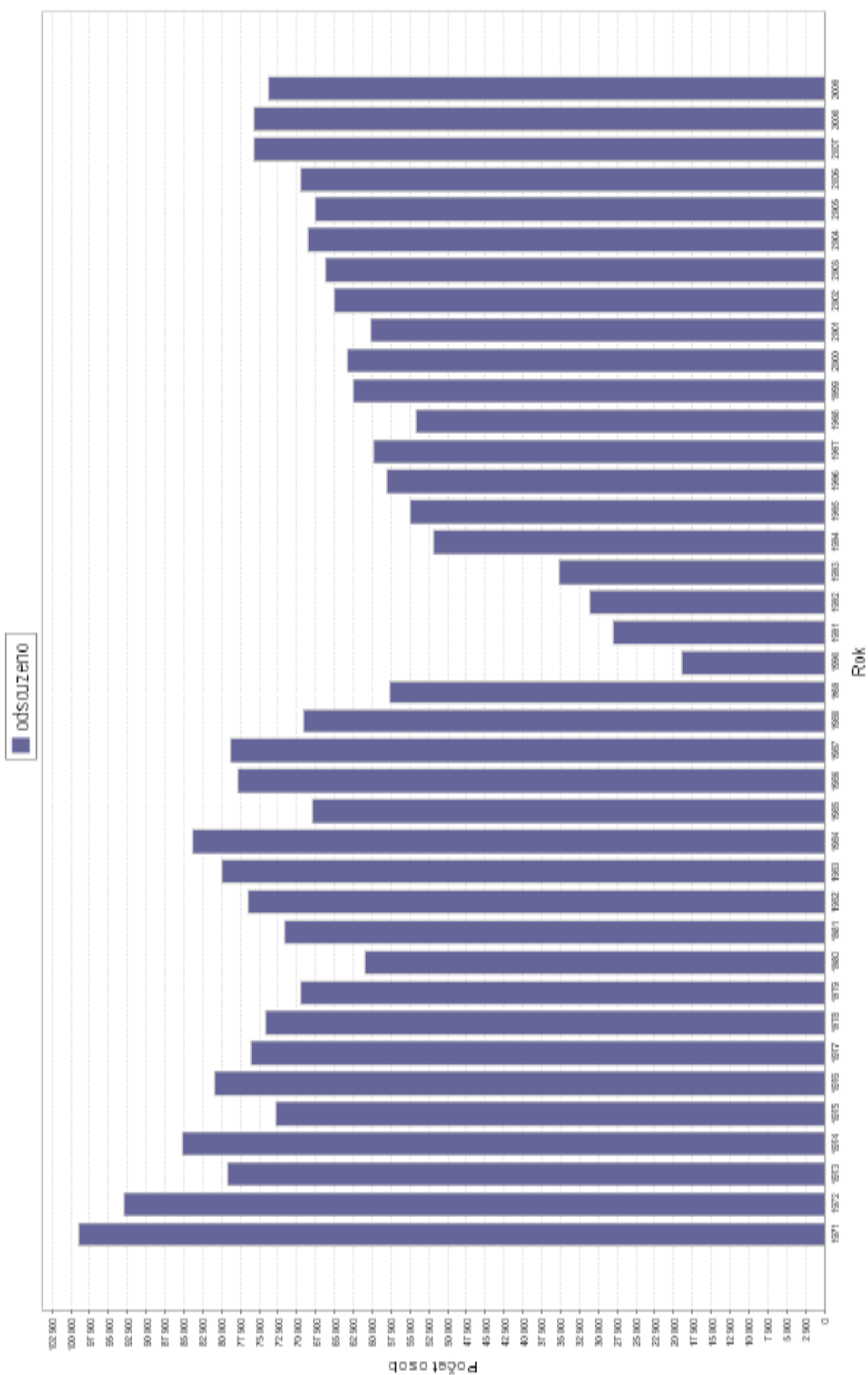
Počet odsouzených osob