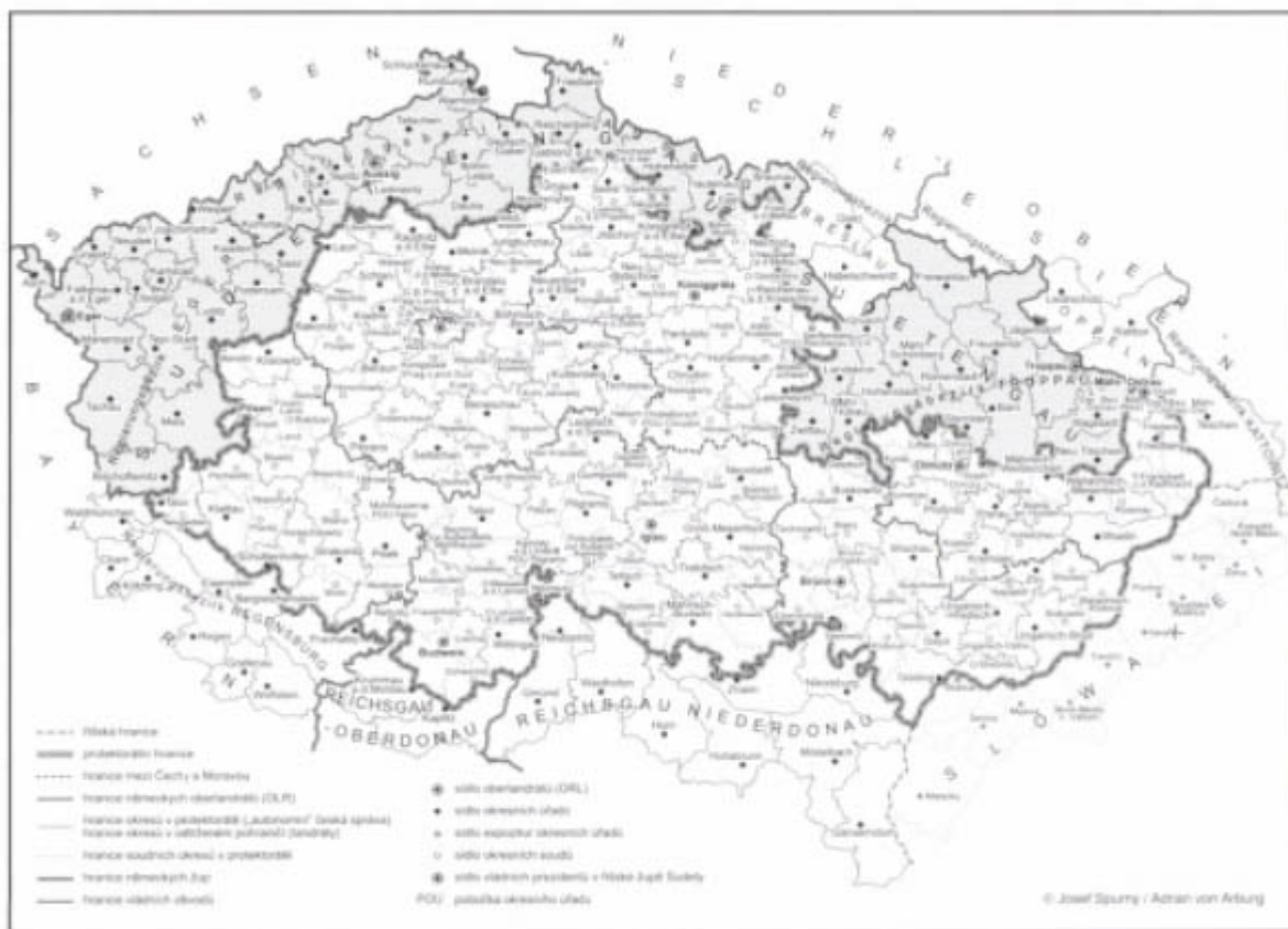
Mapa č. 3: Správní uspořádání Protektorátu Čechy a Morava a odtrženého pohraničí českých zemí (stav k 15. září 1942)