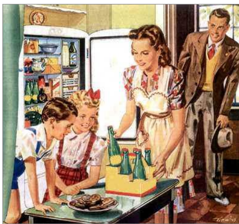
Obrázek 1: Americká rodina

A jak vypadala typická americká rodina? Otec zastával roli živitele. Matka zůstávala doma s dětmi a starala se o domácnost. Podle časopisu Life, z roku 1956, byla ideální žena prezentována jako společností oblíbená, 32letá žena,