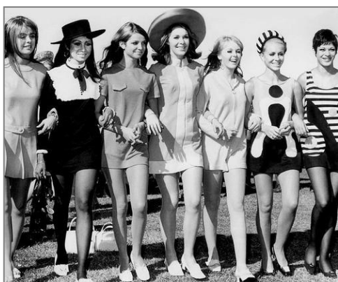
Obrázek 5: Móda ve Velké Británii

Rock'n'roll zpočátku rozhlasová stanice BBC odmítala. Nakonec ale k jeho vysílání svolila, ovšem pouze 2 hodiny týdně 13 . Mohla se tím ale uspokojit tehdejší nenasytná mládež? Odpověď je jednoduchá, nemohla. Začaly vznikat pirátské rozhlasové stanice např. Radio Caroline, Wonderful Radio London nebo Swinging Radio England. Tato rádia vysílala z mezinárodních vod, kde na ně nemohli zákonodárci z Velké Británie 14 . Nakonec si ale přišli na své, když v roce 1967 vydali zákon, který zakazoval britským inzerentům propagovat své výrobky či služby na pirátském rádiu (Marine Broadcasting Offences Act of 1967) 15 . Život