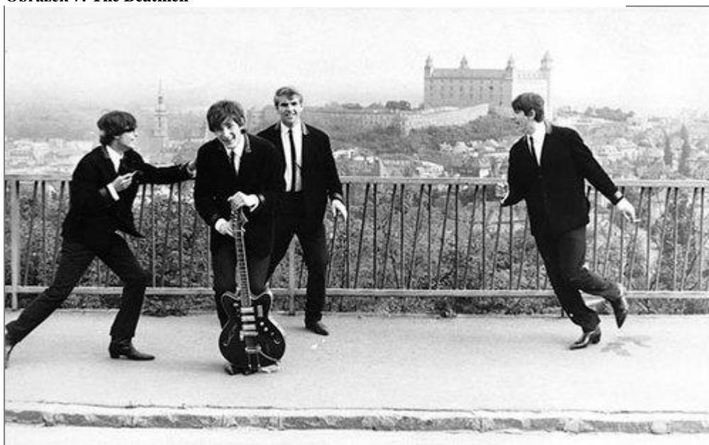
Obr. 7: Snímek zachycuje slovenskou skupinu The Beatmen. Je zde vidět velká podobnost s Brouky.