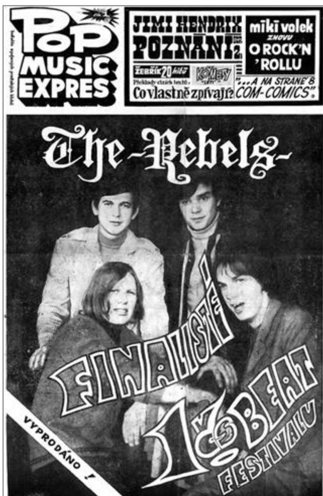
Obr. 10: První vydání Pop Music Expres s tématem 1. československého beatového festivalu.

O československém rock'n'rollu však nepsali jen hudební či kulturní redaktoři, ale také tiskové orgány Komunistické strany Československa, Rudé Právo, nebo Československé armády a tím byl Československý voják. Z těchto tiskoviny můžeme často cítit silný propagandistický podtext, který rock'n'roll nebere jako součást hudebního světa a jeho vývoje, ale jako zdegenerovaný směr ze západu kazící československou socialistickou mládež 67 . Výše zmíněný časopis Melodie roku 1963 otiskl článek, který jasně tento styl hájí. Ovšem podívejme se, co na rock'n'roll říká časopis Československý voják , který byl kulturně umělecký čtrnáctideník nejen pro vojáky, ale také pro širokou veřejnost.