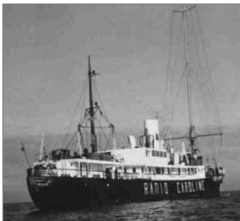
Obrázek 6: Rádio Caroline

V tuto dobu nastupují na scénu i legendární The Beatles, The Rolling Stones nebo The Who. Brouci z Liverpoolu nebyli ve svých počátcích tak pobuřující (mezi prvními singly „I Want To Hold Your Hand“) 17 . Pobouření společnosti přišlo až v roce 1966, kdy John Lennon prohlásil, že Beatles jsou populárnější než Ježíš Kristus 18 . Oproti tomu skupina proslavená písní „My Generation“, The Who, nabyla větší kontroverze, když při svých koncertech ničili hudební nástroje a tím se zapsali i do „50 momentů, které změnili rock’n’roll“ 19 .