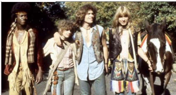
Obrázek 3: Hippies

Jako protest proti válce ve Vietnamu se zapsal i hudební festival ve Woodstocku v USA, který se konal v srpnu 1969. Je považován za jeden z největších a klíčových okamžiků v historii populární hudby. Zúčastnili se ho např. The Who, Jimi Hendrix, Janis Joplin aj. Značnou část účastníků tvořili právě