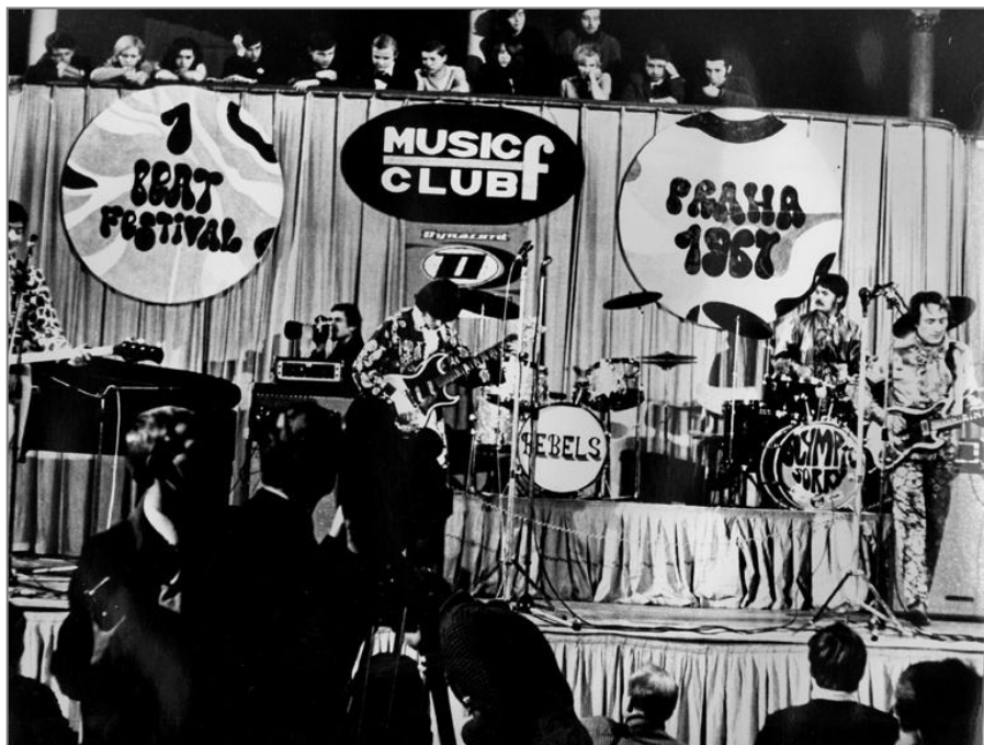
Obr. 8: Fotografie z 1. beatového festivalu. Jejich květinové oblečení je právě to, čím se vyznačovali vyznavači hnutí hippies.

Netrvalo dlouho a na scénu přišel i druhý beatový festival konaný v prosinci 22. – 23. 1968. Ve vzduchu byly ještě cítit srpnové události a právě rocková hudba se stala tím ventilem, ze kterého unikal všechn strach a vztek. Bylo to vidět například na vzhledu vystupujících, kde například skupina Blue Effect byla ověšena šátky a cinglárky. Někteří představitelé dokonce byli do půl těla. Nedalo se to ale brát jako veřejný politický protest, ale obyčejný generační vzdor.