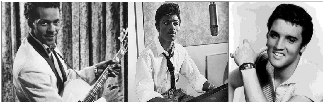
Obr. 2: zleva Chuck Berry, Little Richard, Elvis Presley.

Avšak i přes boj konzervativní společnosti se tento hudební styl rozšířil po celém světě.