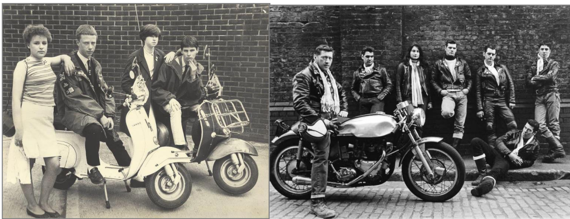
Obrázek 4: Mods a Rocers

„Rockers“ byla skupina zaměřena na motocykly – nosili tedy černé kožené bundy, těsné kalhoty, napomádované vlasy a spojoval je rock'n'roll. Oproti nim „Mods“ jako subkultura, byla charakteristická svou hudbou (jazz), módním oblečením, úhledně učesanými krátkými vlasy, tancem a skútry. Tyto gangy mezi sebou neustále vyvolávali ve Spojeném království konflikty, které vedly k nepokojům například v Brightonu, Margatu nebo Clactonu. Časopis Times je označil za „chuligány, kteří nechovají žádný respekt k osobám a majetku ostatních lidí“. I když se v 60. letech, většina z těchto subkultur obrátila pouze k hudbě, tato nálepka jim již zůstala 12 .